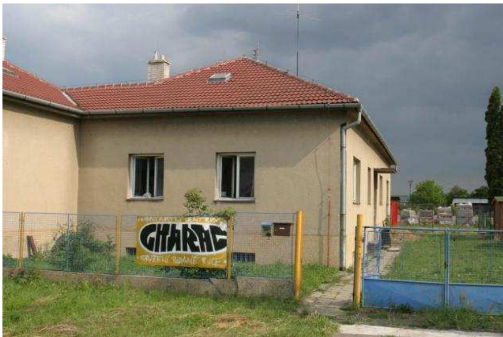
Kontaktní centrum „Charáč“ Uherské Hradiště