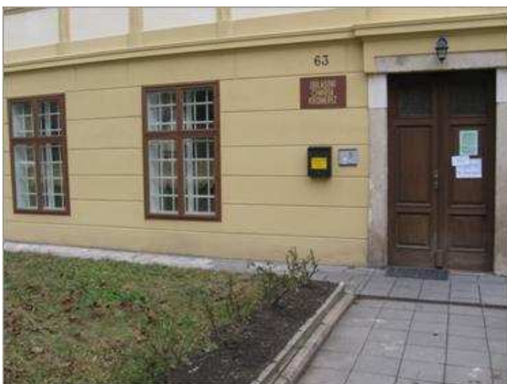
Kontaktní a poradenské centrum „Plus“ Kroměříž