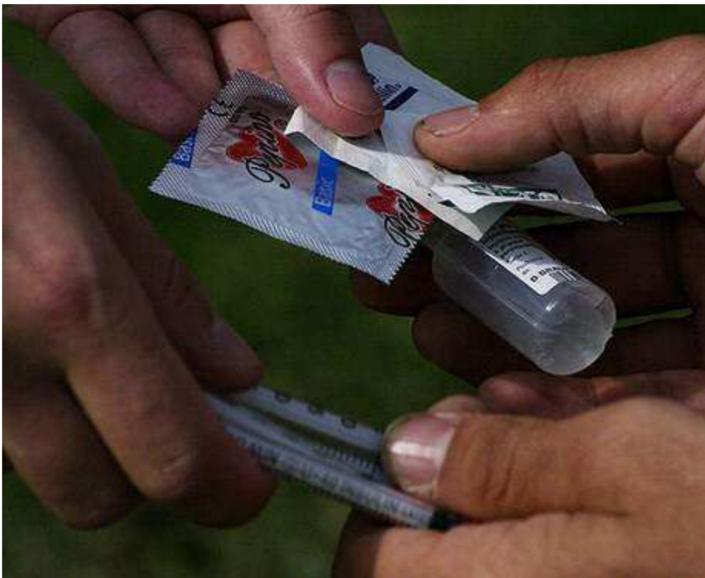
Předávání injekčních stříkaček