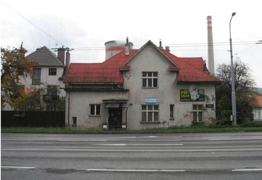
Kontaktní centrum o. s. Onyx Zlín