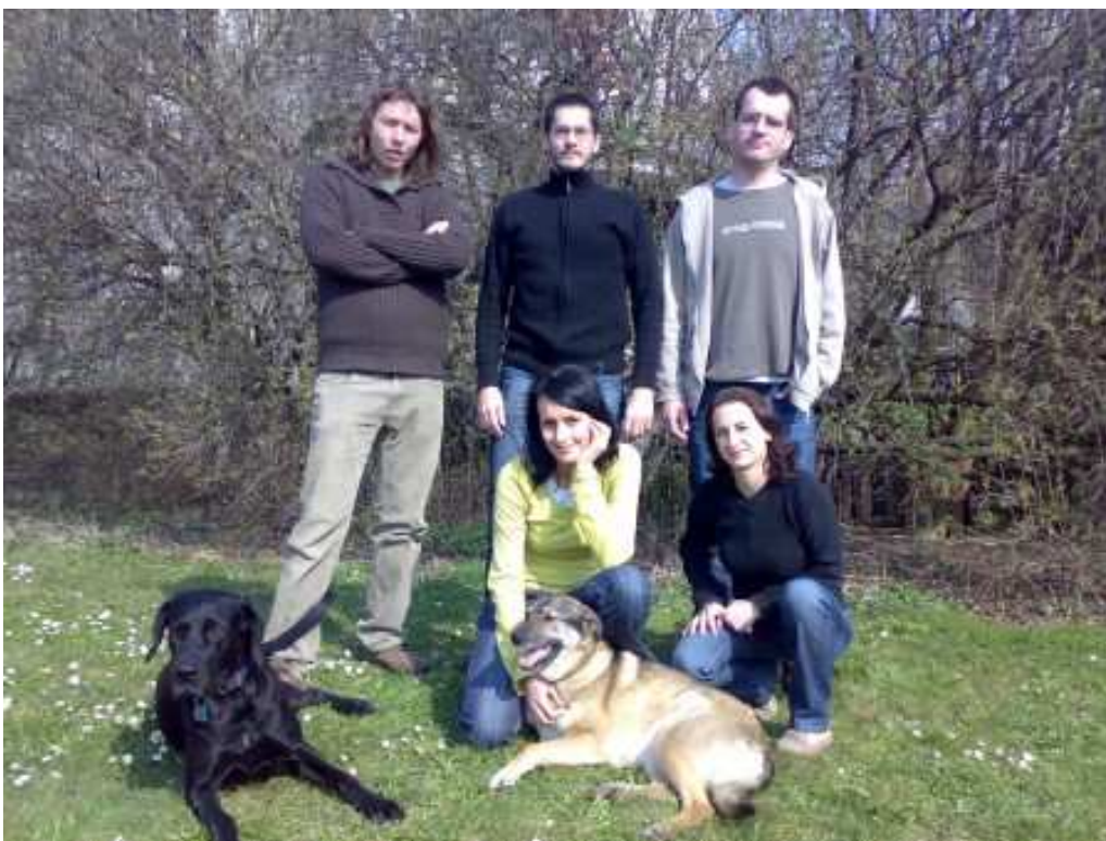
Pracovníci Kontaktního centra o. s. Onyx Zlín