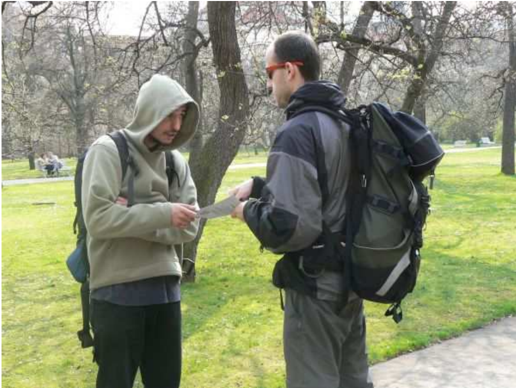
Předávání informačních letáčků