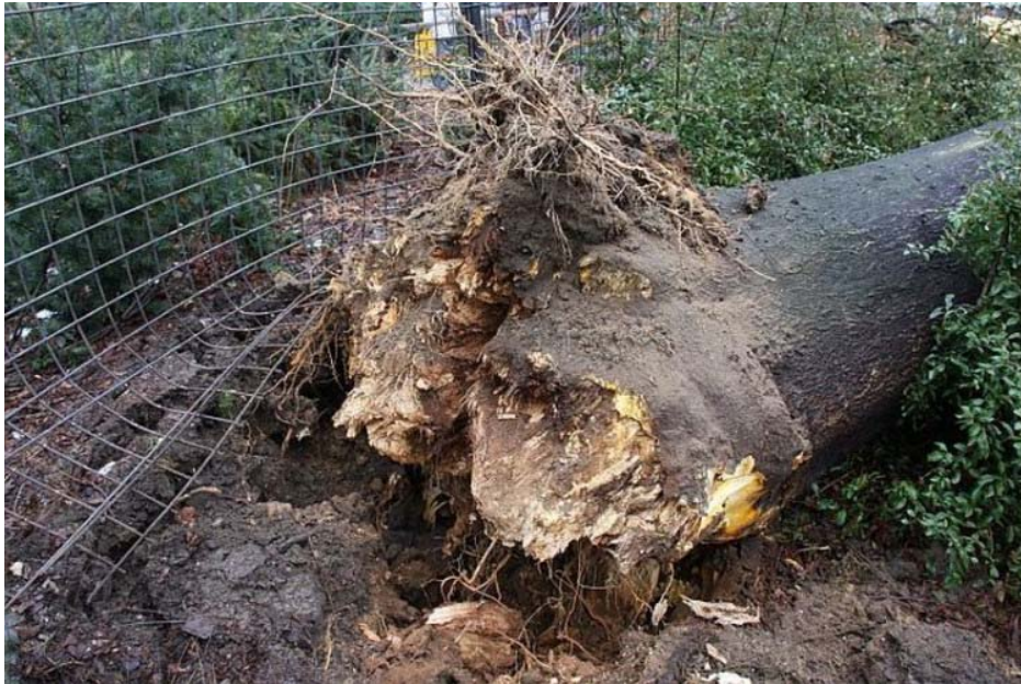
Příloha 1 - vadný kořenový bal