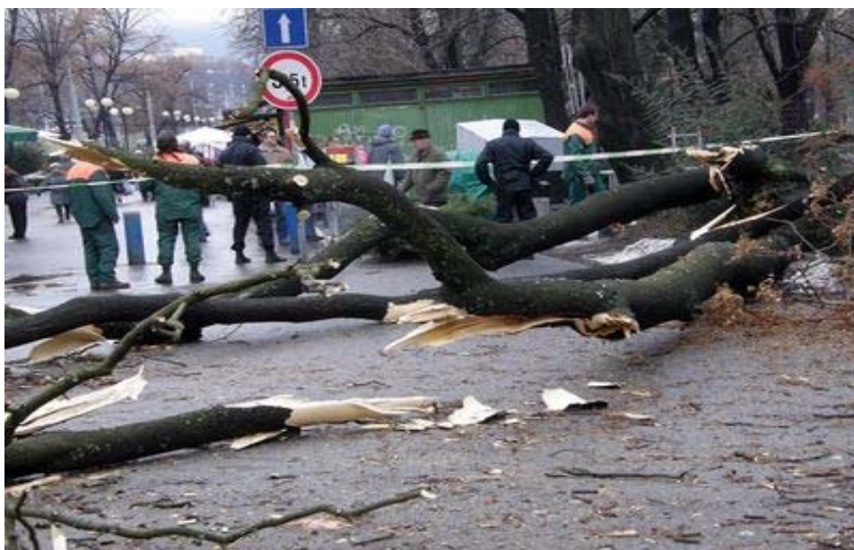
Příloha 3 - spadený strom u tržiště Pod kaštany