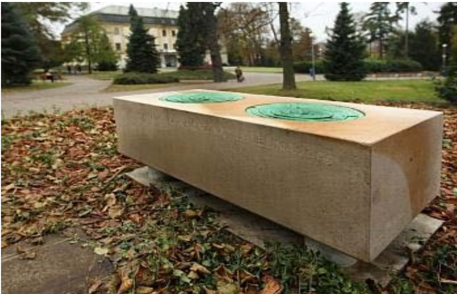
Příloha 2 - fontánka