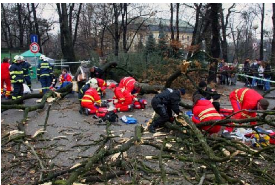
Příloha 4 - místo tragédie pár minut po pádu stromu