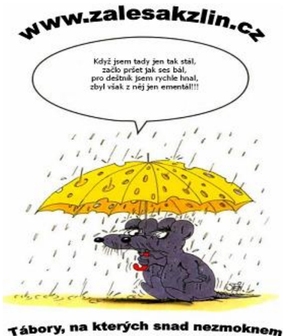
Obrázek 3 - Propagační leták II

lení je vydáno vždy v případě, že se organizace účastní soutěží pod hlavičkou města Zlína jako jedno ze stanovišť. Součástí Dne Země je prezentace a zlepšování image organizace a horolezecká stěna každoročně přiláká velké zástupy lidí. Tato konstelace pak umožňuje přímo u stanoviště oslovení mnoha nadšených dětí a rodičům dá příležitost se informovat o všech možných náležitostech, které je zajímají. Třetí vlna propagace bude kromě táborů propagovat také internetové stránky, které budou v samotném projektu rozhodující, neboť budou obsahovat revoluční novinku „Videa dne“. Pozornost bude zaměřena opět na leták, který by měl humornou formou upozornit na webové stránky i na samotné tábory. Na obrázku 3 je návrh, jak by takový leták mohl vypadat, opět ve formátu A6. Může být tištěn jak na bílý, tak i na barevný papír.