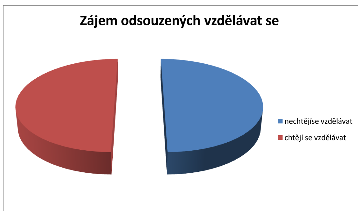
graf 3: zájem odsouzených o vzdělávání při výkonu trestu.

Více jak polovina odsouzených se chce při výkonu trestu dál vzdělávat.