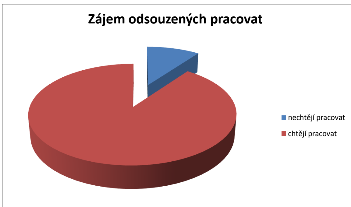
graf 2: zájem odsouzených o práci při výkonu trestu

Více jak 2/3 odsouzených má zájem pracovat.