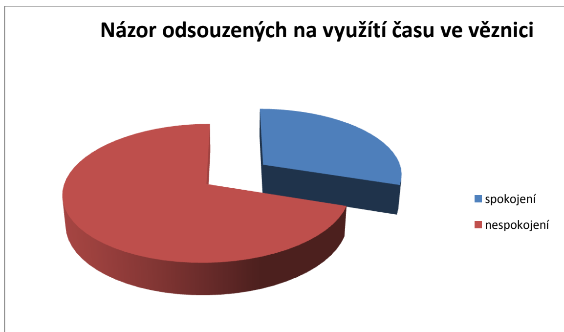
graf 1: názor odsouzených na využití času stráveného ve věznici

Více jak polovina odsouzených není spokojena s využitím času stráveného ve věznici.