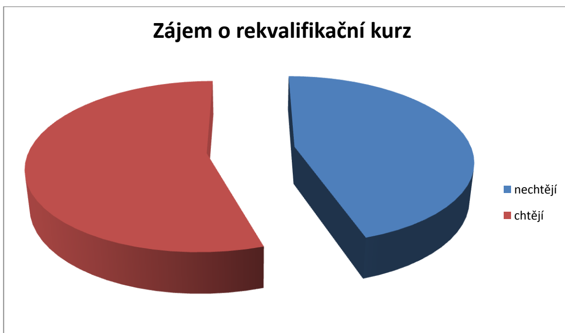
graf 4: zájem odsouzených účastnit se nějakého rekvalifikačního kurzu

Více jak polovina odsouzených má zájem účastnit se nějakého rekvalifikačního kurzu.