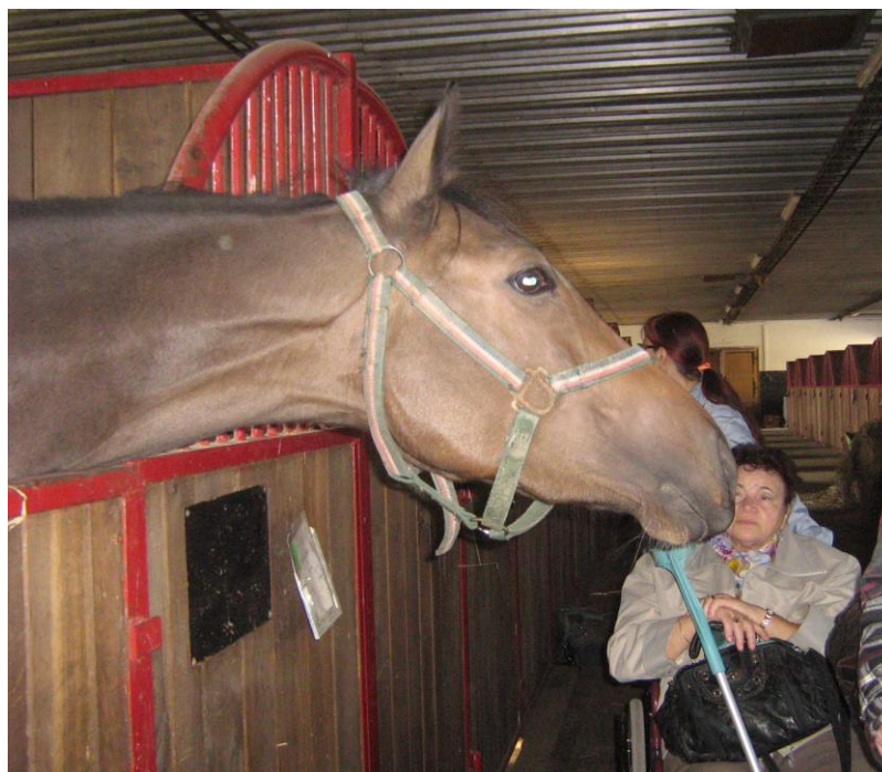
Zájezd do hřebčína v Napajedlích