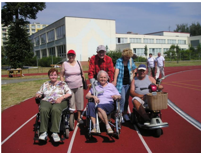
Sportovní hry seniorů – hřiště ZŠ Oskol v Kroměříži, klient B stojící uprostřed