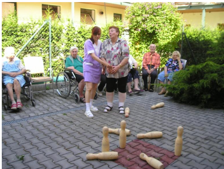
Prázdninová kuželkářská liga – turnaj v ruských kuželnkách