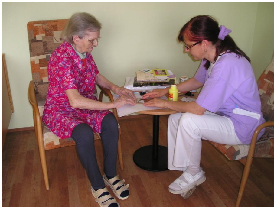
Sbírání citátů – fáze lepení vystříhaných citátů do sešitu