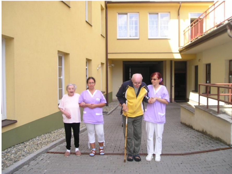
Procházka po dvorku domova