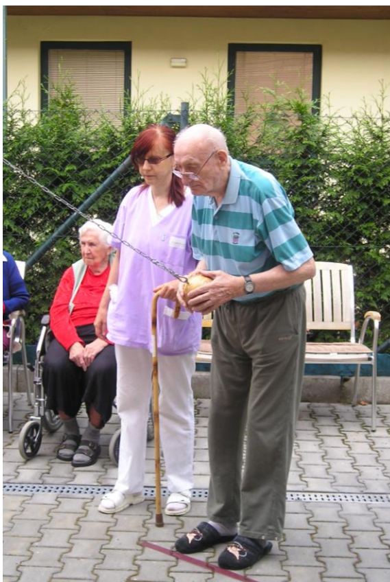
Prázdninová kuželkářská liga – turnaj v ruských kuželnkách