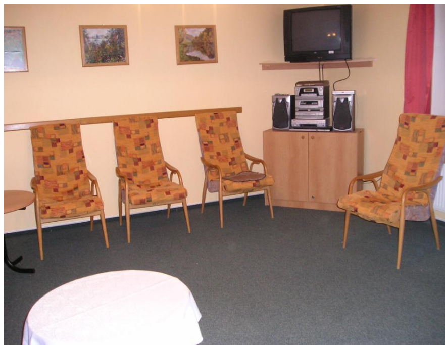
Klubovna v budově č. 2