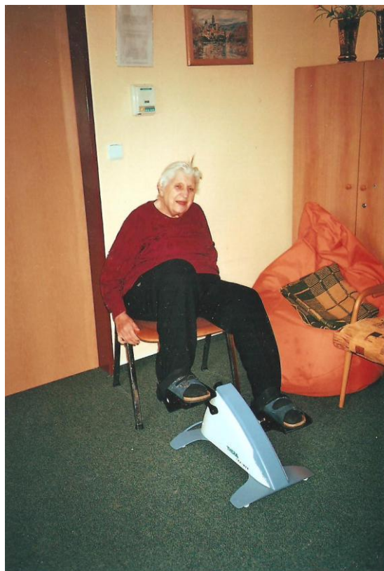
Cvičení na šlapadle