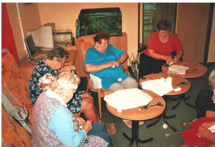
Kroužek ručních prací – vyvazování batiky, klientka C druhá zprava