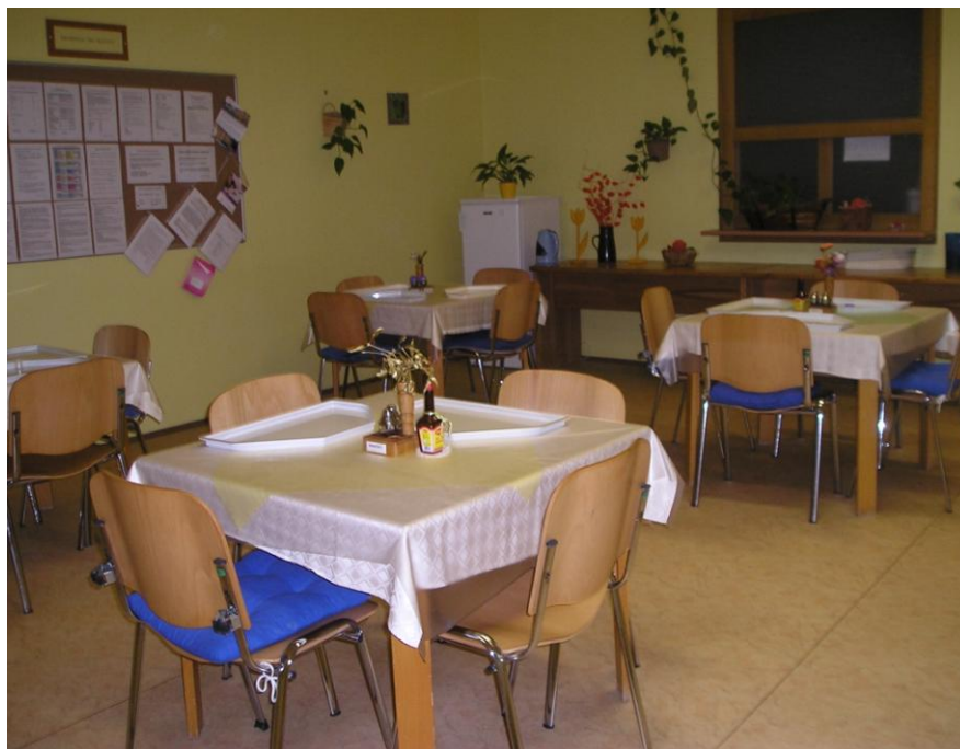
Jídelna v přízemí budovy č. 2