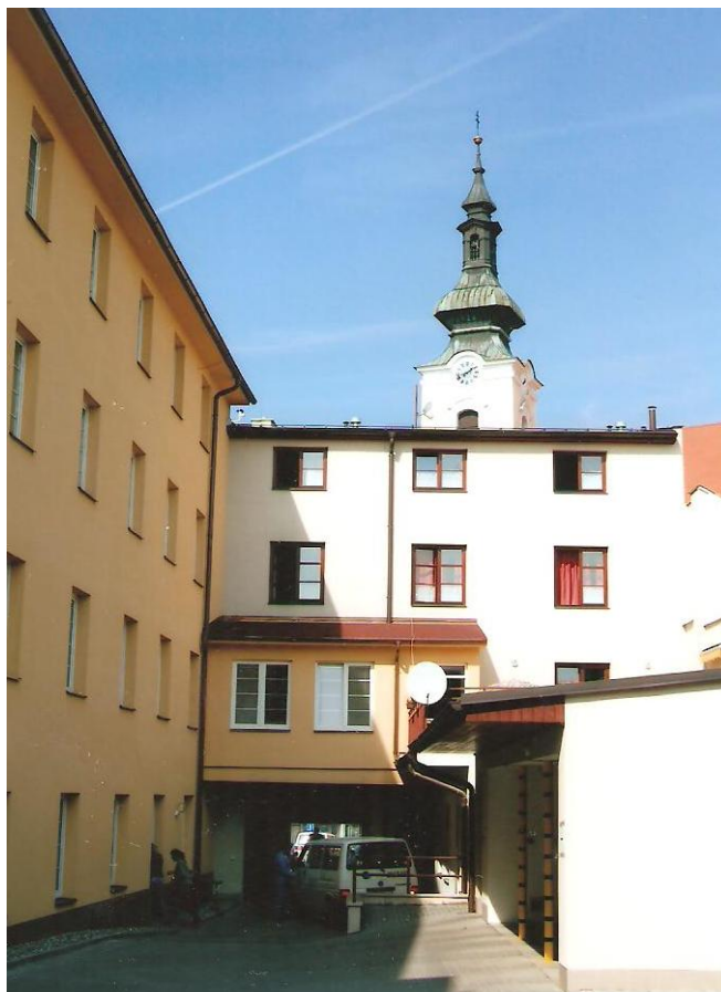
Pohled ze dvora na budovu č. 2, vlevo budova ošetrovateľského oddelení