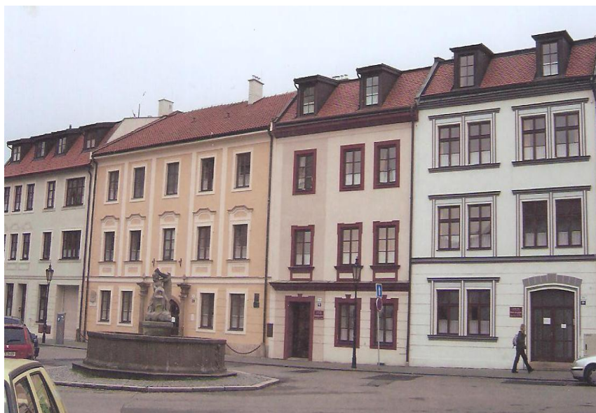
Celkový pohled na domov z Riegrova náměstí