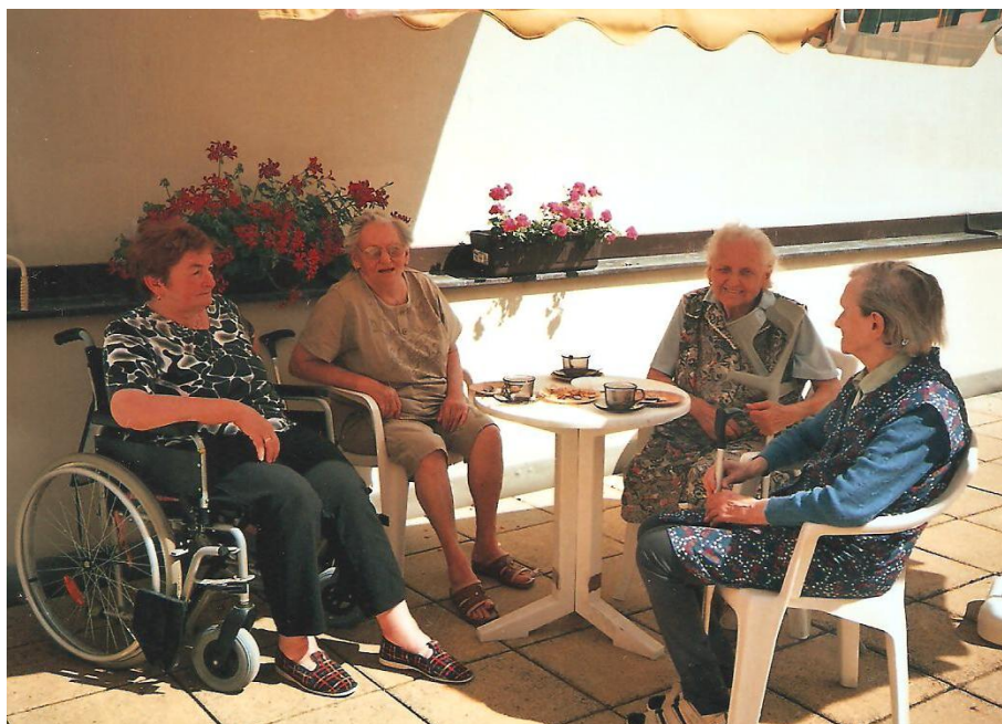
Kavárnička pro dříve narožené – posezení na terase domova, klientka A první zprava