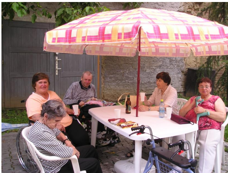
Grilování špekáčků na dvorku domova – klientka C první zprava