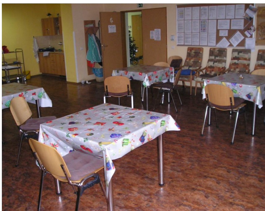
Jídelna v 1. patře budovy č. 3