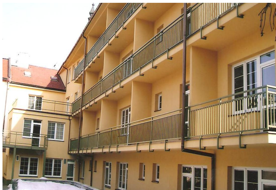
Pohled ze dvora na budovu ošetrovatelského oddělení (budova č. 3)