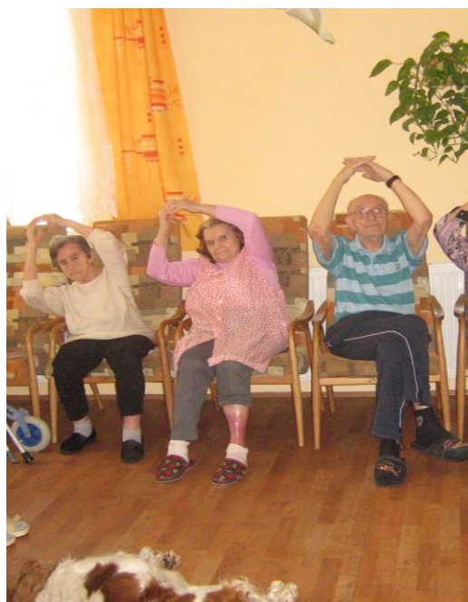
Tanečky pro seniory – cvičení vsedě na židlích při hudbě