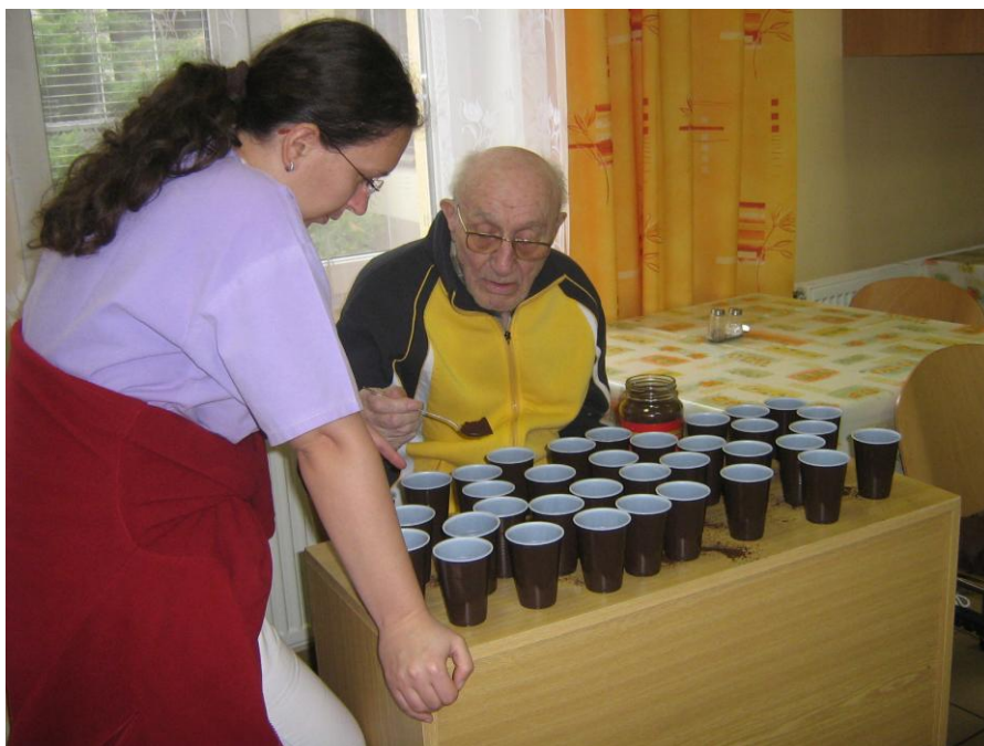
Kancelářský víceboj – vaření kávy