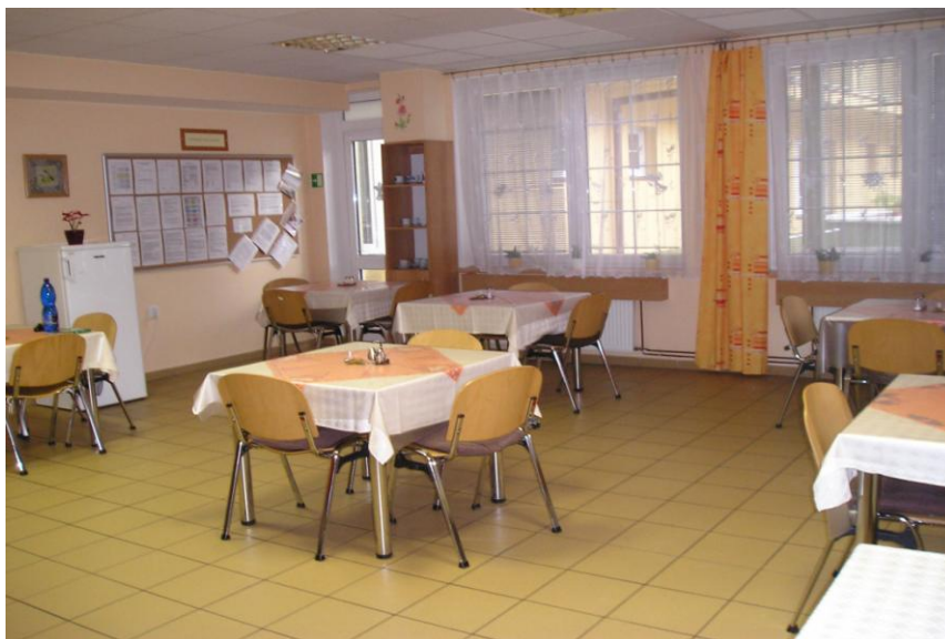
Jídelna v přízemí budovy č. 3