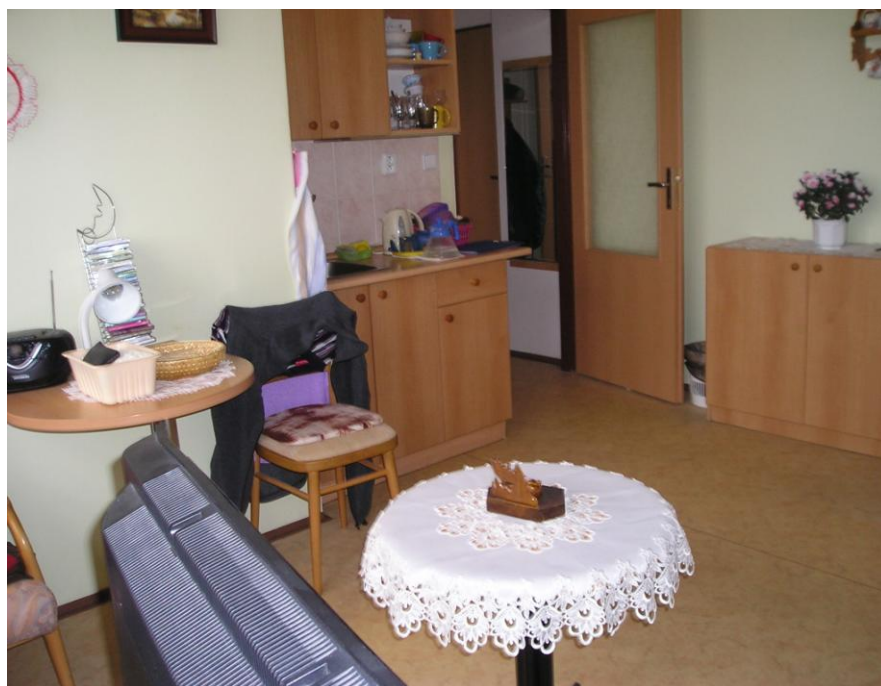
Vybavení jednolůžkového pokoje na budově č. 2