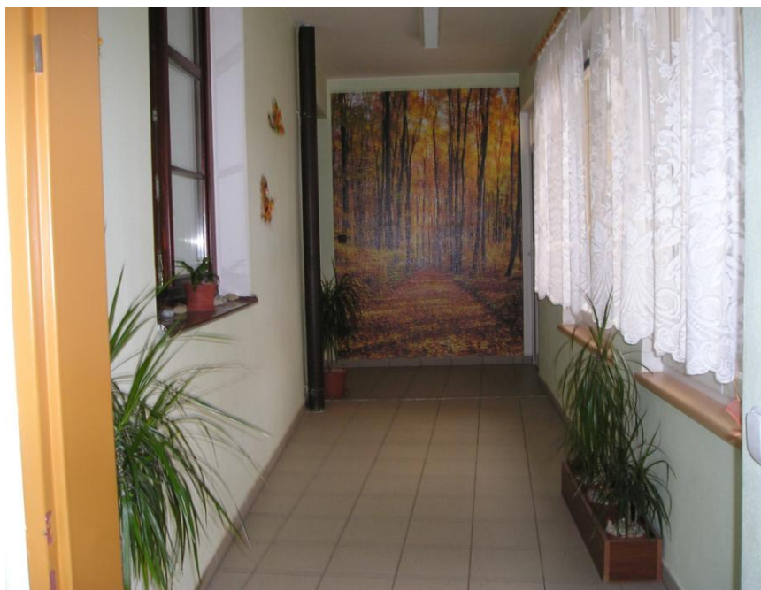
Průchod z budovy č. 3 na budovu č. 2