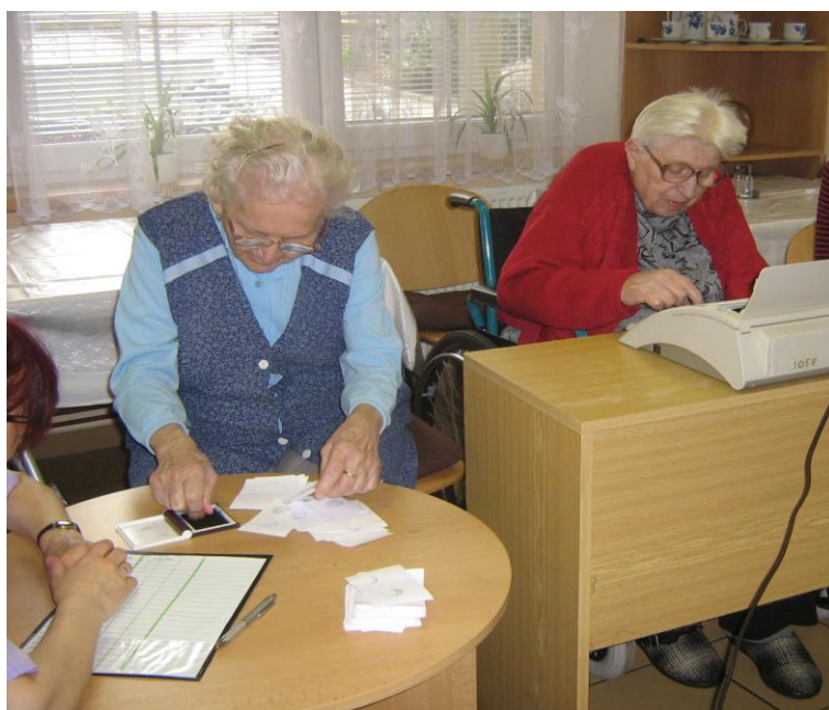
Kancelářský víceboj – psaní na psacím stroji