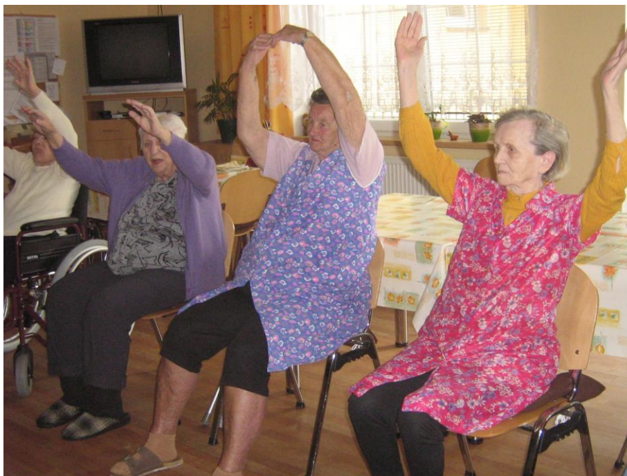
Tanečky pro seniory – cvičení vsedě na židlích při hudbě, klientka A první zprava