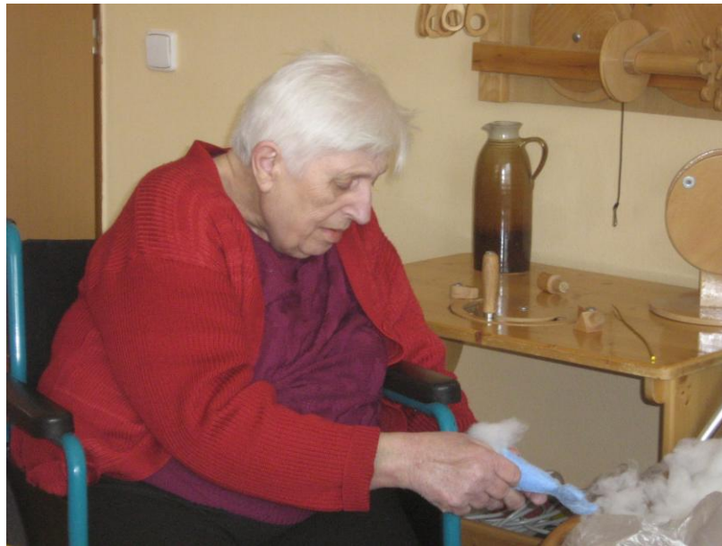
Kroužek ručních prací – vycpávání froté zvířátek