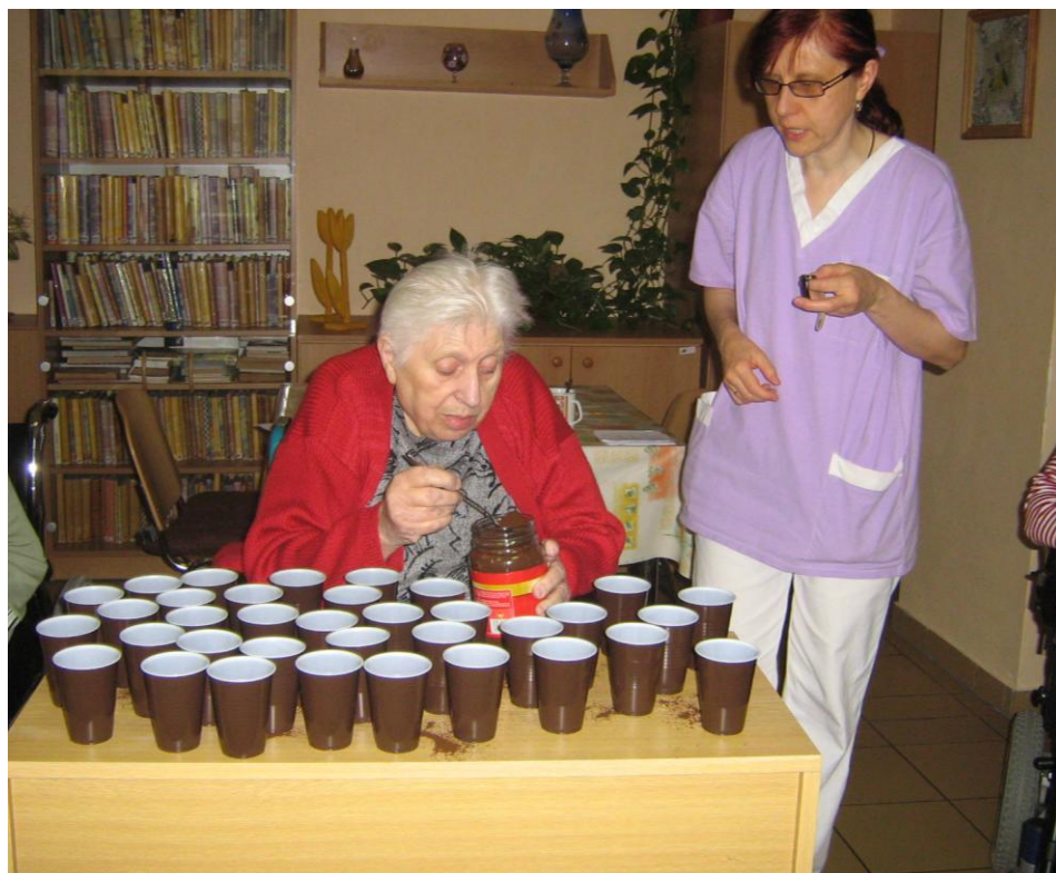
Kancelářský víceboj – vaření kávy