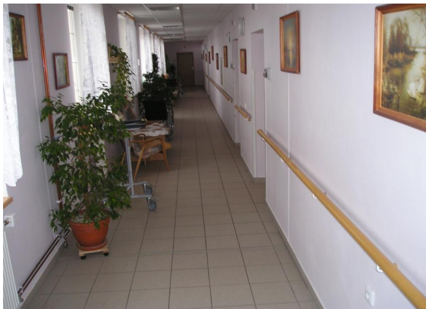
Chodba v budově č. 3