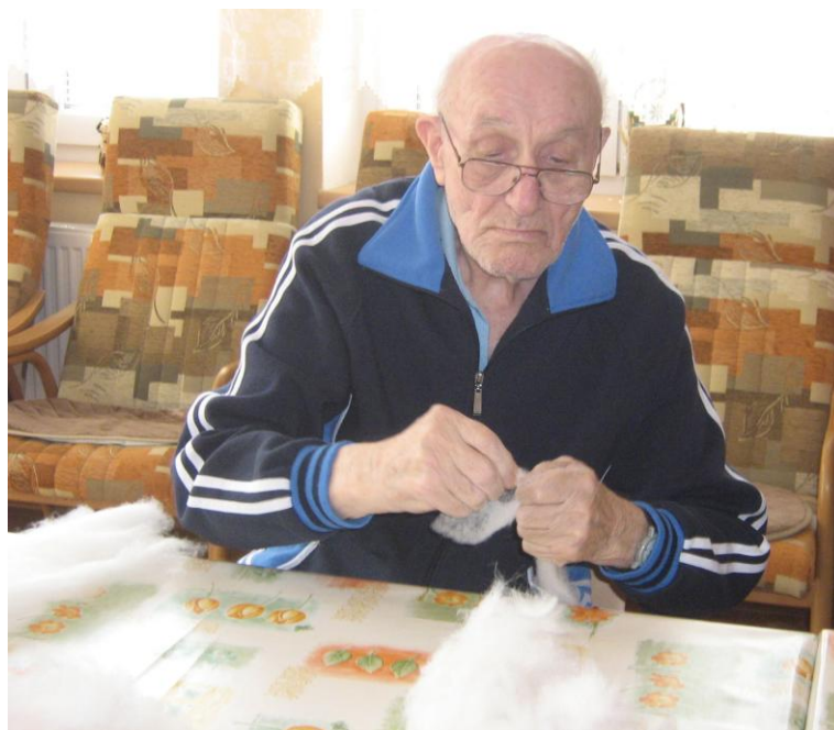
Kroužek ručních prací – trhání vatelínu do polštářků