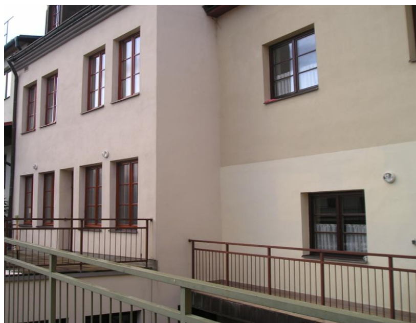
Pohled ze dvora na budovu č. 1