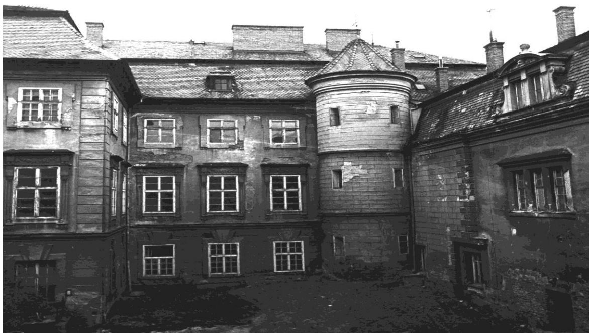
Obrázek č. 1 Nádvoří zámku před rekonstrukcí

V průběhu let 1997–2005 investovalo město za pomoci státních dotací do zámku a jeho menších oprav téměř 25 mil. Kč. Tato částka byla v jistém smyslu vypovídající. Pro městský rozpočet znamenala hodně, avšak pro zámek a jeho celkovou rekonstrukci velmi málo. Generální oprava zámku si možná podle tehdy střízlivých odhadů vyžádá nejméně desetinásobnou částku, zhruba 150 mil. Kč. To znamená, že další budoucnost zámku a závisí na financích, které se postupně daří získávat z fondu na záchranu architektonických památek. Tímto programem je podporována obnova kulturních památek tvořících nejcennější součást našeho architektonického dědictví, jako jsou hrady, zámky, kláštery, historické zahrady, kostely a podobně. Tyto finance však není možné použít dle vlastní libosti, jejich využití podléhá přísným účelovým kritériím.