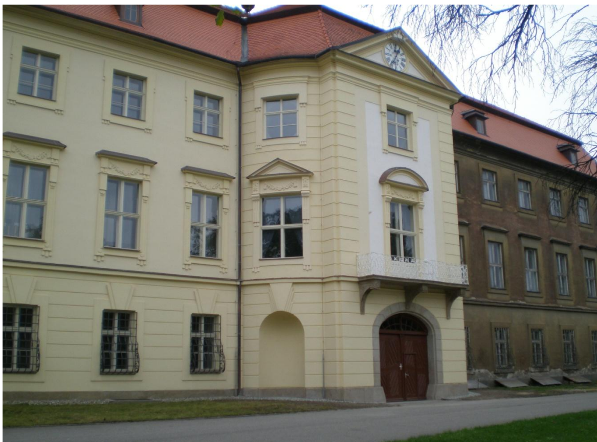
Obrázek č. 2 Severní fasáda zámku v průběhu rekonstrukce

Práce byly provedeny ve velmi dobré kvalitě a tím byla dokončena poslední část oprav zámecké střechy. Zámek je postupně opravován podle finančních možností města a za pomoci dotací ze státního rozpočtu Ministerstva kultury ČR v rámci záchrany architektonického dědictví a také dotací od krajského úřadu. V roce 2007 se zároveň zpracovávala projektová dokumentace pro rekonstrukci vnitřní části zámku, ale i pro přilehlé pozemky a zámecký příkop.