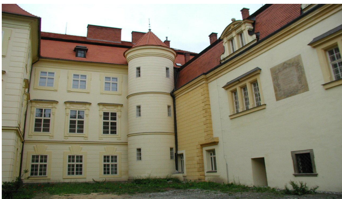
Obrázek č. 3 Nádvoří zámku po rekonstrukci

Za úvahu by jistě stály Pilotní projekty Public Private Partnership. PPP představuje spolupráci veřejného a soukromého sektoru při přípravě, výstavbě, provozování investic ve veřejném zájmu a při poskytování některých veřejných služeb. Tento postup je aplikován především z důvodů časově omezených finančních možností veřejného sektoru. Jde o to, že soukromý investor investuje ze soukromých zdrojů do rozvoje prostředků veřejné služby a případně ve své režii tyto prostředky následně spravuje a provozuje. Po skončení domluveného kontraktu převede vlastnictví na veřejný sektor. Metoda PPP se používá v mnoha odvětvích. Kultura projekty tohoto typu zatím ale nevyužívá. Přitom jde o nástroj, který by v tomto oboru mohl mimo jiné umožnit transfer přínosů a zkušeností pro další navazující obory, zejména služby. Potenciál PPP projektů v kultuře bude teprve testován a následné zkušenosti budou využity pro další obdobné případy.