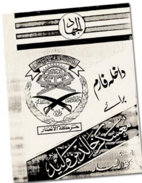
Obr. 10 - Manuál teroristů

Terorismus je pojem starý, zatímco válka radikálního islamismu, její metody a cíle jsou docela nové. Stačí se podívat do slovníku koránu: tam lze narazit na staré pojmy jako džihád (svatá válka proti agresorovi), mudžáhid (bojovník svaté války), šahíd (mučedník svaté války), fidái (bojovník na cestě Alláha), ale výrazy jako irháb (teror) či istišhád (sebevražedný akt obětování se) jsou moderní.