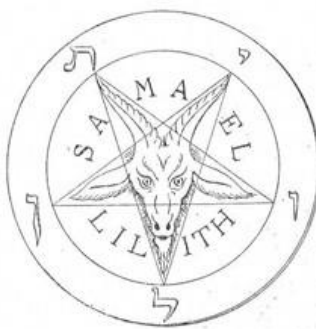
Obr. 4 - Pentagram

V České republice (tehdy Československu) byla založena První Církev Satanova 1. 10. 1991 Jiřím Valterem v Brně. Valter jako jediný velekněz v Evropě může provádět satanský křest. Zájemcům o členství v sektě zašle dotazník s 32 otázkami a na základě odpovědí rozhodne, zda bude uchazeč přijat. V dnešní době má asi 200 členů. Ročně jich Valter přijme kolem dvaceti. Mezinárodní počet členů se díky roztržitosti sekty nedá odhadnout.