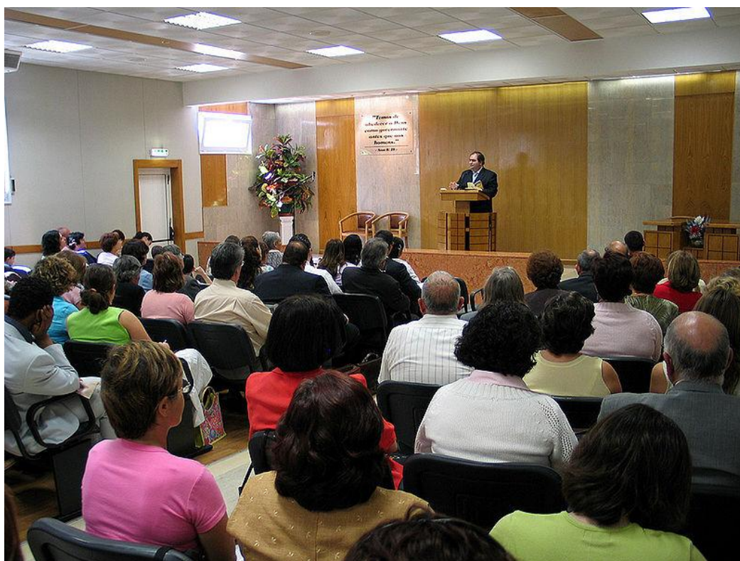
Obr. 6 - Shromáždění Svědků Jehovových

S vyloučeným členem se ostatní svědci nemohou stýkat. Tento faktor je velmi silným prvkem manipulace, protože v případě vyloučení má zavržená osoba silný pocit ztráty sociálního zázemí, případně trpí vyhoštěním z rodinného kruhu, pokud zbylí členové rodiny v sektě zůstali, což může mít těžké následky na její psychiku – někteří uvádějí, že jejich psychický stav byl stejný, jako kdyby jim umřela nejbližší osoba. Hrozící pocit „vykořeněnosti“ je důvodem, proč si většina členů odchod ze sekty raději dvakrát rozmyslí. [22]