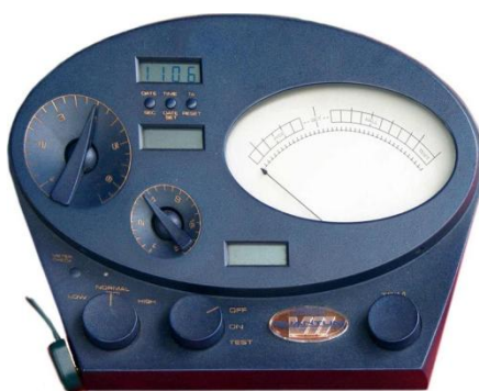
Obr. 5 - E-meter

Mysl, která ukládá a zaznamenává situace v životě, zaznamenává i bolestivé a nepříjemné okamžiky, nazývané Engramy. K jejich lokalizování a konzultování za účelem přinesení úlevy se používá zařízení zvané elektrometr, zkráceně e-metr. Člověk, který již není ovlivňován těmito bolestivými zážitky a má informace z nich opět v analytické (vědomé) myslí dosahuje stavu clear – čistý – pomocí „auditingu“, dotazovacích technik za pomoci zmíněného elektronického měřicího přístroje. [9]