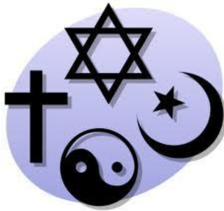
Obr. 2 - Náboženské symboly