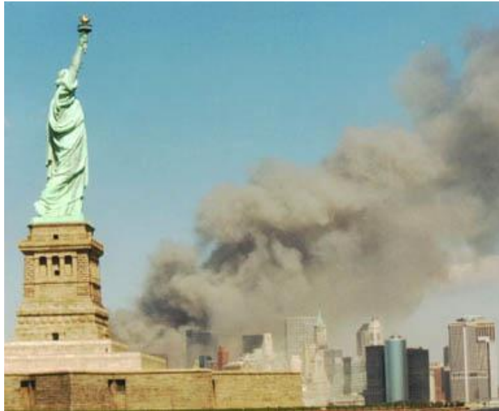
Obr. 1 - 11.zář 2001 -teroristický útok na USA