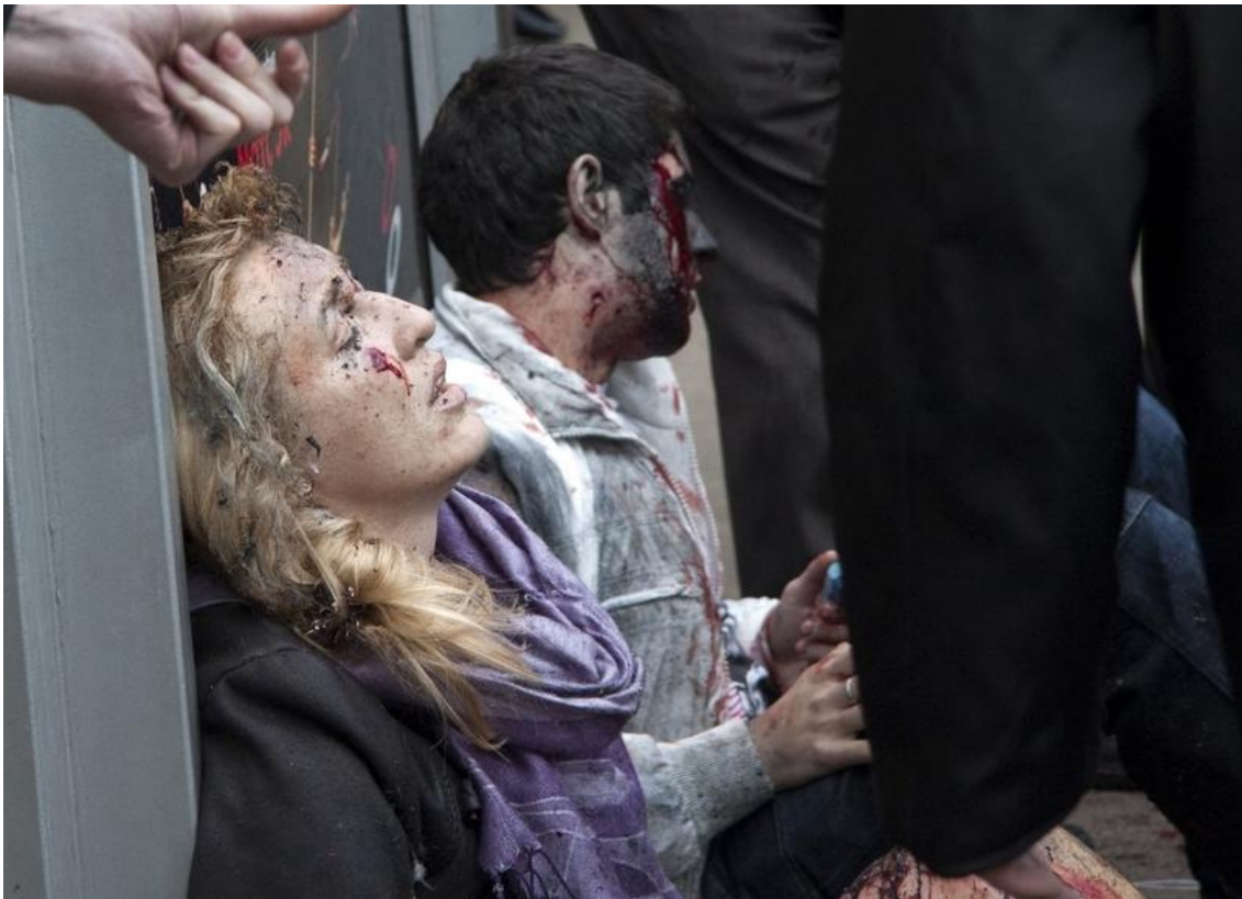
Obr. 9 - Ruské metro, krátce po útoku sebevražedných atentátnic

Letadlo letělo na Washington, D.C. a spekuluje se, že mělo za cíl zasáhnout Bílý dům. Zahynulo 2 993 lidí včetně únosců. 7. července 2005 - V ranní špičce explodovaly v Londýně krátce po sobě tři bomby v metru a čtvrtá asi o hodinu později v autobuse; zahynulo 56 lidí včetně čtyř atentátníků, na 700 lidí bylo zraněno. K útokům se přihlásili islamisté napojení na Al-Káidu. 29. března 2010 - Útok dvou sebevražedných atentátnic, které v ranní špičce na dvou zastávkách odpálily tříkilogramové plastické trhavyiny umístěné na vlastních tělech v moskevském metru. Nejméně 34 lidí přišlo o život a dalších asi 30 bylo zraněno.