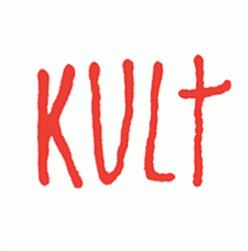
Obr. 3 - Kult

V tradičním pojetí tohoto slova stojí kult zcela mimo náboženství, jeho mýty, teologii, nebo i osobní víru. Jedná se o pojem, který vyjadřuje určitou náboženskou praxi jako celek. Zachování této praxe vůbec nic neznamena, je považováno ze standard, ale z jejího nezachování plyne stav, který z hlediska dané víry vede k bezbožnosti.