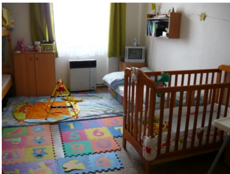
Obrázek 1.4 Ukázka pokoje azylového domu ROSA s utajenou adresou s vybavením pro dítě

Další možností je využití intervenčních center. V případě intervenčního centra hovoříme o specializovaném zařízení sociální služby, které poskytuje pomoc sociální, psy-