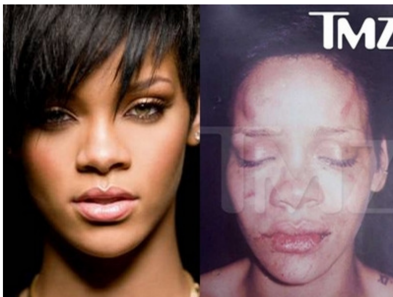
Obrázek 1.1 Následek mediálně známého fyzického domácího násilí

Do této formy patří veškeré fyzické projevy agresivity jako bití, kopání, škracení, facky, pálení různými předměty (cigaretou, zapalovačem apod.), vystavování jiným teplotám (např. na mráz), ohrožování zbraní aj. Ohrožování zbraní může být namířeno i proti jiným osobám nebo zvířeti.