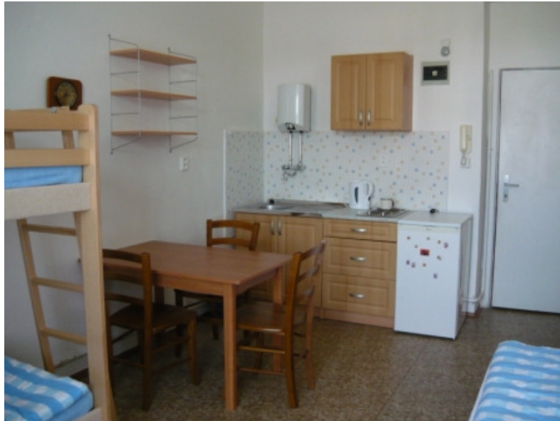
Obrázek 1.3 Ukázka pokoje azylového domu ROSA s utajenou adresou

s ostatními. V České republice existuje na cca 120 azylových domů, z nichž většina je určena na pomoc týraným ženám a jejich dětem. Problémem je, že zhruba jedenáct set míst je neustále obsazených, takže se často musí čekat.