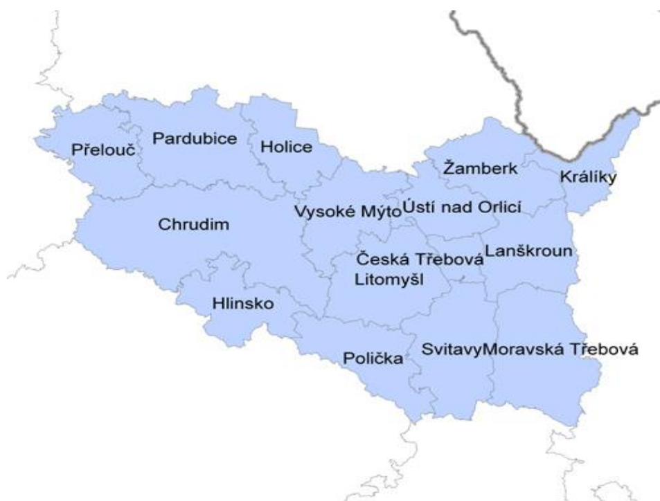
Obrázek 1 Obce s rozšířenou působností v Pardubickém kraji [10]

Moravská Třebová, Svitavy i Litomyšl jsou města s rozšířenou působností, což znamená, že na sebe přebraly část kompetencí bývalého okresního úřadu. Do jejich správních obvodů jsou přiřazeny obce základního typu a obce s pověřeným úřadem.