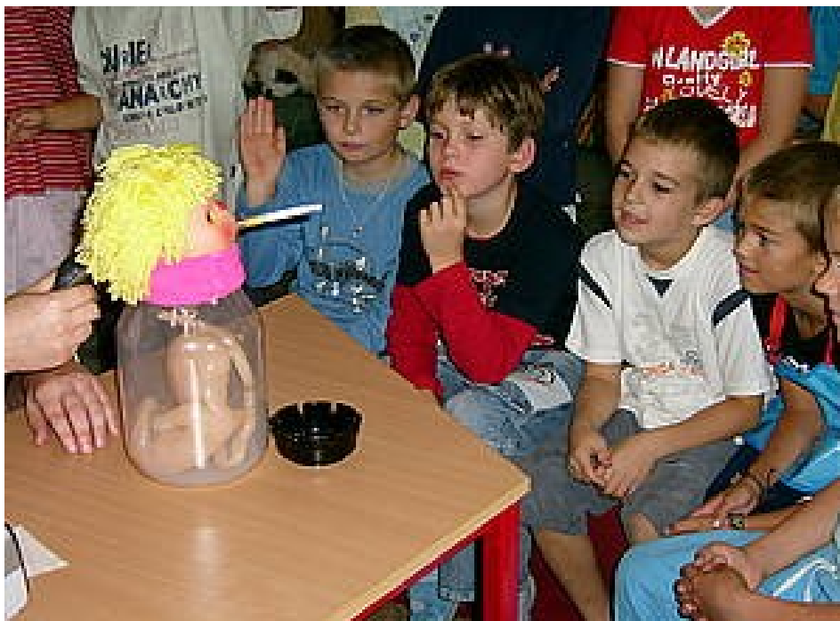
Obrázek č. 5 Praktická ukázka z programu „Z hlouposti do závislosti“. 137

Na obrázku je zobrazen brněnský „vynález“, na kterém je názorně demonstrován škodlivý účinek kouření. Kouř ze zapálené cigarety je pomocí balónku opakovaně vtažen na principu vývěvy do láhve, která je vzduchotěsně utěsněna tak, aby se do ní nasál pouze vzduch s cigaretovým kouřem. Vzduch s cigaretovým kouřem prochází do láhve přes čistě bílý filtrační papír. Po „vykouření“ celé cigarety jsou na původně čistě bílém filtračním papíru patrné šedé stopy po mikroskopických částicích obsažených v cigaretovém kouři.