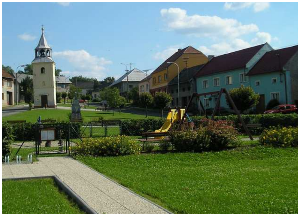
Obr. 1 Náves obce Žákovice s dětským hřištěm