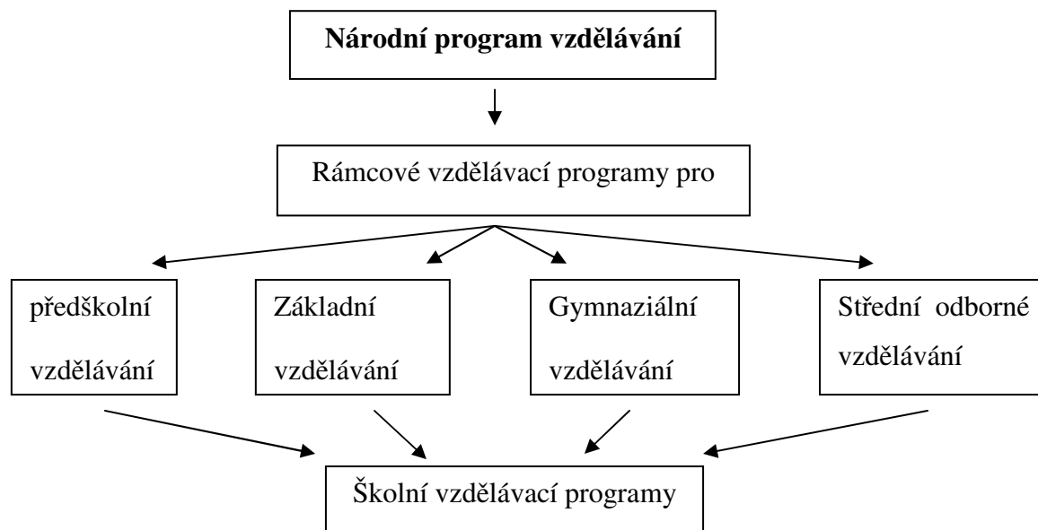
Obrázek 2: Přehled kurikulárních dokumentů v České republice (Maňák, Janík, Švec, 2008, s.34)

V roce 1989 u nás vznikla společnost STaN-ECHA (Společnost pro talent a nadání), která spadá pod celoevropskou organizaci ECHA. Společnost pravidelně organizuje odborné semináře a přednášky a pořádá setkání Klubu rodičů nadaných dětí. Zde si rodiče navzájem vyměňují své zkušenosti a rady týkající se jejich dětí. Další organizací působící na území ČR, je Centrum nadání , v jehož čele stojí Václav Fořtík, autor řady publikací o nadaných dětech. Centrum realizuje vzdělávání a poradenství, týkající se problematiky nadaných dětí. Významná je také Mensa ČR , která spadá pod celoevropskou Mensu. Ta organizuje různé zábavně - vzdělávací akce pro nadané děti. Všechny výše uvedené organizace mají své sídlo v Praze (Machů, 2010).