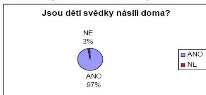
Graf 9 . : Děti, svědci domácího násilí, 2008