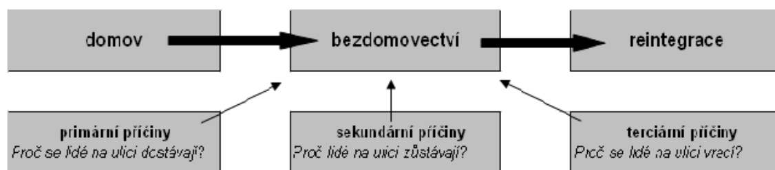
Obr. 2 Příčiny bezdomovectví

Proč se lidé na ulici vrací? - otázka sociální práce