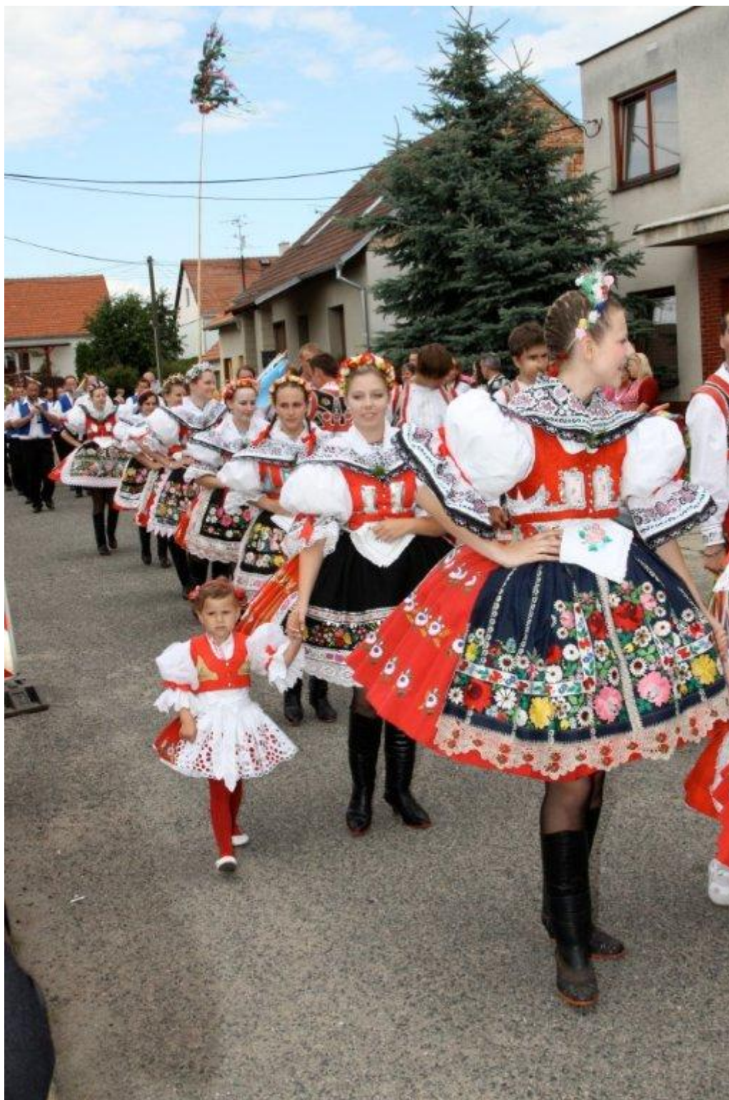
Obrázek č. 1 Hodový průvod v Březi