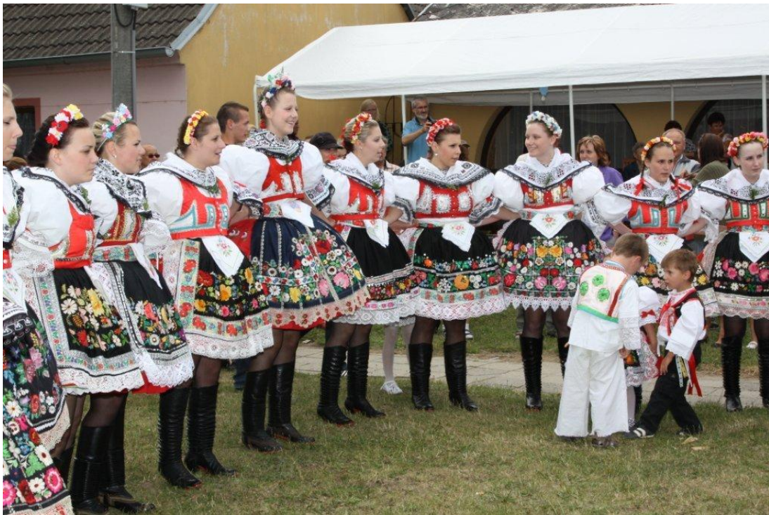
Obrázek č. 3 Upravený dětský kyjovský kroj