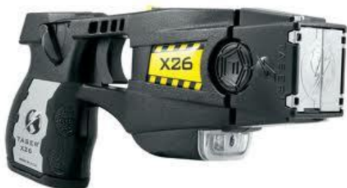
Obr. 2.10 Taser X26 [17]