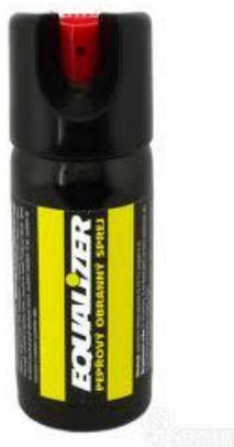
Obr. 2.14 Sprej – tekutá střela [18]