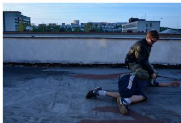
Nasazení páky na loket