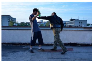
Agent vrací odstrčení