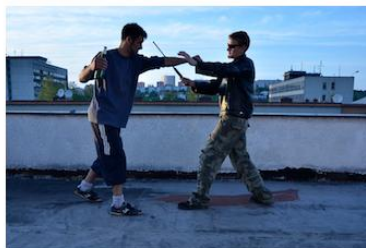
Přímý úder na bradu