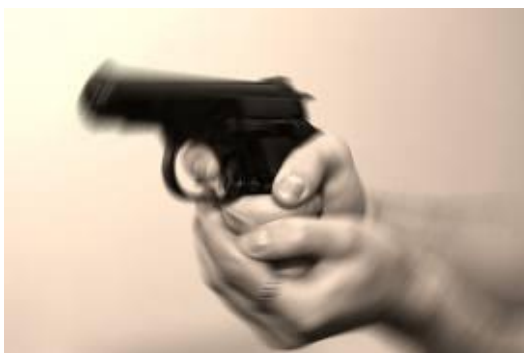
Obr. 3.1 Držení zbraně [2]

Po úspěšném zvládnutí střeleckého postoje si musí pracovník osvojit základní manipulaci se zbraní. Správné držení zbraně ovlivňuje přesnost a rychlost při střelbě. Nejvhodnější je držení zbraně oběma rukama, které zaručuje výbornou kontrolu nad zbraní. Při míření je důležitá práce svalstva rukou, očí a nohou.