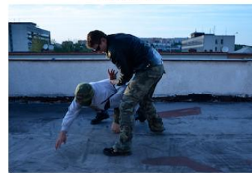
Donucení útočníka lehnout