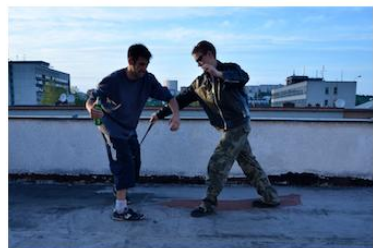
Úder na levé koleno