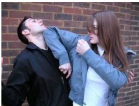
Obr. 2.19 Úder [21]

Úder patří k nejrychlejším a nejefektivnějším základním prvkům sebeobrany. Cílem úderu je ochromit útočníka, popřípadě zastavit jeho útok.