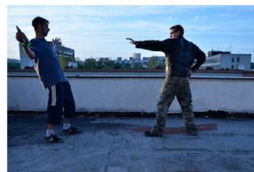
Narušení stability opilce