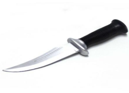
Obr. 2.8 Nůž [14]

Mezi bodné chladné zbraně řadíme především nože. Jedná se o jednoduché bodné zbraně složené ze dvou částí – čepele a rukojeti. Tato zbraň je využívána jen velmi zřídka. Je určena výhradně pro boj zblízka a při neopatrném zacházení přináší příliš velké riziko zranění. I přes to, že využití je opravdu malé, je nůž nezbytnou součástí výbavy pracovníků bezpečnostních agentur.