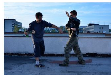
Vykrytí úderu teleskopickým obuškem