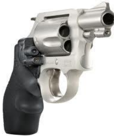
Obr. 2.2 Revolver [11]

Charakteristickým prvek revolveru je válec s komorami pro náboje. Válec se otáčí kolem své osy. Otáčení je založené na mechanickém principu a zdrojem energie je síla střelce. Po vystřelení nábojů zůstávají ve válci prázdné nábojnice, které je třeba odstranit.