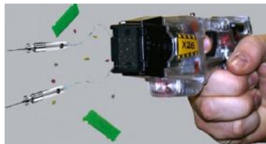
Obr. 2.11 Výstřel z taseru [17]