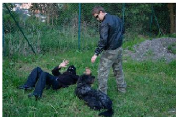
Povely: "Dost! Lehni!"