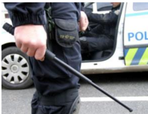
Obr. 2.5 Teleskopický obušek [15]

že se do sebe zaseknou kuželové plochy na koncích trubek. Složení se provádí úderem špičky obušku kolmo k tvrdému povrchu. Je mnohem účinnější než klasický obušek – i pouhý zásah do ruky vyvolá zpravidla dostatečnou odezvu a není již potřeba používat dalšího násilí. Teleskopický obušek je vhodný nejen pro efektivní údery a kryty, ale také pro účinné fixace, páky a úchopy. Samotný typický kovový zvuk při vysunutí mívá odstrašující efekt. [7]