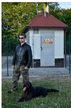
Agent se psem