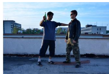
Pokus o odstrčení agenta