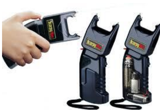
Obr. 2.9 Elektrický paralyzér [17]

Elektrický paralyzér je malý prostředek, který ochromí útočnicka pomocí elektrického šoku. Jedná se v podstatě o kapesní transformátor, který přeměňuje napětí vnitřního zdroje (9V baterie) na výboje o síle několik set tisíc voltů. Útočník při krátkém kontaktu (menším než 1s) s napětím dostane elektrický šok, který ho na krátkou dobu ochromí. Při kontaktu delším než 1s není útočník schopný pohybu a může dostat svalovou křeč. Elektrody se musí dostat do kontaktu s tělem útočnicka, proto je účinek paralyzéro závislý na momentu překvapení. Důležité je také místo zásahu – ramena, klouby, stehna jsou považovány za místa s největší pravděpodobností účinnosti zásahu.