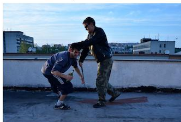
Přiblížení k agresorovi