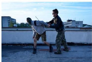
Nasazení páky na zápěstí a rameno