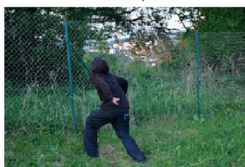
Pokus lupiče o útěk