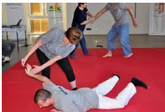
Obr. 2.18 Ukázka chvatu [21]

Chvat je oproti hmatu složitější technický prvek, jehož cílem je dostat útočníka do takové polohy, ze které se nemůže dostat a tím pádem prohrává. Cílem chvatu je blokovat protivníka, ne mu působit bolest. Jedná se většinou o kombinaci různých technik – páčení, úderové a dorazové techniky.