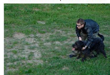
Výzva s varováním puštění psa