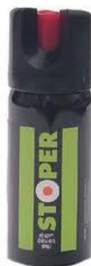
Obr. 2.15 Sprej – pěna [18]

Pěnový sprej vypouští do prostoru užší proud tryskající pěny. Zasažením lze útočnickovi způsobit dráždivý kašel, dušnost, dočasné oslepnutí nebo silné pálení kůže. Při použití tohoto typu spreje nehrozí samotnému uživateli nadýchání, proto je vhodný i do stísněných prostorů (výtahy, malé místnosti, dopravní prostředky). Dosah obranné látky je přibližně 2m. [18]