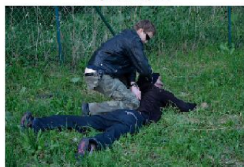
Odhalení tváře pachatele