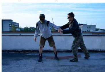
Chycení za zápěstí