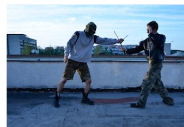
Silný úder na zápěstí