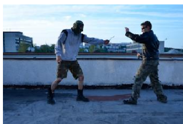
Útok nožem na agenta

V dalším případě je zachycen útočník s nožem, který napadá pracovníka soukromé bezpečnostní agentury. Ten okamžitě pomocí teleskopického obušku reaguje a útok odvrací s okamžitým a důkladným zadržením. Opět detailněji pozorovatelné na přiložených fotografiích.