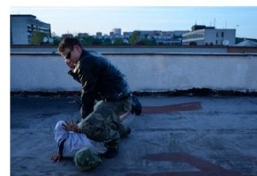
Přivolání Policie ČR