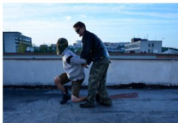
Stlačení útočníka na koleno