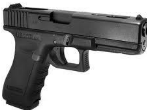
Obr. 2.3 Pistole [12]

Pistole se od revolveru liší tím, že nemá náboje umístěné ve válci, ale ve schránkovém zásobníku, ze kterého jsou postupně podávány do nábojové komory. Střelec při střelbě jen míří a tiskne spoušť. Po každém výstřelu je vystřelená nábojnice vyhozena z pistole ven a po vystřelení všech nábojů zůstává zásobník i nábojová komora prázdná (závěr zůstane zachycen v zadní poloze).