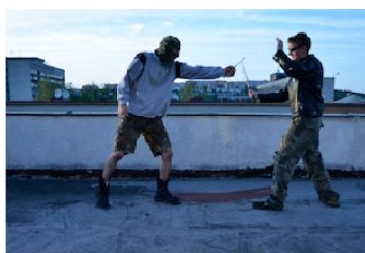
Vysunutí teleskopického obušku