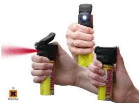
Obr. 2.12 Použití obranného spreje [18]

Obranné spreje patří k nejrozšířenějším obranným prostředkům nejen v bezpečnostních agenturách, ale slouží i pro ochranu samotných občanů. Jejich nespornou výhodou je nízká cena, jednoduché použití a přijatelná hmotnost.