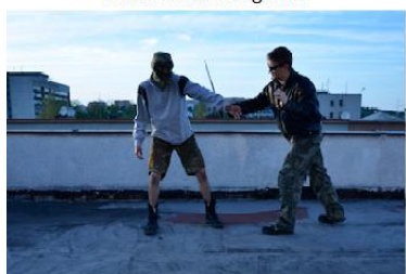
Vyrazení nože, pokus útočníka o útek