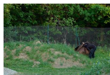
Zkoumání možného předmětu krádeže