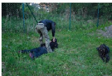
Komunikace ohledně zbraní