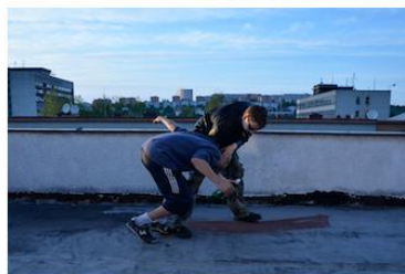
Trhnutí agresorem k zemi