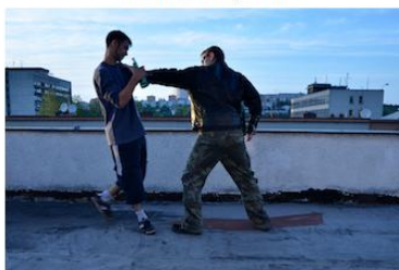
Agent přenáší váhu