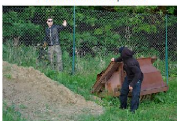
Výzva k zastavení