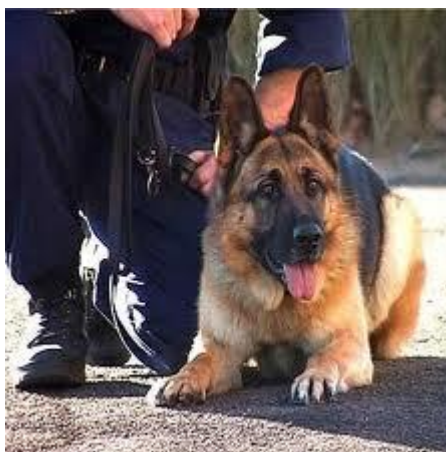
Obr. 4.1 Služební pes [22]

g) Vyhledávání výbušnin – náplní práce je kontrola objektů a podnět anonymního uložení takového předmětu. Nálezu se pes nesmí dotknout a nesmí štěkat (možnost způsobení výbuchu akustickým podnětem). [9]