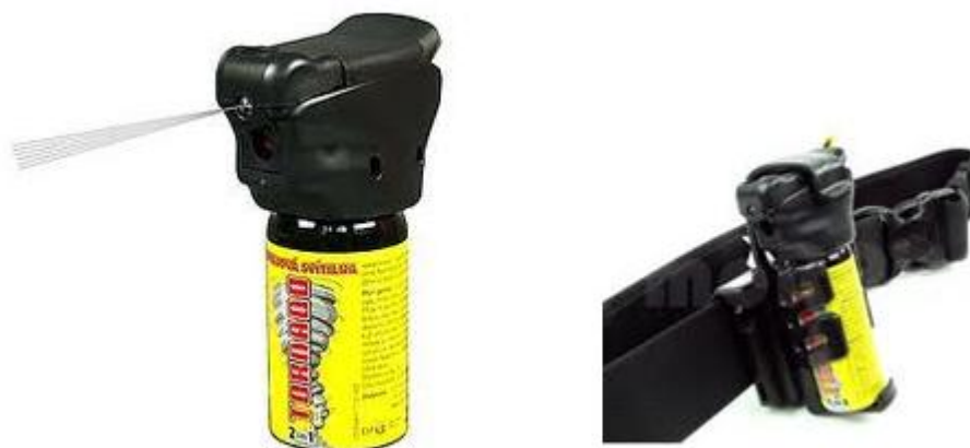
Obr. 2.16 Obranný sprej a jeho upevnění na opasek [19]