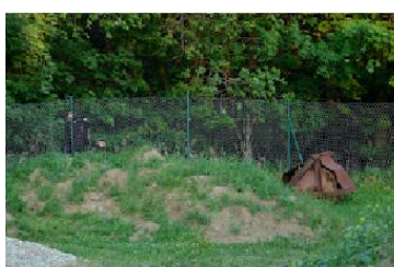
Podezřelá osoba za plotem