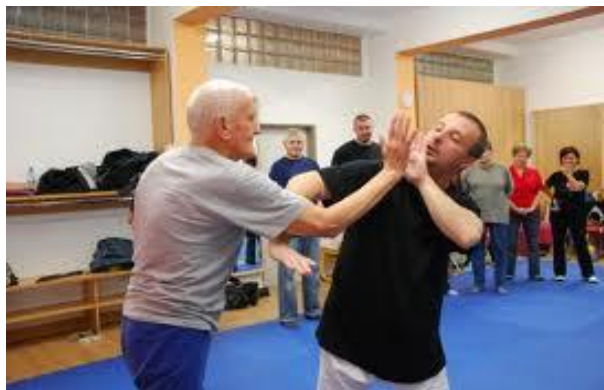
Obr. 2.17 Ukázka praktického hmatu [21]

Hmat je považován za nejjednodušší technický prvek v sebeobraně. Jedná se o útočný nebo blokující prvek, jehož cílem je účelově působit bolest. „ Hmat lze charakterizovat jako bolestivé působení na vitální místo lidského těla, obvykle stiskem nebo tlakem prstů, jehož cílem je utlumit nebo zcela zastavit pohybovou aktivitu soupeře. “ [2]