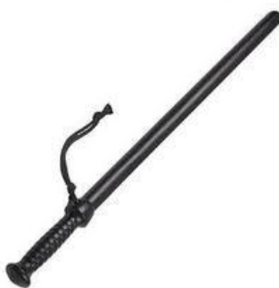
Obr. 2.4 Klasický obušek [14]

Jedná se o klasickou, jednoduchou ruční zbraň určenou pro boj zblízka. Je vyroben z vysoce pevného materiálu – polypropylenu. Je nejčastěji používanou zbraní pracovníků bezpečnostních agentur. Cílem není způsobit zranění, ale bolest. Vhodným místem k úderu obuškem jsou záda, hýždě, stehna a paže. Nesmí se používat údery do hlavy, krku, ledvin, břicha a podobně. V současné době ale není moc používán.