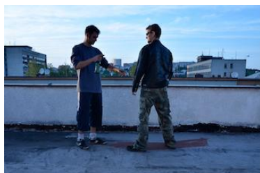
Střetnutí - výzva k opuštění místa