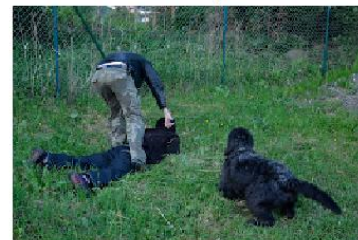
Nasazení páky na loket