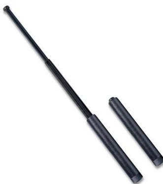
Obr. 2.6 Teleskopický obušek složený a rozložený [15]

Ve složeném stavu je poměrně nenápadný a umožňuje pohodlné skryté nošení.