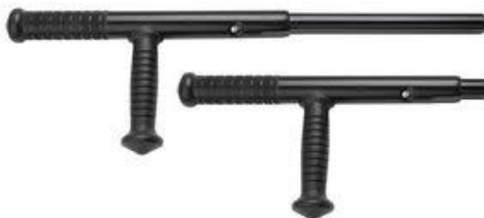
Obr. 2.7 Tonfa [16]

uchopení, příčná rukojeť zaručuje vhodné držení a otáčení tonfy. Spodní strana tonfy je zploštělá, takže při obraně přiléhá pevněji k ruce a máme jistotu, že nám nesklouzne. Dnes už se vyrábí tonfy i v teleskopickém provedení, takže patří mezi často využívané zbraně pracovníků bezpečnostních agentur.[8]