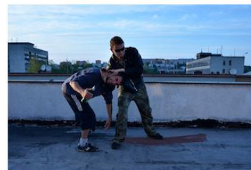
Chycení do sevření za krk