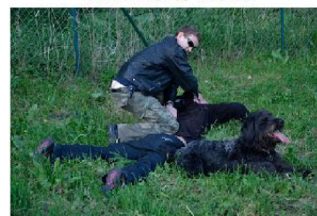
Pochvala psa - piškot