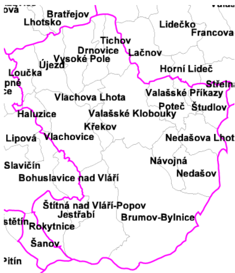
Obrázek 1 ORP Valašské Klobouky

Správní obvod obce s rozšířenou působností Valašské Klobouky je vymezen územím obcí Brumov-Bylnice, Drnovice, Haluzice, Jestřabí, Křekov, Loučka, Návojná, Nedašov, Nedašova Lhota, Poteč, Rokytnice, Štítná nad Vláří-Popov, Študlov, Tichov, Újezd, Valašské Klobouky, Valašské Příkazy, Vlachova Lhota, Vlachovice a Vysoké Pole – viz mapka níže. (Města a obce online, 2012)