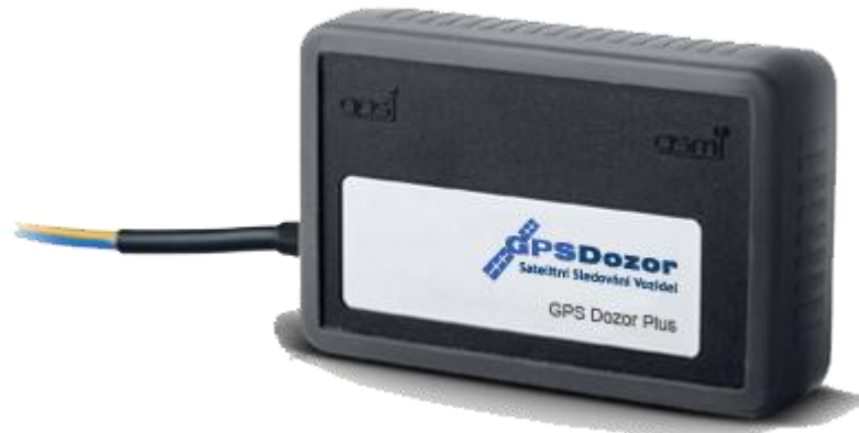
Obrázek 6: GPS lokátor.

Přehled vybraných funkcí http://www.lokatory.cz/prehled-vsech-funkci-systemu :