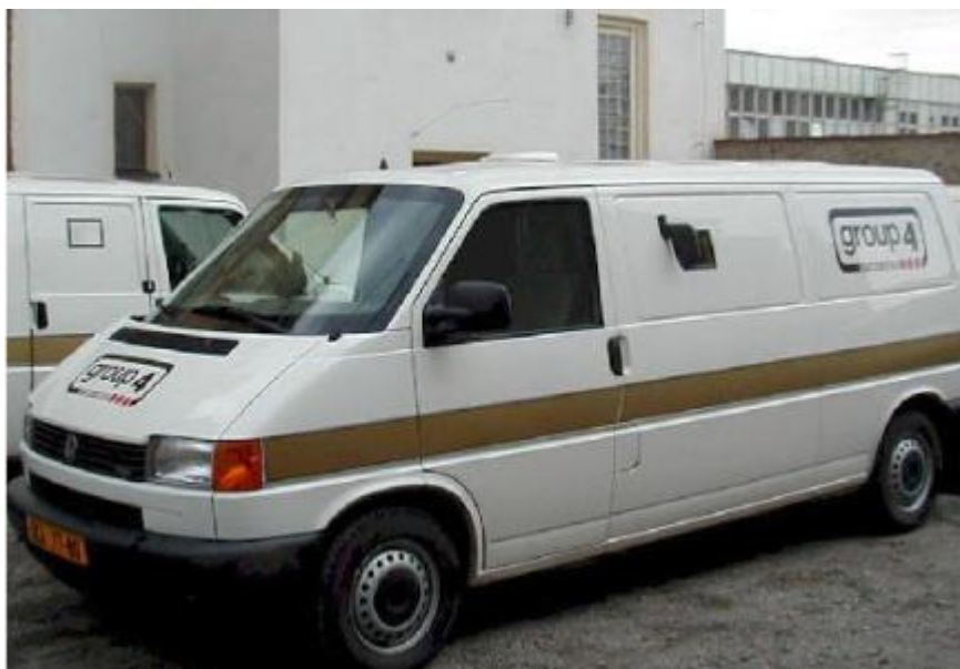
Obrázek 9: Typ vozidla určeného pro převozy

Agentura převáží hotovost v pancéřovaném voze, sledovaném pomocí systému GPS, informace jsou přenášeny pomocí datové nadstavby systému GSM. Osádka vozidla jsou řidič a dva pracovníci. Řidič vždy čeká u vozidla a v případně naložené hotovosti střeží hotovost ve vozidle. Dva pracovníci agentury vyzvedávají hotovost a ukládají ji do vozidla. Hotovost je přenášena v bezpečnostním kufru, který je připevněný k ruce pracovníka. Pro tuto přepravu není používána ochrana pomocí barvicích kapslí. Všichni tři pracovníci jsou vyzbrojeni pepřovým sprejem, krátkou střelnou zbraní. Ve vozidle je uložena brokovnice.