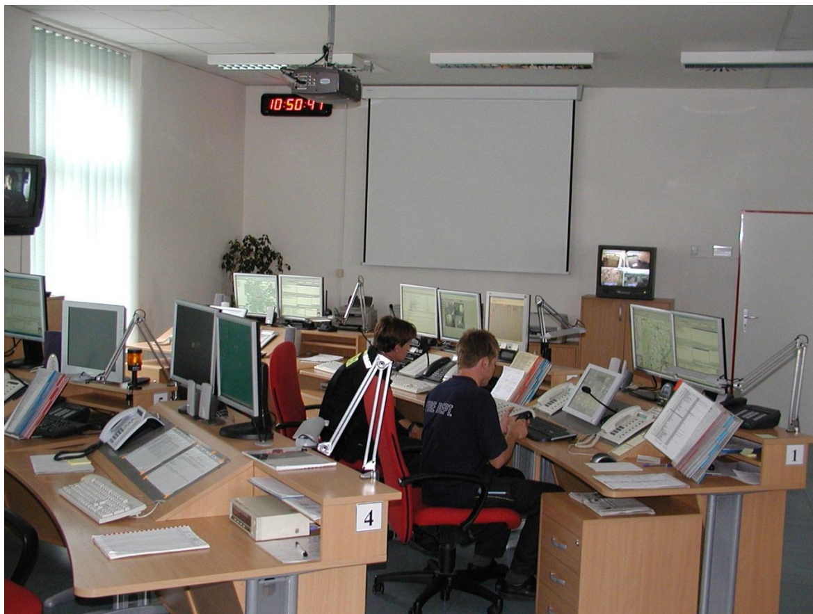
Obrázek 1: Příklad dohledového a poplachového přijímacího centra