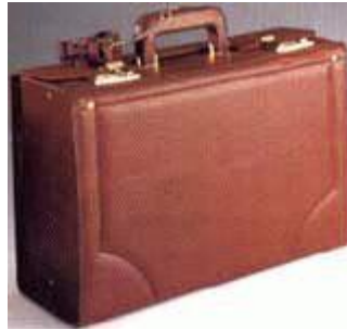
Obrázek 10: Použitý kufr