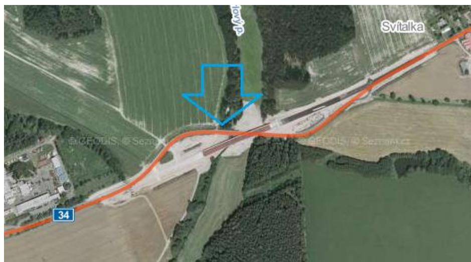
Obrázek 12: Místo útoku na vozidlo SBS

Útočníci využijí prací na silnici č. 34 u obce Svitálka, okres Havlíčkův Brod, kde je přechodnou úpravou silničního provozu snížena rychlost vozidel na 30 km/h a vedena provizorní objízdná trasa po nezpevněné komunikaci.