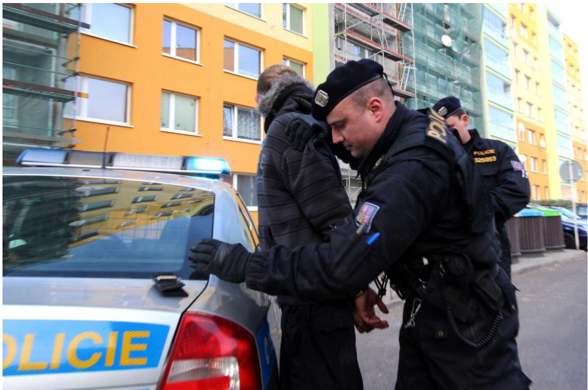
Obrázek 5: Využití oprávnění zajištění dle §26 v praxi.

V praxi nejčastěji užívané odstavce a) a f) jsou základním nástrojem omezení osoby Policií ČR. Při spáchání konkrétního trestného činu v případě, kdy jsou splněny podmínky vazby, zakročující policista může přikročit k užití §76, odstavec 1, z.č. 141/1961 Sb. a osobu zadržet.