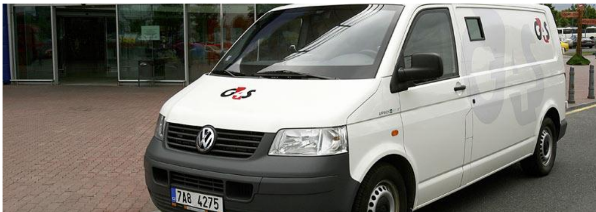
Obrázek 4: Vozidlo pro přepravu peněz a cenností