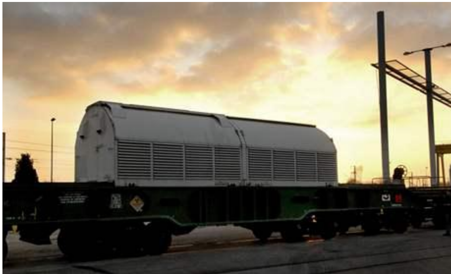
Obrázek 2: Speciální nádoba pro převoz obohaceného uranu.

Do této kategorie se řadí jak přeprava paliva do jaderných elektráren tak vyhořelého paliva do meziskladů vyhořelého paliva.