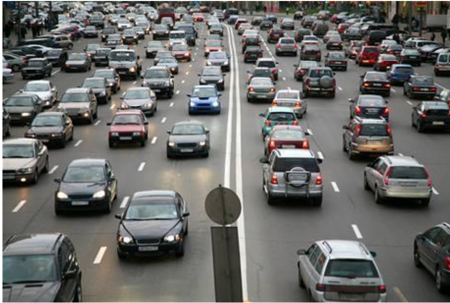
Obrázek 8: Ukázka Low profile v praxi