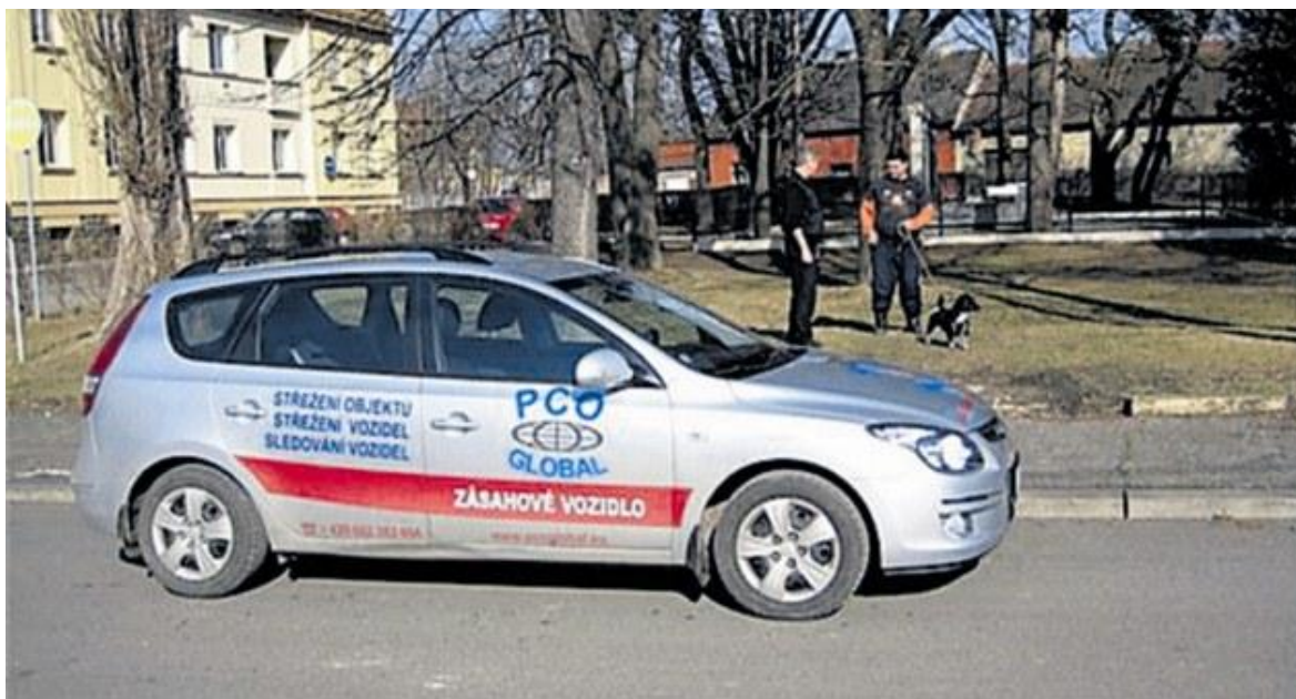
Obrázek 3: Osobní vozidlo k přepravě hlídky.

Soukromé bezpečnostní služby užívají dopravní prostředky dle účelu jejich nasazení. K přepravě osob užívají zejména osobní vozidla upravená pro služební potřebu přidáním komunikačního zařízení, polohovým monitorovacím zařízením, případně přístupovým zařízením (ochrana proti nepovolenému užívání).