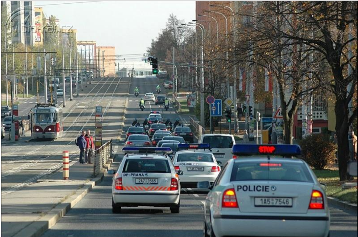
Obrázek 7: Ukázka High profile v praxi