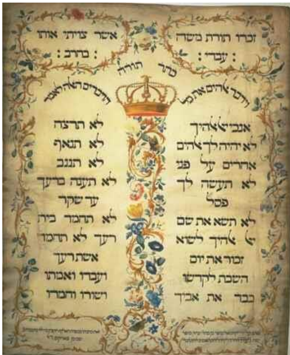
Pergamen (612x502 mm) z r. 1768 od Jekuti'ela Sofera zpodobňující Desatero z r. 1675 v amsterdamské synagoze Esnoga