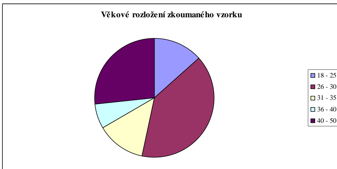
Graf č. 1 Věkové rozmezí zkoumaného vzorku

Většina z nich je vyučená (66.6. %), některé z nich mají základní vzdělání (13.3%) či středoškolské (20 %).