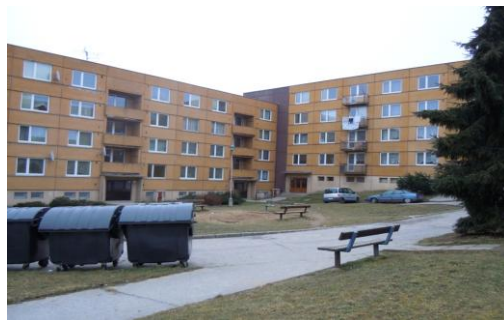
Obr. 6. Lokalita B – Horní Kosov