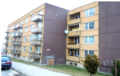
Obr. 5. Lokalita B – Horní Kosov