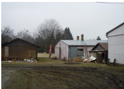
Obr. 3. Lokalita A – Havaj

Tato lokalita již od 90. let funguje jako „domov“ pro vystěhované neplatiče a rodiny s dětmi ve špatné bytové situaci. Jde o tzv. městské holobyty. Můžeme ji nalézt na periferii města, tvoří ji unimobuňky a cihlové domy v několika řadách. Pozemky jsou oplocené. Do domů a unimobuněk zatéká voda, která v zimním období mnohdy i zamrzne. Odhadem v lokalitě žije 60 obyvatel, většinou rodin s nezletilými dětmi. Pouze několik osob pracuje, jiní pracují „na černo“, avšak většina je závislá na sociálních dávkách. Vyskytují se zde problémy s alkoholem, drogami a drobnými krádežemi, ke kterým dochází zejména v nedalekém obchodním domě. Většina nezletilých dětí z této lokality navštěvuje Základní školu praktickou, jen málo z nich zvládne „klasickou“ ZŠ.