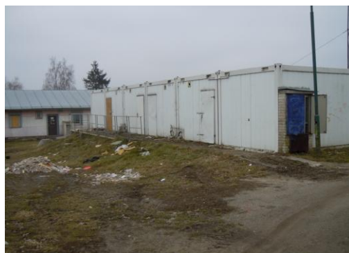
Obr. 4. Lokalita A – Havaj