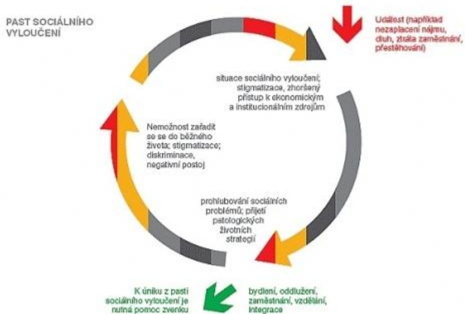
Obr. 1. Past sociálního vyloučení