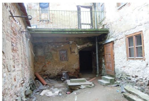
Obr. 8. Lokalita C – část centra města