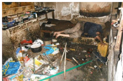
Obr. 10. Klient, který žil v chatce