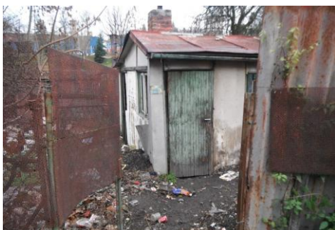
Obr. 9. Chatka v sociálně vyloučené lokalitě

Role sociálního pracovníka v sociálně vyloučených lokalitách je velice důležitá. Může zde docházet i ke krizovým situacím, což jsem měla možnost poznat přímo v praxi, v rámci své pracovní činnosti. Uvádím zde ukázkou z praxe, kdy byl v sociálně vyloučené lokalitě řešen případ klienta, který se ocitl v ohrožení života (viz obrázek č. 9, 10). Přímou intervencí sociálních pracovníků a městské policie, se podařilo zajistit dlouhodobou hospitalizaci tohoto občana a následně umístění do domova pro seniory. V tomto případě se významně zvýšila kvalita života klienta ze sociálně vyloučené lokality.