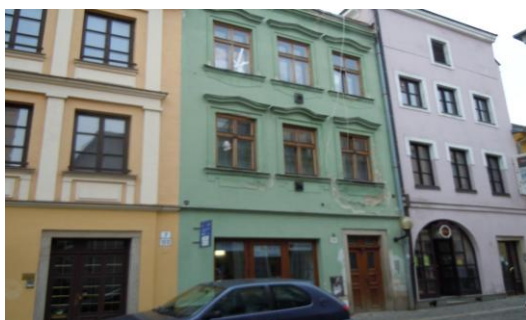
Obr. 7. Lokalita C – část centra města

Centrum města bylo do poloviny 80. let obydleno převážně romskými rodinami. Tyto rodiny bydlely v městských bytech, většinou 4. kategorie. Jeden byt obývalo zpravidla i několik generací. Jednalo se o starou neudržovanou zástavbu bez sociálního vybavení. S výstavbou nového sídliště Horní Kosov došlo k odstěhování mnoha rodin z centra města do nových bytů. I přesto zde zůstala značná část původních romských obyvatel. Postupem času se ze sídliště opět někteří vrátili do centra a žijí zde dodnes. Upřednostňují zejména umístění lokality v centru města, kterou vnímají jako centrum společenského života.