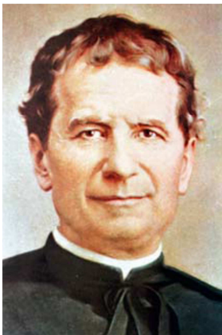
Obrázek 1 Don Bosko