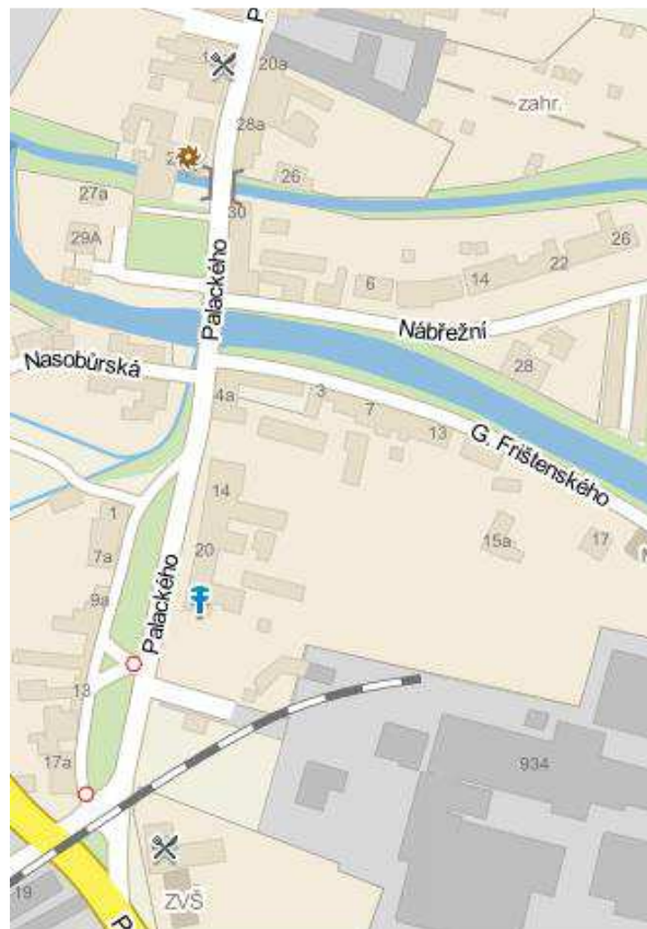
Obr. 1. Mapa ulic, kde tornádo působilo nejničivěji. [30]

Dne 9. 6. 2004 v době od 16:42 do 16:49 hodin (v délce 7 minut) prošla městem Litovel větrná smršť. Tato větrná smršť byla později pracovníky Českého hydrometeorologického ústavu v Brně označena jako tornádo 3 stupně. Rychlost větru v tomto případě dosahuje 71 – 92 m/s (velké škody, stromy vytrhány z kořenů nebo přelomeny, ničeny domy a jiné budovy).