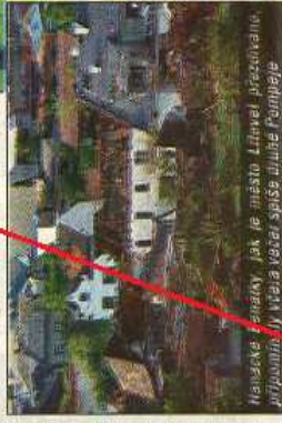
Hanácké Benátky jak je město Litovel připomínají. Věla vesel spíše dublé Pompeje

Krizový stav byl vyhlášen pouze pro katastrální území Litovel a katastrální území Chořelice.