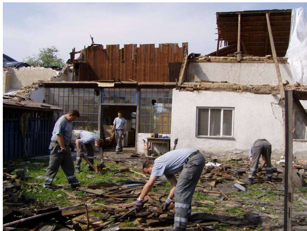
Obr. 4. Odklizení následků činnosti tornáda. [30]