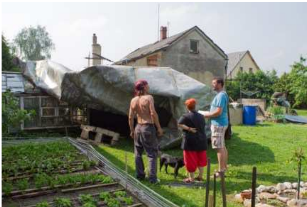
Obr. 6. Zástupce médií při rozhovoru. [30]

Dle informací zástupců médií se opravdu může stát, že ne všechny získané informace z místa MU jsou zcela objektivní, protože není v jejich silách oslovit všechny poškozené občany a tím ověřit pravdivost informací. Velkou roli hrají i emoce poškozených, kteří mnohdy nadsazují dopad události, která se jich přímo dotkla.