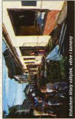
Vzduchem létaly nábytek, větve i kameny

„Zatím jsme vyjeli asi ke stove udeřlosti.“ uvedla včera dvacáté hodiny mluvčí olomouckých hasičů Vladimíra Hacsíkova. „Na pumoc byli povoláni