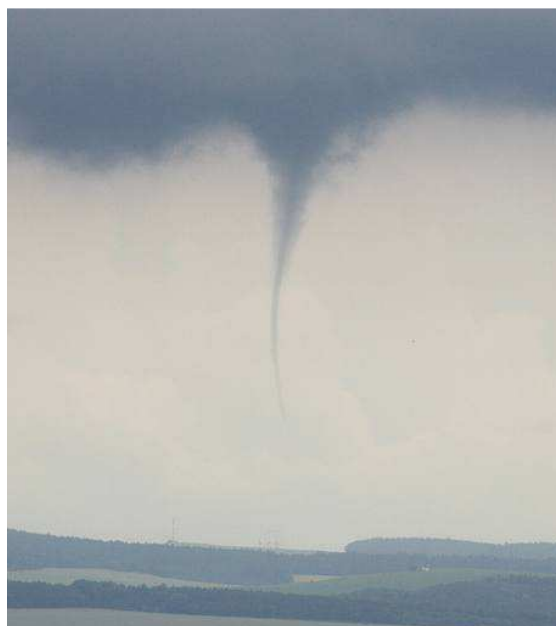
Obr. 2. Tornádo. [30]

Průchod tornáda, jehož nejničivější účinky byly zaznamenány v pásu širokém asi 200 m, kopíroval jedno z ramen řeky Moravy. Nejvíce byli postiženi právě ti obyvatelé, kteří měli v roce 1997 domy zaplaveny při povodni. Tato skutečnost se výrazně podepsala na jejich špatném psychickém stavu. Řádění vichru se však nevyhnulo ani historické Olomouci, kde si dokonce vyžádalo jeden lidský život. [27]