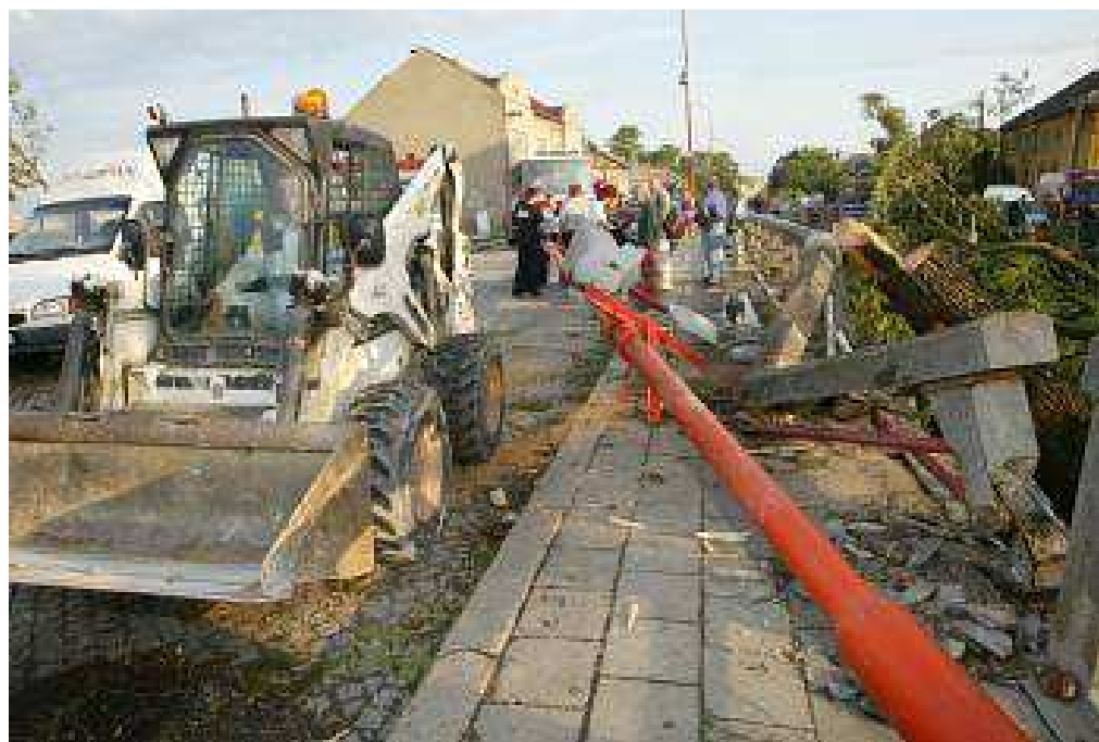
Obr. 5. Odklizení následků činnosti tornáda. [30]