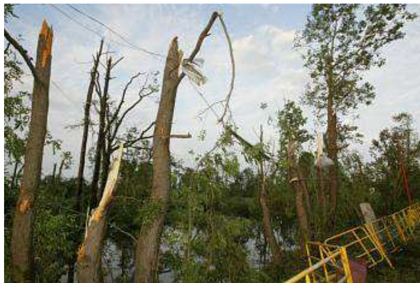
Obr. 3. Polámané stromy po působení tornáda. [30]

Situace v Litovli byla zpočátku nepřehledná a škody byly charakterizovány polámanými a vyvrácenými stromy, poškozenými krytinami střech. V některých místech byly z domů odneseny celé střešní konstrukce a na většině objektů byly rozbity výplně oken a dveří, znečištěny místní komunikace, zničeno pouliční osvětlení, dopravní značení apod. Dále vznikla celá řada místních drobnějších škod a na řadě míst bylo nutno odklízet zbytky stavebních a jiných konstrukcí. Z počátku nebylo jasné, zda na místě události jsou zranění či oběti na životech. [27]