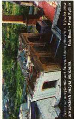
Zářiva se nepřipula ani litovelskému pivovaru. Vyvolala ohně, ale nášší se nebyla ohrožena.