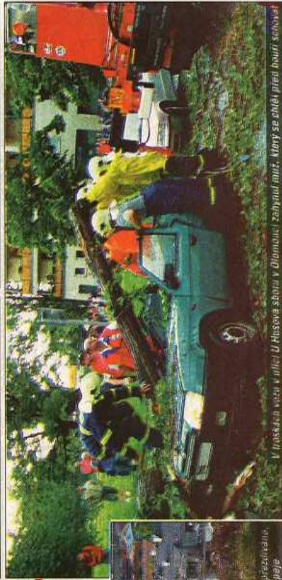
V háskách vozu v ulici U Husově sboru v Olomouci zahynul muž. který se ohně před bouří suboval