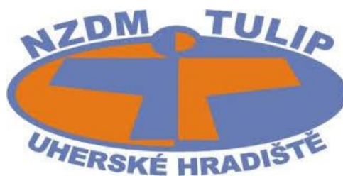
Obr. 1. Logo TULiP – nízkoprahové zařízení pro děti a mládež

NZDM TULiP je členem České Asociace Streetwork (Č.A.S.), která slučuje nízkoprahová zařízení pro mládež v rámci celé ČR. Pracovní skupiny nízkoprahových klubů Zlínského kraje mají za úkol kolektivně usilovat o rozvoj oboru na krajské úrovni. Jedná se především o vyvinutí kontaktů s institucemi, konání společných setkání, volnočasové aktivity, sportovní akce a prezentují zařízení na veřejnosti.