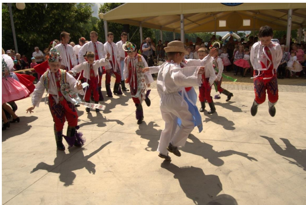
4 – hošíje v podání dětí