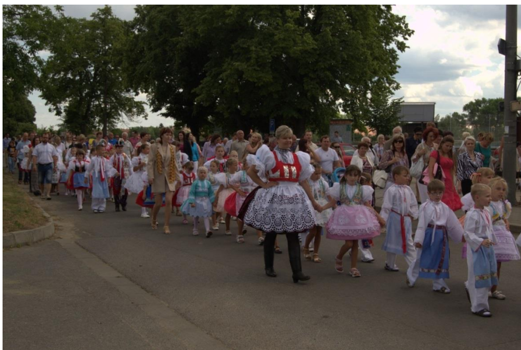
3 – průvod krojovaných dětí