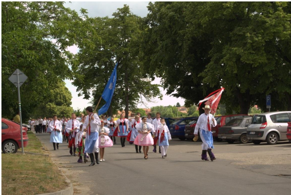
2 – dětské hody