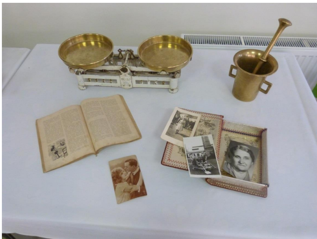
9 – výstava starých předmětů