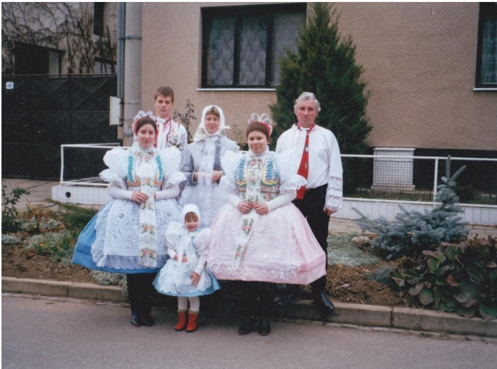
1 – kroj jako rodinná tradice