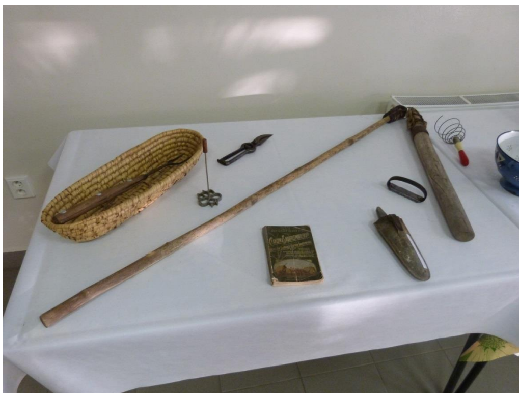
7 – výstava starých předmětů