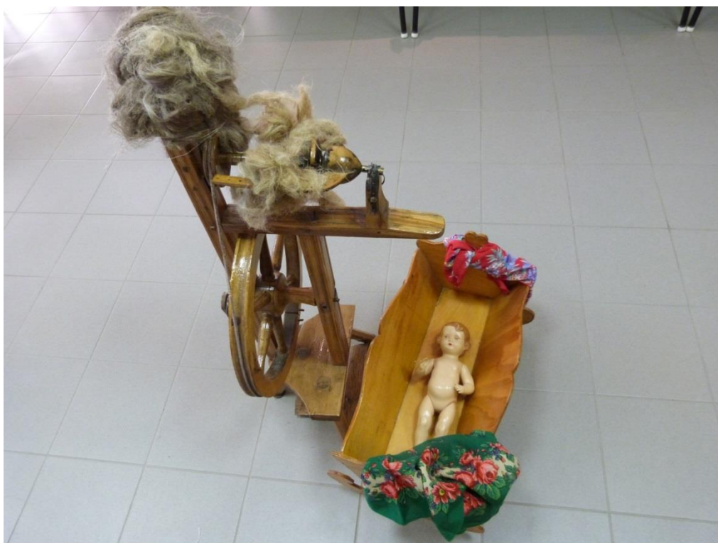
6 – výstava starých předmětů