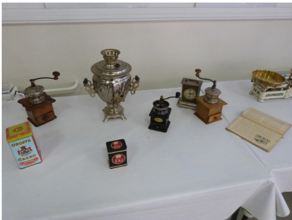
8 – výstava starých předmětů