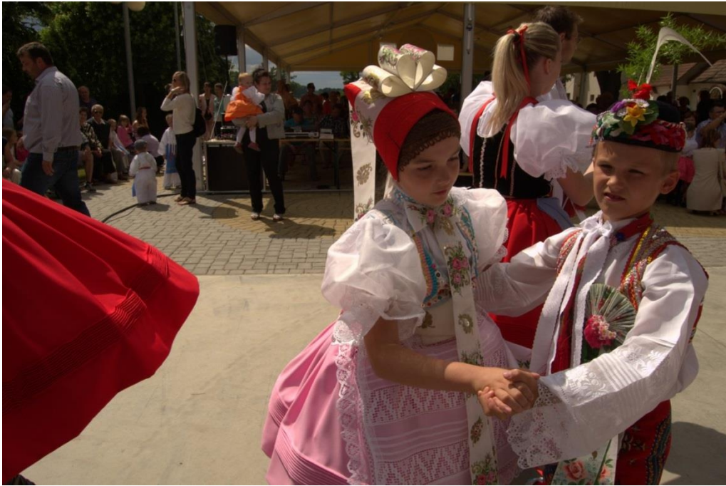
5 – malí tanečníci