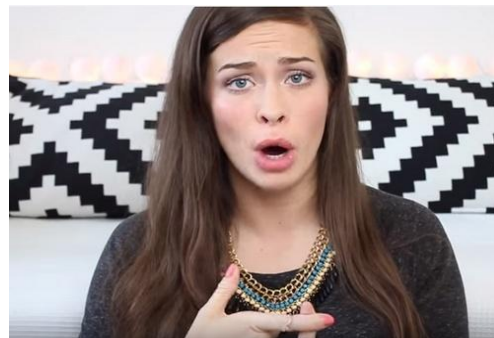
Abb. 4.: Geste 4