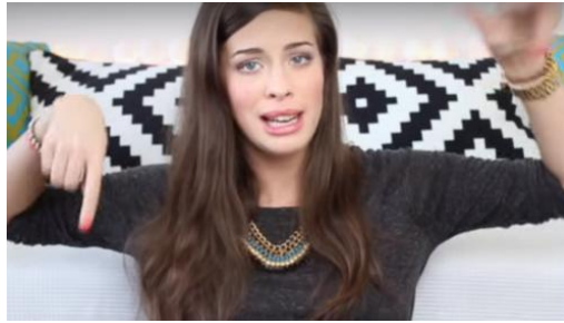
Abb. 2.: Geste 2