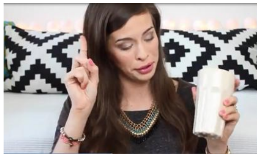
Abb. 3.: Geste 3