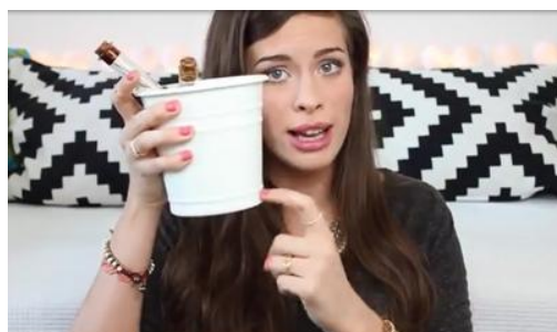
Abb. 1.: Geste 1

Im Bereich der Gestik sind vor allem Zeigegesten an der Kommunikation beteiligt. Sie treten sowohl alleine als auch im Zusammenspiel mit deiktischen Ausdrücken wie da und hier auf, wobei die Gestik und verbale Äußerung parallel erfolgen. Sie erfüllen in der Rede zahlreiche Funktionen. Beispielsweise zeigt der Zeigefinger auf einen Gegenstand, um die Aufmerksamkeit des Publikums auf ebendiesen zu lenken. Die Zeigegesten werden auch zum Vorzeigen einer beliebigen Richtung verwendet. Zu weiteren Handzeichen gehört erhobener Zeigefinger, mit dessen Hilfe in der Rede Wichtiges unterstrichen wird. Als Visualisierungshilfe fungiert auch die Aufzählung mit den Fingern, im Zuge welcher die wichtigen Informationen durch Mitzählen Finger für Finger verdeutlicht werden. Bei diesen Gesten handelt es sich um einfache Zeigegesten, die leicht interpretierbar sind. Einige Beispiele der verwendeten Zeigegesten sind im Folgenden dargestellt.