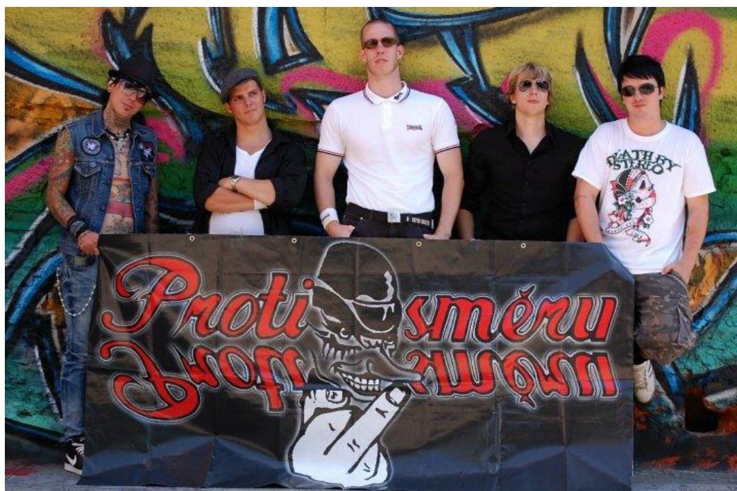
Obr. č. 1 Punk subkultura

U nás se objevili koncem 70. let, což samozřejmě stávajícímu režimu nebylo po chuti. Kapely dostaly zákaz vystupování a jejich stoupenci byli pronásledováni StB. Skutečný nástup punku nastal podle Smolíka až v polovině 80. let, kdy se stal součástí undergroundu (Smolík, 2010, str. 189).