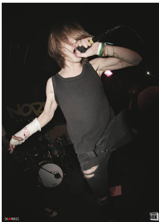
Obr. č. 2 Metal subkultura

Koncerty metalových kapel jsou charakteristické velkou hlasitostí, metal totiž „musí hřmít, buráct a zabíjet“. Americká metalová kapela Manowar je považována za nejhlasitější hudební skupinu vůbec a s hodnotou 129,5 dB je oficiální držitelkou Guinnessova rekordu (pro srovnání, startující letadlo vydává hluk „pouze“ 120 dB). Zatímco punkeři na koncertě tančí „pogo“, metalisté kývají hlavou do rytmu hudby a ukazují rukou tzv. metalové rohy (vidličky, paroháč). Toto gesto údajně odkoukal zpěvák skupiny Black Sabbath od své italské babičky, která jím zaháněla neštěstí. I když se někdy nazývá „satanův pozdrav“ či „d'áblovo znamení“, se satanismem tedy nemá nic společného. Přestože některé odnože metalu se k satanismu opravdu hlásí, rozhodně nelze tuto ideologii považovat za charakteristicky metalovou. Ostatně metal zahrnuje hudebně i ideologicky opravdu rozmanité proudy, stejně jako styly oblečení. Spojujícím prvkem vizáže tak jsou patrně pouze dlouhé rozpuštěné vlasy.