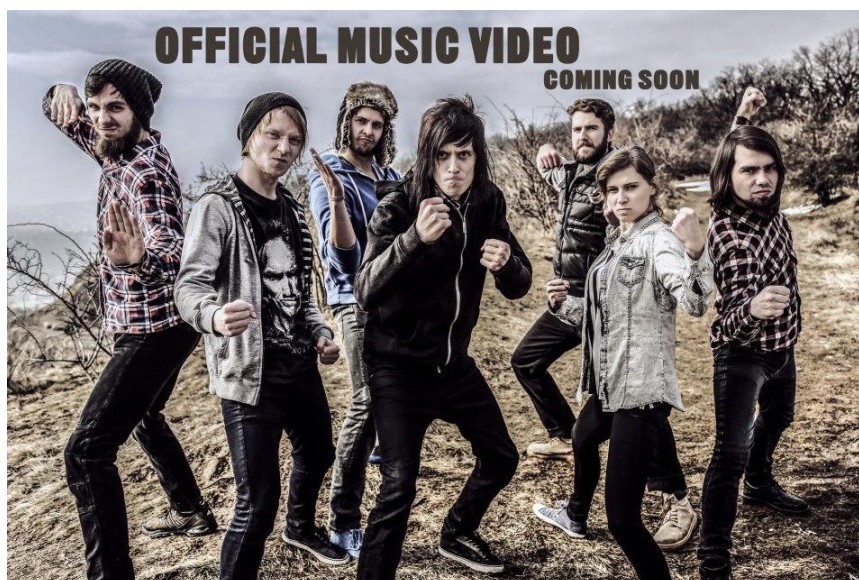
Obr. č. 3 Hardcore subkultura

V reakci na punkovou subkulturní ideologii plnou nihilismu vzniká v rámci hardcore další subkultura charakteristická významným podílem subkulturní ideologie, tzv. Straight Edge, často označovaná zkratkou sXe. Stoupenci Straight Edge jsou zastánci drogové abstinence (včetně legálních drog, tedy alkoholu a cigaret) a odmítají příležitostný sex. Později některé proudy ve snaze o „čistý život“ prosazují také vegetariánství či veganství, typický je pro ně též boj za práva zvířat. Nejvýraznějším symbolem této subkultury je písmeno X nakreslené či vytetované na hřbetu ruky. Jeho původ leží ve zvyklosti označovat mladistvým při vstupu do amerických klubů ruce velkým písmenem X, aby zaměstnanci klubu poznali, že jim nesmí nalít alkohol. Z písmena X se namísto stigmatu stal symbol hrdosti.