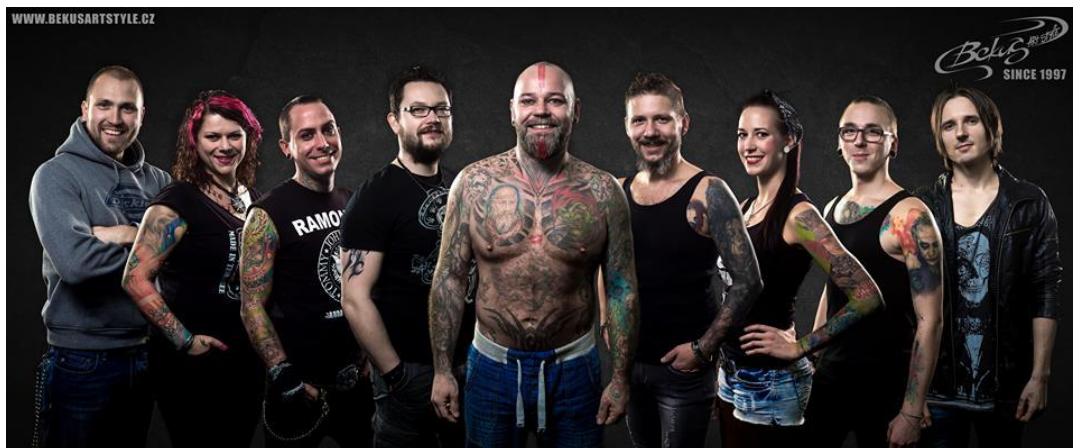
Obr. č. 4 Tatroo subkultura