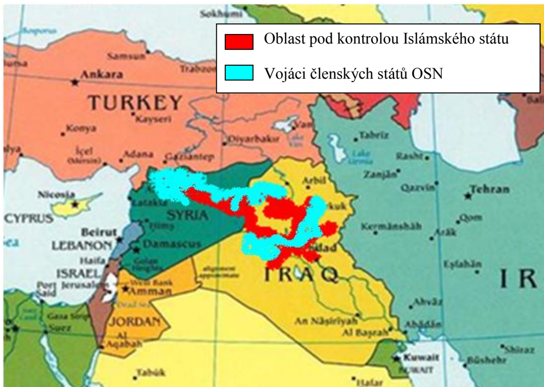
Obr. 5: Mapa boje proti Islámskému státu (prosinec 2019)

vidět, že oblast, kde jsou vojáci členských států OSN, je poměrně menší ve srovnání s Islámským státem, ale důležitým měřítkem je, že vojáci členských států OSN, potlačují Islámský stát.