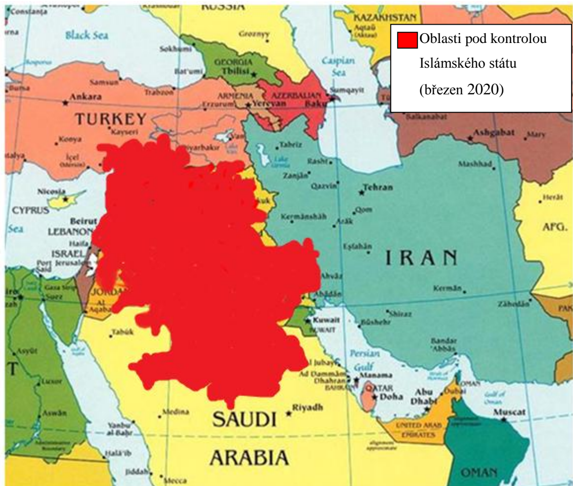
Obr. 4: Mapa oblasti pod kontrolou Islámského státu (březen 2020)

Na obrázku níže je mapa, na které je červeně zobrazena oblast, kterou mají pod kontrolou Islámský stát. Za posledních pět let své území v Sýrii zvýšila pětinasobně a v Iráku jej dvojnásobila.