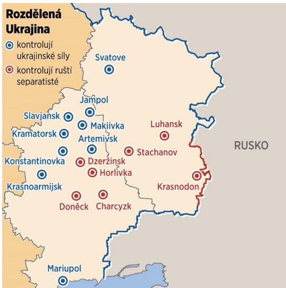
Obr. 1: Mapa Ukrajinského konfliktu (červenec 2014) [19]

Na obrázku níže je mapa, které zobrazuje stav z července 2014 Ukrajinského konfliktu, jak je vidět na mapě červeně onačené body a linie kontrolují ruští separatisté a modré body a linie znázorňují ukrajinské síly.