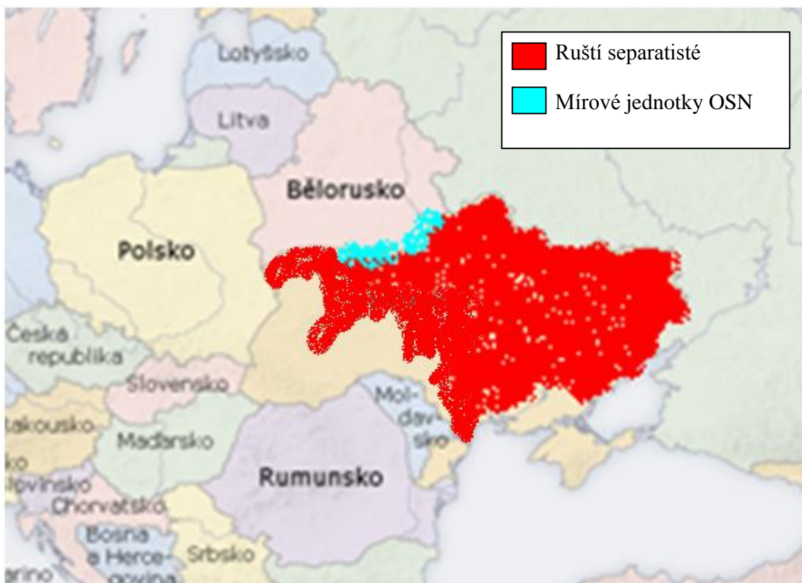
Obr. 3: Mapa ukrajinského konfliktu (duben 2020)

Na obrázku níže je červeně zobrazena oblast, kterou zabírají ruští separatisté a modré území, kde operují mírové jednotky OSN. Ruští separatisté mají pod svojí kontrolou již více jak půlku území Ukrajiny. Mírové jednotky OSN prozatím vyhovělo pouze Bělorusku o ochraně jejích hranic, proti narušení celistvosti Běloruska. Na území Ukrajiny prozatím neoperují vojáci členských států OSN.