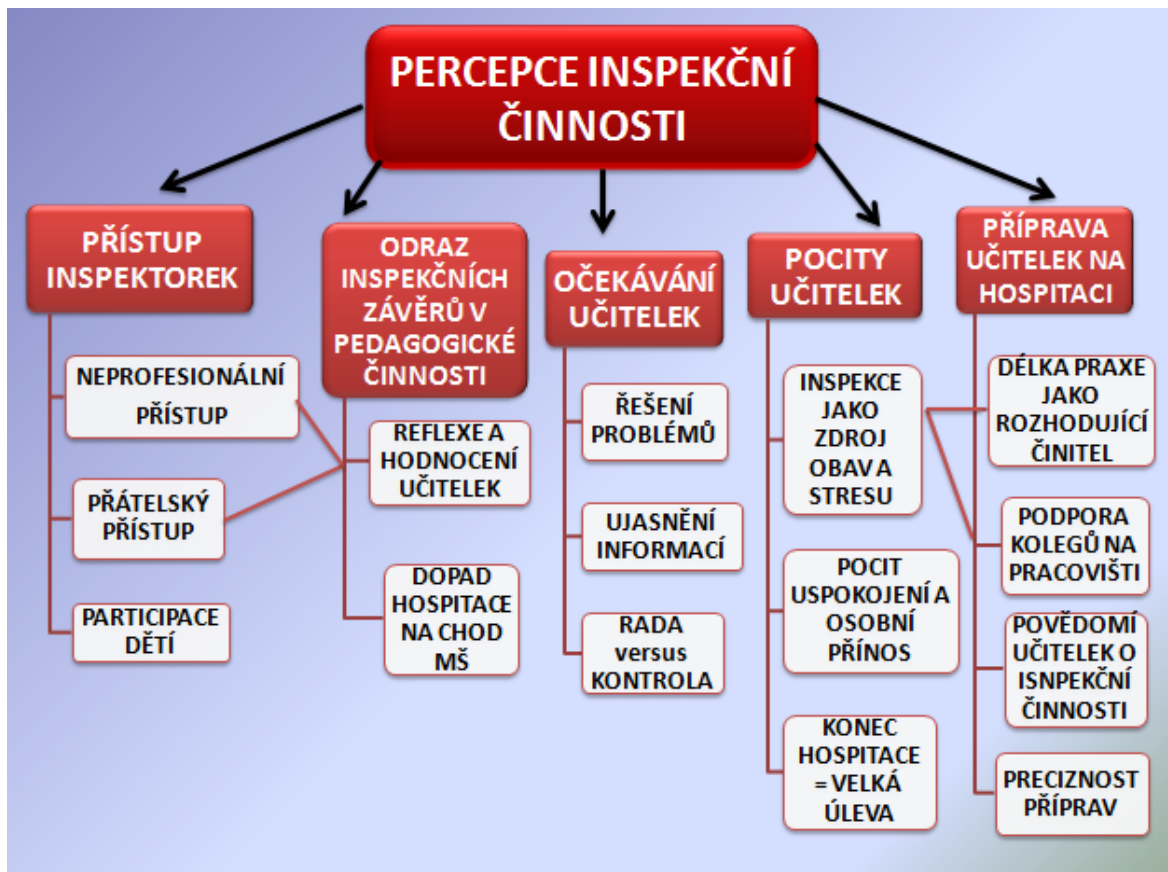
Obrázek 1- Schéma kategorií

V této části práce jsou uvedeny výsledky výzkumu. Z jednotlivých rozhovorů s učitelkami vyplynulo několik významových kategorií a subkategorií, které předkládáme na obrázku 1.