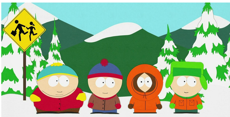
Obr. 1. Ústřední čtveřice seriálu

Film se stal undergroundovou senzací a lidé si jej kopírovali na VHS kazety a CD. Oběma mladíkům začali volat zástupci mnoha amerických televizí s jedinou otázkou: “Co chcete dělat dále?” Získali smlouvu s poměrně novou televizní stanicí jménem Comedy Central na výrobu šesti epizod seriálu Městečko South Park. Název získal po městě v jejich rodném Coloradu, ze kterého se šířily zvěsti o pozorování UFO či Yettiho. Hlavními postavami je čtveřice čtvrtáků s prořízlou pusou- obtloustlý a sociopatický Eric Cartman, který je antagonistou mnoha dílů, Žid Kyle Broflovski, jehož předobrazem je Matt Stone, sociálně slabý Kenny McCormick, který v každém díle prvních sezón zahyne a Stan March, který reprezentuje Treye Parkera.