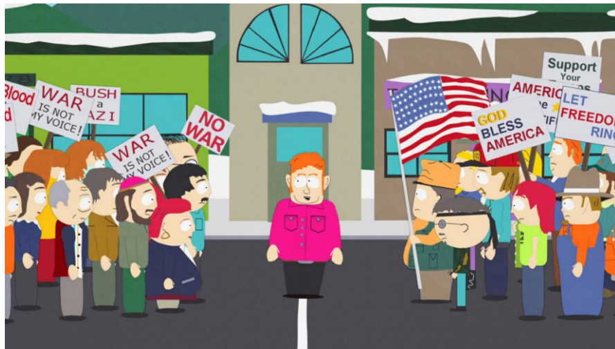
Obr. 2. Tvůrci se vymezují proti extrémům na obou stranách