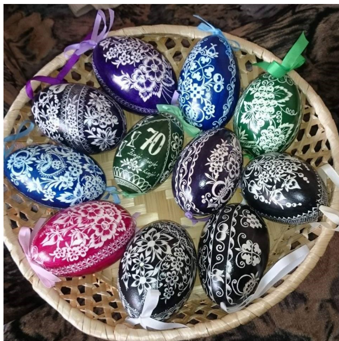
Obrázek 4 Škrábané kraslice

chleba s cibulí a zapíjet to vínem, nebo burčákem. Zároveň je otevřená i Konírna, o které jsem psala výše, kde je stálá expozice taktéž k nahlédnutí. Pro všechny jsou k dispozici dílničky, ve kterých s můžete vyzkoušet malování ornamentů, tvoření z marcipánu, korálky aj. aktivity, ve kterých se vyřádí nejvíce děti. Na nádvoří se nachází také podium, na kterém můžete shlédnout divadlo, hudební a taneční vystoupení. Celý den je doprovázen za krásné hudby cimbálek všech obcí.