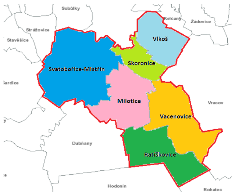
Obrázek 3 Obce mikroregionu ND