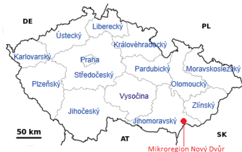
Obrázek 2 Poloha mikroregionu na mapě ČR

je zalesněna borovými lesy. Nejvíce charakteristické pro mikroregion je velké množství sadů a vinic. (Mikroregion Nový Dvůr, 2009)