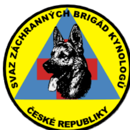
Obrázek 10 - Znak Svazu záchrané brigády kynologů ČR

Svaz je členěn do 14 krajských brigád a působí zde 486 aktivních členů.