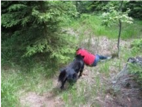
Obrázek 17 - Pes při nalezení pohřešované osoby [25]

pátrací skupiny je, že během vyhledávání nemůže být větší počet lidí, z důvodu pravděpodobného zničení pachové stopy pohřešované osoby. [4]