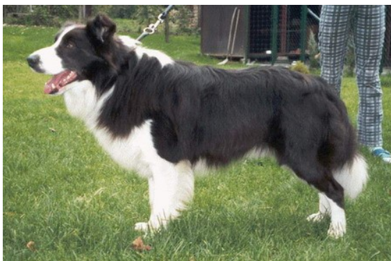
Obrázek 19 - Border Colie [30]

Velice inteligentní, učenlivý, pracovitý a odvážný pes, který se dokáže skamarádit s každým živým tvorem. Je velice aktivní a potřebuje pohyb. Jedná se o středně velké plemeno se skvělou konstitucí těla. Výška v kohoutku se pohybuje okolo 53 cm, hmotnost kolem 20 kg a dožívá se 13 let. [3]