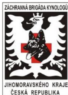
Obrázek 8 - Znak Záchranné brigády kynologů Jihomoravského kraje

Zabývá se výcvikem a využíváním záchranných psů při přírodních katastrofách, průmyslových haváriích atd.