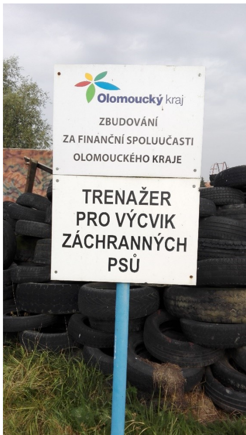
Obrázek 22 - Trenažer pro výcvik psů Vlkoš [Vlastní]