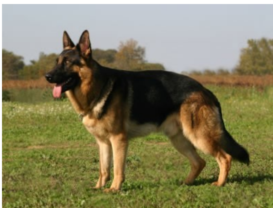
Obrázek 18 - Německý ovčák [30]

Nejvyužívanější plemeno k sutinovému vyhledávání. Pes je velice chytrý, učenlivý, sebevědomý a odvážný. To jsou vlastnosti psa, které jsou k této práci potřeba. Rádí pracují pro svého pána a ve své aktivitě jsou neskutečně vytrvalí, dokáží velmi dobře vycházet s ostatními psy. Německý ovčák je pes střední velikosti. Velikost feny v kohoutku je kolem 60 cm a psa 65 cm, váha feny kolem 25 kg a psa 35 kg. Dožívají se věku 12-13 let. [3]