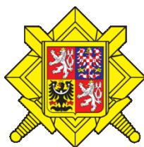
Obrázek 7 - Znak armády ČR [17]

Psi používání v armádě jsou většinou využíváni ke hlídkám a strážení objektů. Celkově má armáda 1350 psů různých plemen.