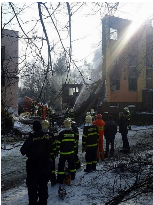
Obrázek 27 - Byt po výbuchu ve Frenštátě pod Radhoštěm [33]

Seznam psů, kteří pomáhali na místě mimořádné události: