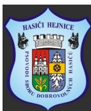
Obrázek 13 - Znak SDH Hejnice

Spolek byl založený roku 2000, důvod založení bylo využití týmů psů v mezinárodních, národních záchranných a pátracích akcích. Týmy jsou vycvičené, aby dokázaly vyhledat ve všech terénech. Jeden takový tým dokáže nahradit až deset lidí v rojnici. Psi a psovodi musí projít těžkým tréninkem, ale na konci jsou připravení vyrazit kdykoliv na pomoc. Jejich psi dokáží vystopovat člověka pomocí pachu ve větru, takže nepotřebují mít předmět pohřešované osoby. Díky tomuto tréninku může tým psovoda a psa vyrazit i za špatného počasí a vyhledávat osobu. [34]