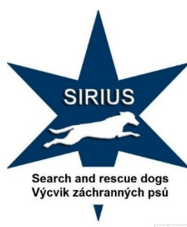
Obrázek 11 - Znak kynologické organizace SIRIUS [36]

Organizace vznikla roku 2012, ještě ten samý rok se dokázala připojit k ostatním složkám IZS.