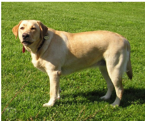
Obrázek 21 - Labradorský retrívr [30]

Toto plemeno je neagresivní vůči ostatním lidem a psům. Také je velice inteligentní a přátelský. Navíc je to všestranný pes, který se používá i jako vodící pes pro slepce. Disponuje skvělým čichem, proto se často používá i k vyhledávání drog. Výška psa je kolem 56 cm a jeho váha okolo 30 kg. Dožívají se až 14 let. [13]