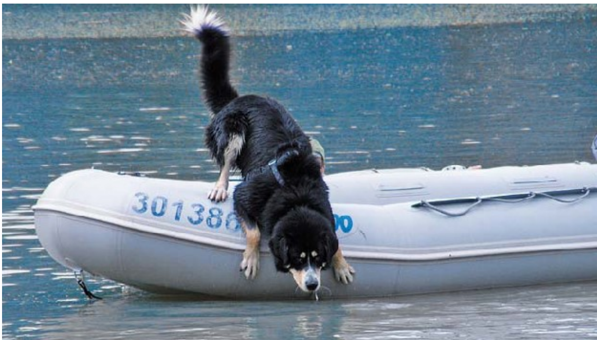
Obrázek 16 - Záchranářský pes při seskoku do vody [31]