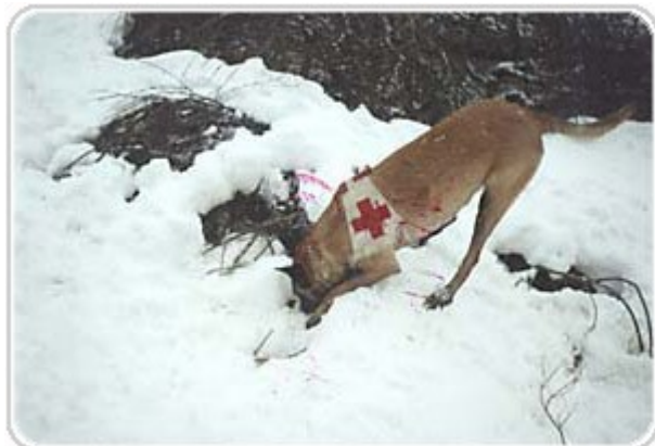
Obrázek 15 - Pes vyhledává pohřešovanou osobu ve sněhu [19]

Horská služba se organizuje především v oblastech jako je Šumava, Krušné hory, Jizerské hory, Krkonoše, Jeseníky, Beskydy a Orlické hory. [4]