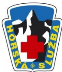
Obrázek 5 - Znak horské služby [23]