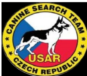
Obrázek 12 - Znak Team USAR

Jednotka (Urban search and rescue) Najdi a zachraň. Její historie sahá do let 1999, kdy se začala formovat na specializovanou záchrannou jednotku pro záchranné práce v obydlených oblastech nebo při zemětřesení, během kterých vyhledávají a zachraňují osoby. V minulosti odřad USAR se zúčastnil několika misí v zahraničí, v oblastech zemětřesení (Turecko, Taiwan, Iránu, Alžírsko). V zahraničí byli společně i se skupinami z dalších svazů. [16]