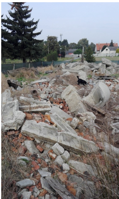
Obrázek 23 - Vpuštění psa do prostoru [Vlastní]

Pes, který vyhledává osobu musí postupovat systematicky a prohledat každé zákoutí. V případě špatného postupu by mohlo dojít k nenalezení osoby, tím pádem také k nezdaru při atestech. Psovod musí svého psa neustále sledovat při práci a popřípadě psa navést na místo, kde ještě nevyhledával.