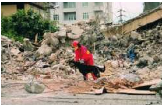
Obrázek 28 - Kynologická dvojice při obtížném hledání osob v Turecku [20]

V Istanbulu je odvezla místní policie do města Yalova-Cinarciku, kde skupina záchranářů poprvé spatřila hrůzu, kterou zemětřesení spáchalo. Z města zbyly jen sutiny a všude okolo byli lidé, kteří pod nimi měli své příbuzné.