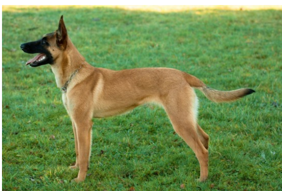
Obrázek 20 - Belgický ovčák – Malinois [30]

Disponuje vynikajícími vlastnostmi, a to zejména inteligencí, učenlivostí, vytrvalostí a pracovitostí, je to skvělý obranář, protože vůči cizím lidem je odměřený. Plemeno je středně vysokého vzrůstu. Malinois znamená krátkosrstý, barva jeho srsti je rezavá a bílá barva je pouze na prsou a prstech. Výška v kohoutku okolo 60 cm. Hmotnost 25 kg a dožívá se až 14 let. [3]