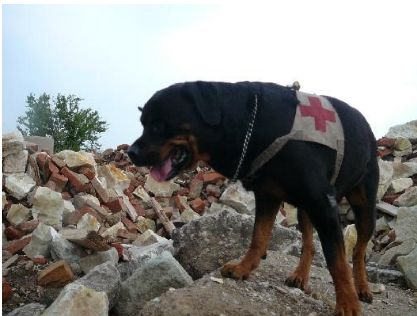
Obrázek 14 - Pes při vyhledávání osob v sutinách [27]