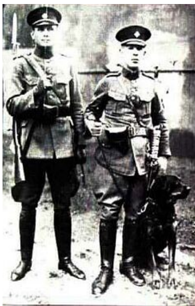
Obrázek 1 - Četnická kynologická skupina v roce 1928 [22]

Počátky kynologie v ČR jsou spojeny s lovem zvěře. Karel IV. měl na hradě psinec. Během 16.-19. století bylo naše území považováno za nejlepší loveckou oblast, a právě