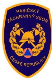
Obrázek 4 - Znak hasičského záchranného sboru ČR [15]

Jedním z mnoha úkolů při mimořádné události je poskytnout první pomoci, a to i během mimořádných událostí, vyžadující nalezení a záchranu osob pod sutinami. Při této události nastupuje kynologická dvojice, která je nedělitelná, při indispozici jednoho z nich se tým stává nepoužitelným.