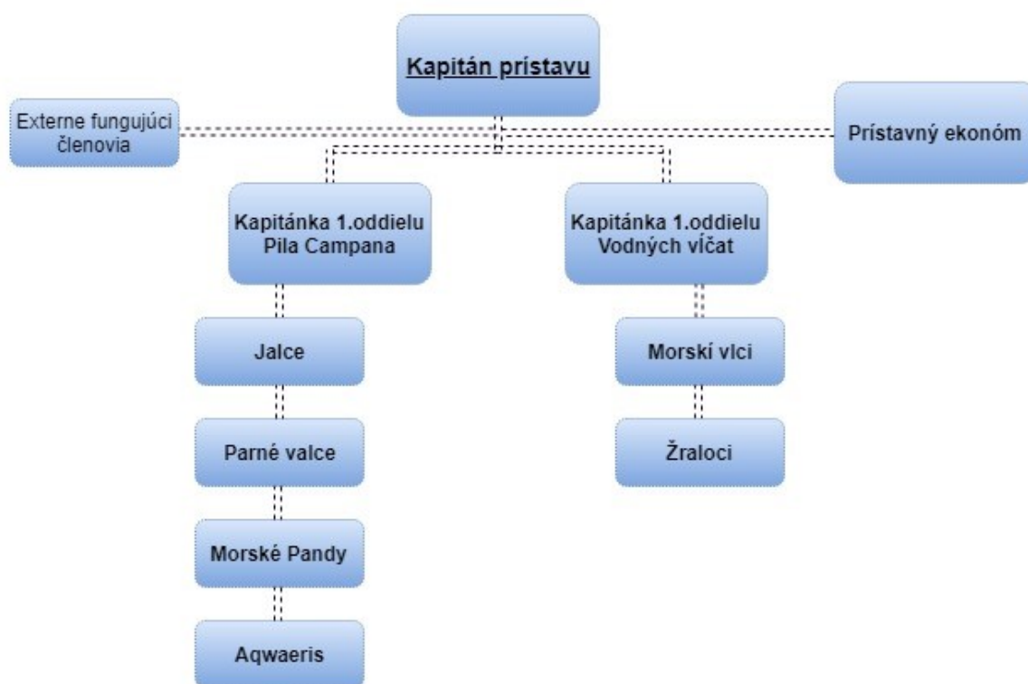
Obrázok 2 Organizačná štruktúra (vlastné spracovanie)