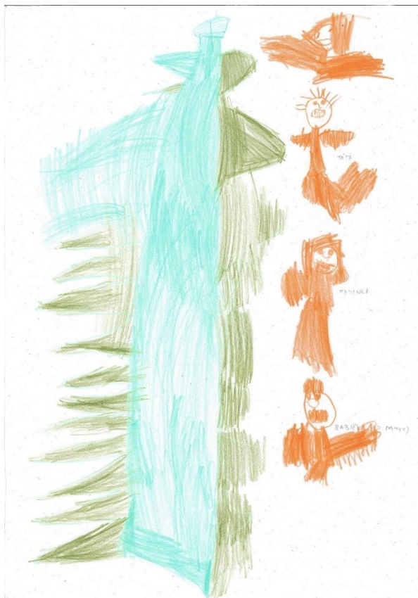
Obrázek č. 1: Kresba dítěte č. 8