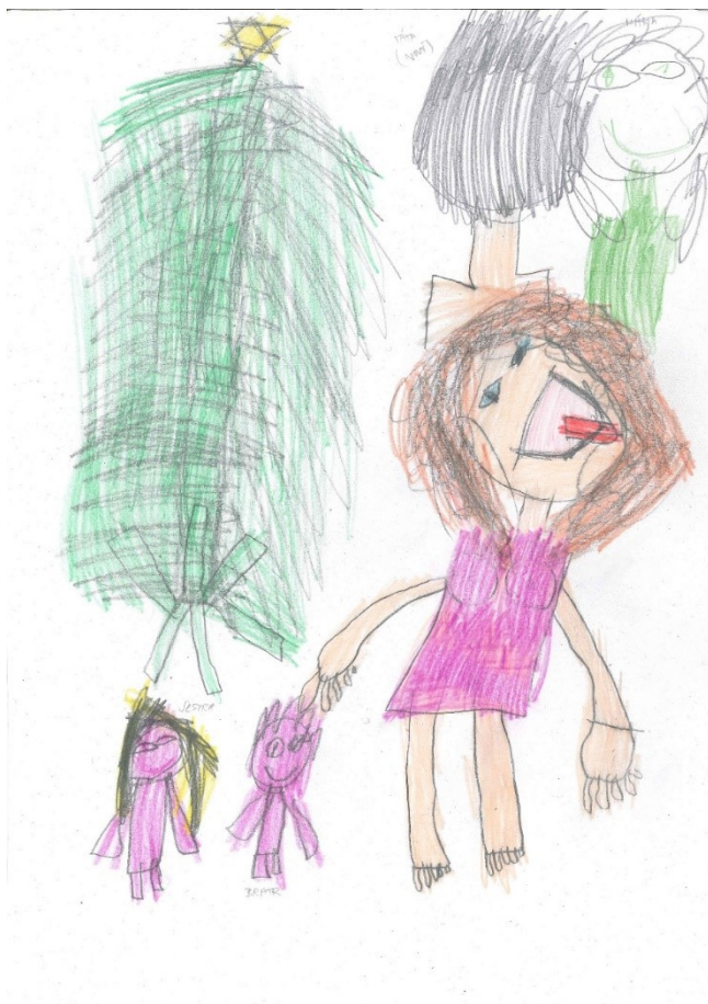
Obrázek č. 3: Kresba dítěte č. 9