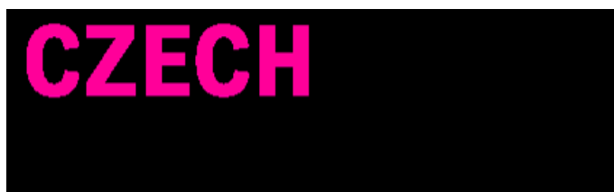
Obrázek 1 - Logo Czech Film Commission 41

Czech Film Commission (dále jen CFC) je národní filmovou kanceláří České republiky, která pod sebou sdružuje všechny filmové kanceláře na úrovni regionů, krajů a měst v ČR 40 .