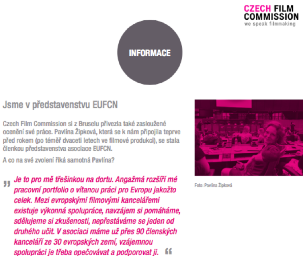
Obrázek 2 – Ukázka z Film Friendly Newsletteru (05/2017) 64

V komunikaci s regionálními kanceláři využívá CFC i nepravidelný “Film Friendly Newsletter” vydávaný několikrát do roka a distribuovaný elektronicky. Newsletter se věnuje aktuálním akcím a událostem světa filmu, co se děje v České republice v oblasti filmového natáčení, trendy a tipy českých a světových FK, aktuální výzvy, činnosti a aktuality jednotlivých kanceláří v rubrice “Z regionů”, které sem samy aktivně přispívají. Zde jsou popsány zejména aktuálně probíhající projekty včetně fotografií a rozhovorů. Nejen tímto newsletterem spojuje Czech Film Commission filmové kanceláře ČR 63 .