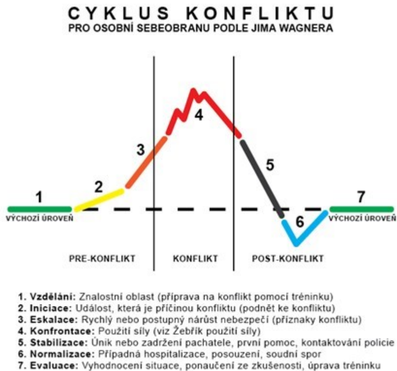
Obrázek 2: Cyklus konfliktu (Inovace SEBS a ASEBS, 2011)

Výchozí úroveň představuje normální stav bez konfliktu. Barevná křivka zobrazuje průběh samotného konfliktu ve třech fázích.