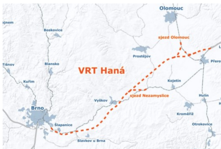
Obrázek 4 – Vymezení vysokorychlostní trasy (VRT) Haná (Správa železnic, © 2021)

V rámci celé České republiky je v přípravě několik vysokorychlostních tratí – VRT Praha – Brno – Ostrava. Ve fázi studie proveditelnosti je prověřována výstavby vysokorychlostní tratě nazvané VRT – Haná, která by poskytla zkrácení cestování na trase Praha – Brno – Ostrava – Polsko. Z obrázku 4 lze vidět, že plánovaná trasa by se nacházela poblíž města Kojetín. (VRT Haná, © 2021)