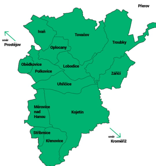
Obrázek 2 - Vymezení obcí MAS Střední Haná

Místní akční skupina Střední Haná vychází z obcí v mikroregionu. Pouze město Němčice nad Hanou není členem MAS Střední Haná. V současnosti se mikroregion rozprostírá na území o celkové ploše 141,05 km 2 v rovinaté oblasti Hané, v jižní části od měst Olomouc, Přerov i Prostějov. Počet obyvatel byl v roce 2020 přes 15 tisíc a hustota zalidnění 110 obyvatel na km 2 . Cílem místní akční skupiny je realizace strategie komunitně vedeného místního rozvoje prostřednictvím místního partnerství. Místní akční skupinu vytváří jak právnické osoby, tak fyzické osoby soukromého i veřejného sektoru, které zastupují jejich zájmy. Hlavním cílem je tedy realizace projektů na území mikroregionu Střední Haná prostřednictvím rozpočtů z Evropské unie, případně národního rozpočtu.