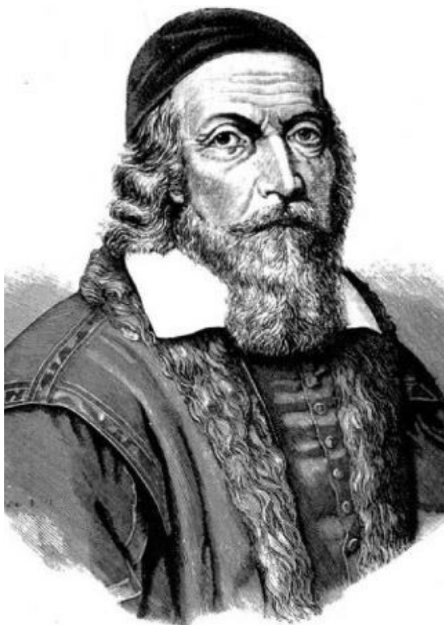
Obr. 2 - Jan Amos Komenský

názorné vyučování a obrazové učebnice byly převratným vynálezem, neboť se do té doby užívalo pouze učení z paměti a tresty. Komenský byl zván do mnoha zemí. Neopustil by Lešno, kdyby nedoufal, že pomocí styků s vysoce postavenými lidmi získá přízeň a pomoc pro své souvěrce a svou ujařmenou zemi. První cesta jej vedla do Londýna, kde strávil téměř rok (Pitter a Plzák 2011, s. 74 – 75). Komenského plány, podporované anglickým parlamentem a jeho přáteli překazily bouře vypuknuvší občanské války. A tak přijal nabídku bohatého holandského kupce Ludvíka de Geer a přestěhoval se do Švédska (Kádner, 1912, s. 7). De Geer jej uvedl ke švédskému kancléři Oxenstjernovi a