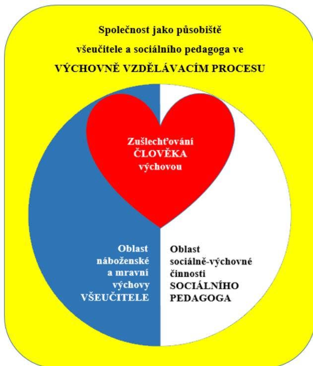
Obr. 4 - všeučitel v.s. sociální pedagog

most mezi těmito profesemi. V této práci se často skloňuje pojem nábožensko-mravní rozměr a nábožensko-mravní výchova. Naším záměrem však není propagovat zavedení nábožensko-mravní výchovy do škol! Institucionalizovanou náboženskou výchovu jsme tu už přece po mnoho staletí měli a historie ukázala, že nepřinesla ovoce, které by ji udrželo při životě. Život není o institucích, ale o lidech. Totiž vést k Bohu mohli jen ti, kteří k němu měli sami blízko a mravně vychovávat jen ti, kteří byli sami mravní. A takoví si svou cestičku, jak vést lidi k Bohu a