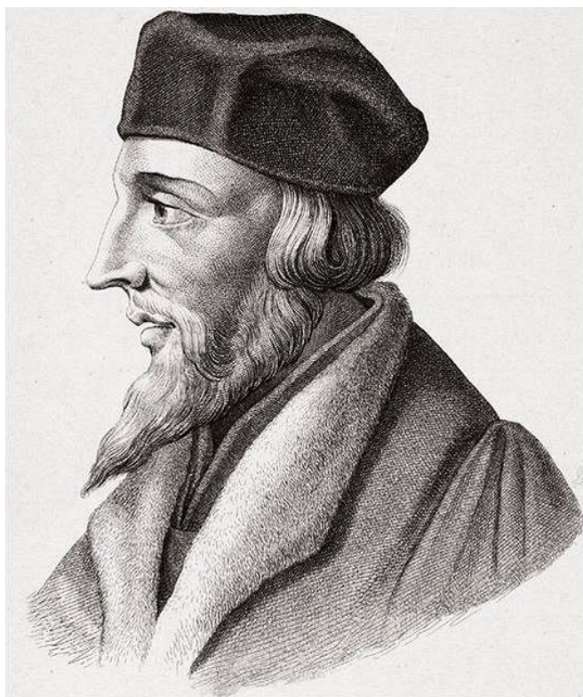
Obr. 1 - Mistr Jan Hus

Dříve měl hlas německého mistra trojnásobnou váhu hlasu mistra českého a nyní to mělo být naopak. Po dobrovolném odchodu protestujících (v počtu asi 2000) německých mistrů, bakalářů a studentů byl Jan Hus zvolen rektorem Karlovy univerzity. Aby lidu usnadnil umění číst a připravil jej pro čtení písma a jiných spisů, složité spřežky (shluky několika písmen) nahradil tečkami a čárkami, čímž položil základ jednotného spisovného jazyka českého a zjednodušeného českého pravopisu (Štech, 1920, s. 11 – 15).