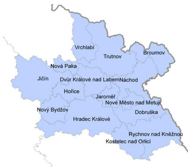
Obr. 1 Pozice ORP Vrchlabí v Královéhradeckém kraji (Správní obvody obcí s rozšířenou působností, 2016)

Správní obvod ORP Vrchlabí se nachází v severní části kraje Královéhradeckého. Skládá se celkem z 16 obcí (Čermná, Černý Důl, Dolní Branná, Dolní Dvůr, Dolní Kalná, Dolní Lánov, Horní Kalná, Klášterská Lhota, Kunčice nad Labem, Lánov, Prosečné, Rudník a Strážné), z čehož status města mají 3 obce (Hostinné, Špindlerův mlýn a Vrchlabí) a status městys má jedna obec (Černý Důl). Svou rozlohou zaujímá 239,44 km 2 , v rámci Královéhradeckého kraje se jedná plošně o šestý největší obvod. (Základní charakteristika území, 2016)