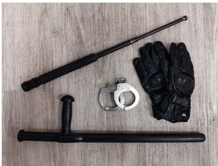
Obrázek 4 – Teleskopický obušek, taktické rukavice, pouta, tonfa

Při výkonu své činnosti nosí strážník veškeré osobní vybavení při sobě nebo jej má uloženo v taktickém batohu, který vozí ve služebním vozidle.