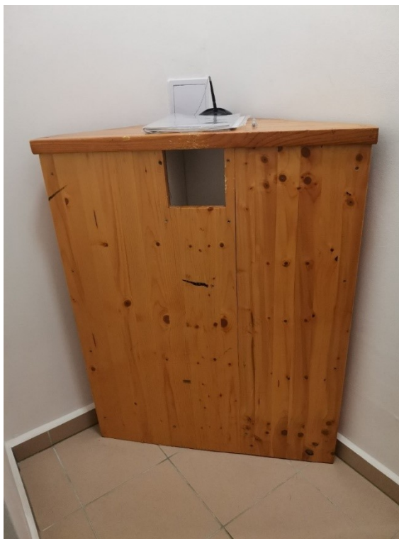
Obrázek 7 – Vybíjecí bedna

K zmírnění rizika je zapotřebí, aby každý strážník znal a dodržoval postup při přebírání a odevzdávání služební zbraně a zbrojíř, který zbraň vydává a přebírá, dohlédl na dodržování těchto postupů.