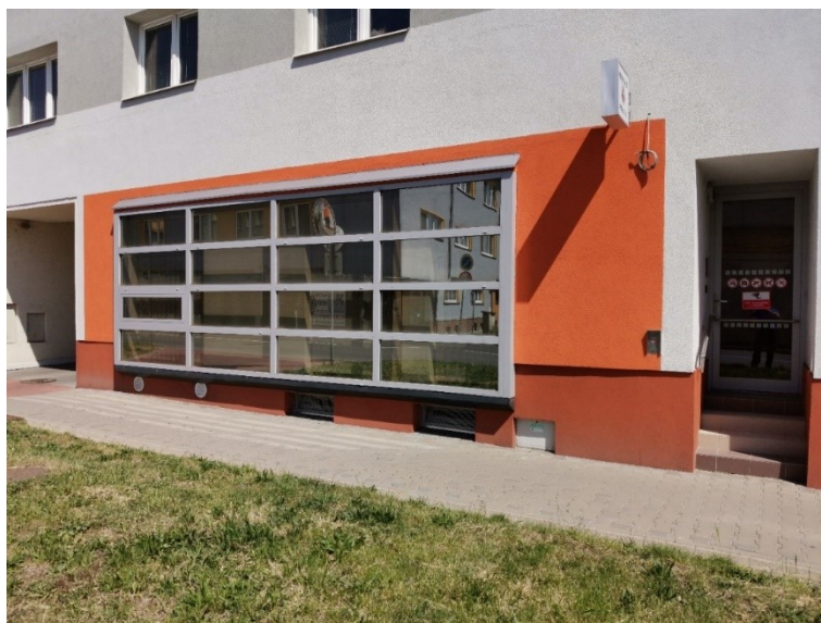
Obrázek 6 – Prosklená část budovy Městské policie Vyškov

Prosklená část budovy Městské policie Vyškov (Obrázek 6) vede do místnosti MKDS, kde se vždy nachází alespoň jeden strážník, který zde koná nepřetržitou službu. V případě útoku na tuto část budovy je vysoce pravděpodobné, že bude v přímém ohrožení i strážník konající nepřetržitou službu.