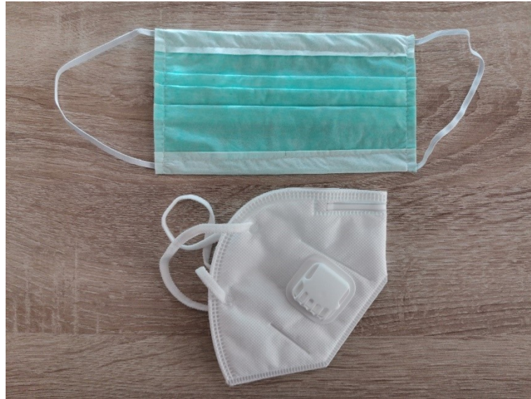
Obrázek 10 – Ústní rouška a respirátor