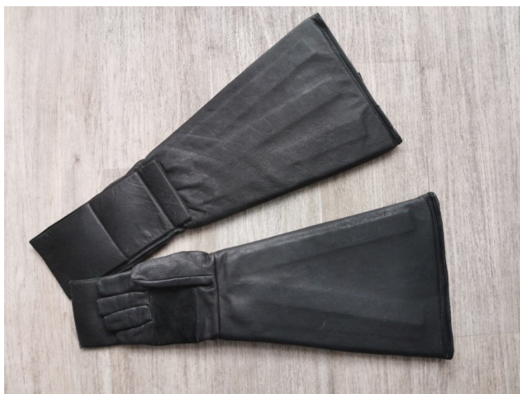
Obrázek 9 – Odchyťové rukavice

K zamezení svého zranění při odchyty volně pobíhajícího zvířete musí strážník správně vyhodnotit situaci, zejména zohlednit, zda zvíře dokáže odchytnou sám, nebo bude potřeba zavolat odborníka, který zvíře odchytné. Pokud se strážník rozhodne provést odchyt sám, měl by použít odpovídající ochranné pomůcky – odchyťová tyč, odchyťové rukavice (Obrázek 9), obojek, vodítko, náhubek. Neméně je však důležitý i samotný postup odchytnu. Všichni strážníci Městské policie Vyškov z tohoto důvodu absolvovali pětidenní kurz odchytnu zvířat na Veterinární a farmaceutické univerzitě v Brně. Po absolvování kurzu už však neprobíhá žádné další školení.