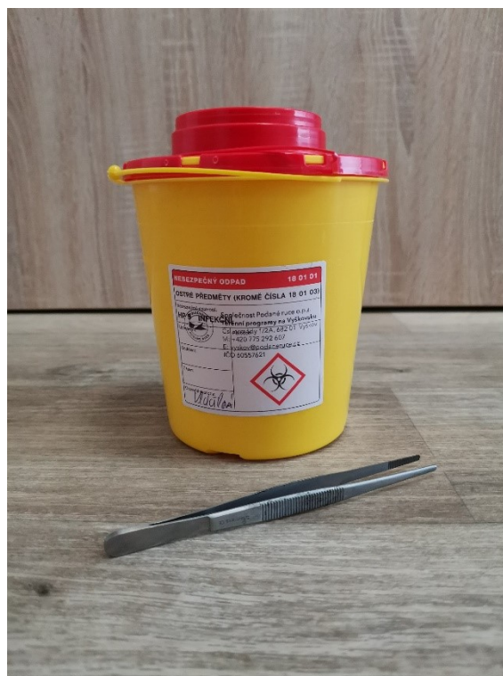
Obrázek 11 – Sběrná nádoba a pinzeta