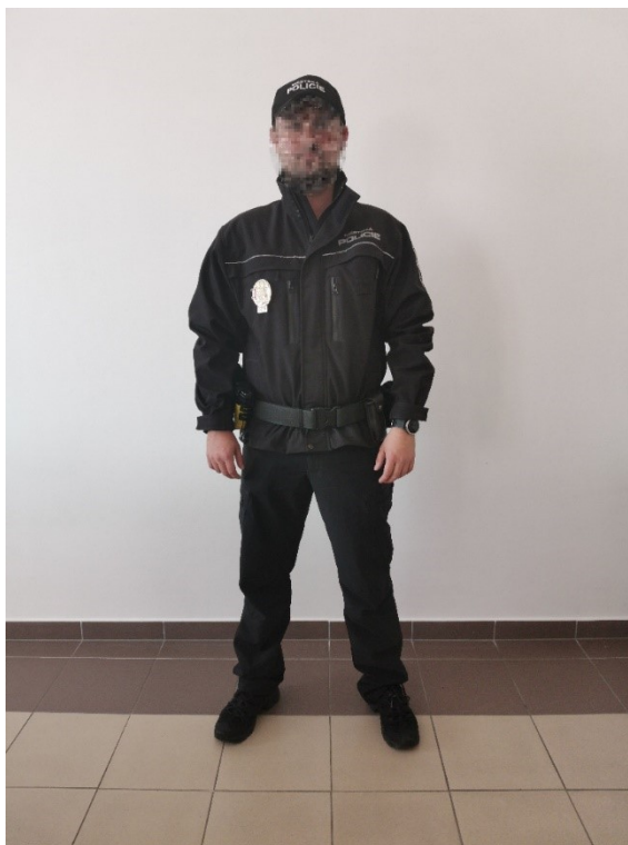
Obrázek 3 – Varianta stejnokroje č. 2