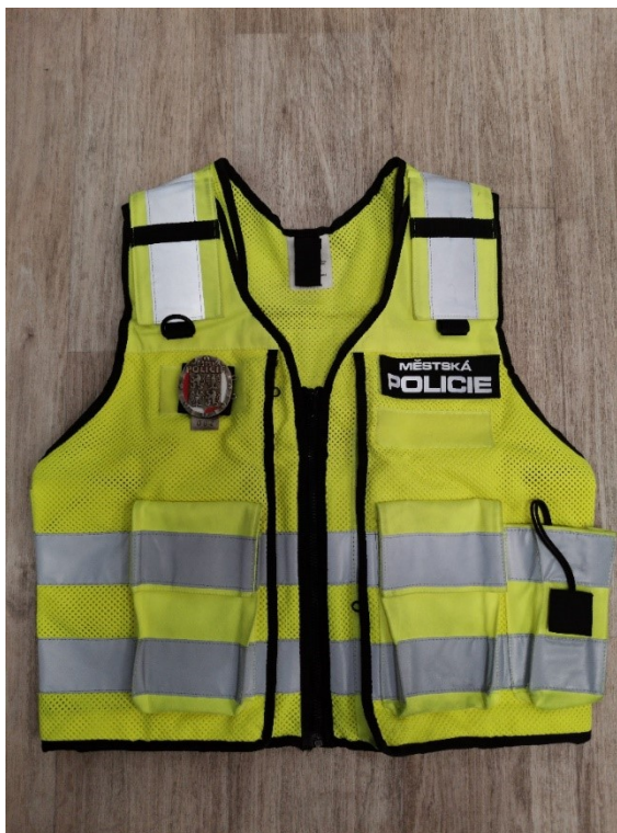
Obrázek 8 – Vesta z retroreflexního materiálu

K minimalizaci rizik zranění při usměrňování dopravy je zapotřebí, aby každý strážník měl a použil potřebné vybavení a s usměrňováním dopravy měl již zkušenosti. Nedostatek zkušeností by měl být řešen odborným školením a samotné usměrňování dopravy nezkušeným strážníkem by mělo být prováděno ve spolupráci se zkušeným strážníkem.