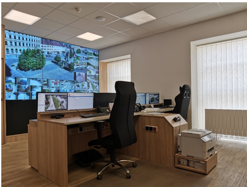
Obrázek 1 – Místnost MKDS

Společně s přesunem na novou služebnu byl modernizován současný MKDS. Došlo k přechodu z analogového systému na digitální přenos, pořízení nové moderní monitorovací stěny (Obrázek 1) a rozšíření stávajících patnácti kamerových bodů na současných třicet osm kamerových bodů.