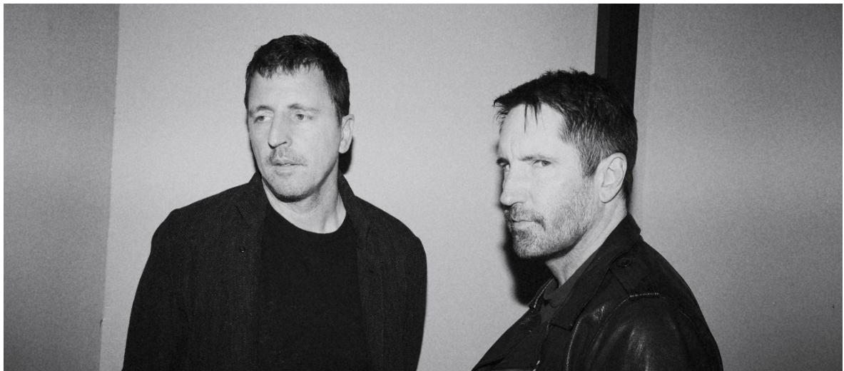
Obrázok 2 – Atticus Ross a Trent Reznor