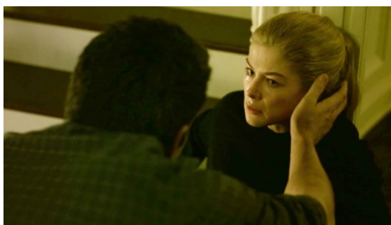
Obrázok 8 – Nick Dunne, Amy Dunne

Celková nálada Gone Girl je veľmi chladná, surová niekedy erotická a v momentoch neuveriteľne násilná. Tento fakt hrá Trentovi do kariet, vzhľadom na estetiku hudby, ktorú skladá a je vidieť, že sa pri skladaní cíti vo svojej koži. Avšak vo filme sa nachádzajú momenty, kde Reznor uvažoval ako hudobne vyjadriť veselé až romantické momenty, ktoré nie sú v jeho doterajšom hudobnom repertoári. Reznor našiel spôsob ako implikovať komfort a zároveň nepôsobiť príliš úprimne vzhľadom na skutočnosť, že charaktery vo filme už k sebe necítia skutočnú lásku. 52 Celý nápad falošného pocitu inšpirovala Davidova Fincherova návšteva chiropraktika. Pri jej návšteve počul hudbu, ktorá ho mala uvoľniť, no jej vyznenie bolo opačné. Tým sa idea falošnej masky, pod ktorou sa skrýva skutočný význam hodila priamo pre film. 53