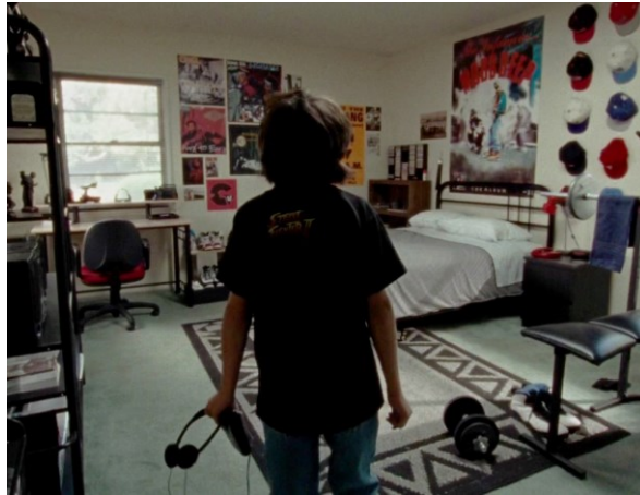
Obrázok 11 – Izba Stevieho staršieho brata

Skladatelia doručujú stopáž originálneho soundtracku v rozpätí 12 minút, ktorý sa preplieťa pomedzi nahusto nabitými populárnymi piesňami. Úvodná titulková skladba „ The Start of Things “ obsahuje syntetizátor, ktorý pokrýva pomalé basové linky a ľahké brnkanie na gitaru v pozadí za dlhou ťahajúcou sa textúrou hrajúcou optimisticky znejúce akordy. Táto kompozícia metaforicky otvára film s otvorením dverí do miestnosti. Reznor pomaly rozvíja motív, tým spôsobom, že filter basovej linky syntetizátoru sa otvára z dvermi do izby a vyššie frekvencie začínajú rezonovať. So skladbou sa postava Stevieho dostáva do izby jeho staršieho brata. Filmové ticho a hudba, ktorá má sprievodnú funkciu divákovi pomáha vcítiť atmosféru 90. rokov pri pohľade na predmety v izbe. Plagáty, topánky, oblečenie, časopisy a videokazety, ktoré obdivuje Stevie v bratovej izbe sú všetko predmety, ktoré sa spájajú s kultúrou 90. rokov a diváka majú silu vrátiť späť do doby ich mladosti. Hudba zdôrazňuje v obrazovej zložke emócie a dodáva intenzívnejší pocit nostalgie, ktorá má pôsobiť na diváka. Aj keď v obraze vidíme pop-kultúrne predmety, bez hudby by táto scéna nedokázala navodiť silný pocit nostalgie v divákovi, a tým hudba v zvukovej zložke s obrazom idú ruka v ruke.