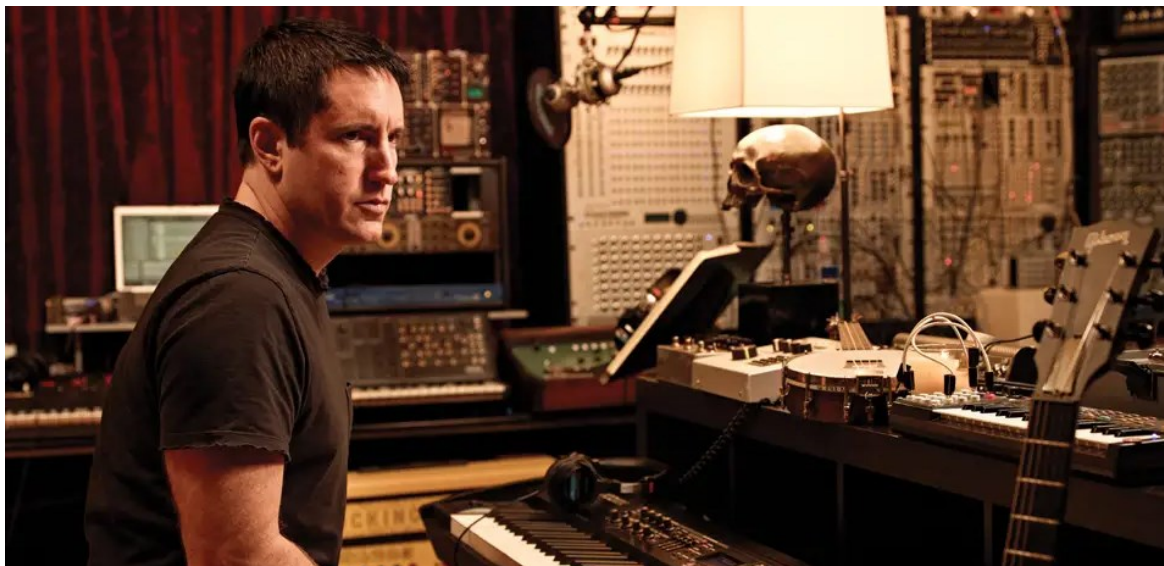
Obrázok 1 – Trent Reznor

Narodený 17. Mája, 1965 v malom mestečku Mercer v Pensylvánii. V meste, kde na dohľad boli len široké polia s kukuricou, dávno pred vznikom internetu, ktorý znehodnotil jeho zvuk 2 . Trent Reznor sa dokázal s jeho alternatívnou, undergroundovou hudbou predat' prehusteným priemyslom plným hviezd, ktorým sa ponuky kladú priamo na dlaň. Doposiaľ predstavuje jednu z neuveriteľne relevantných a dôležitých osobností v dnešnej modernej hudbe. Jeho hudobný rast siaha od neskorých 80-tych rokov až doteraz. Začiatkom jeho hudobného vzdelania boli hodiny klavíru, ktoré neskôr zamenil za klávesy syntetizátoru, čo definitívne posunulo jeho umelecko-estetický hudobný rast na iný level a tento krok mu ponúkol výhľad do nových obzorov.