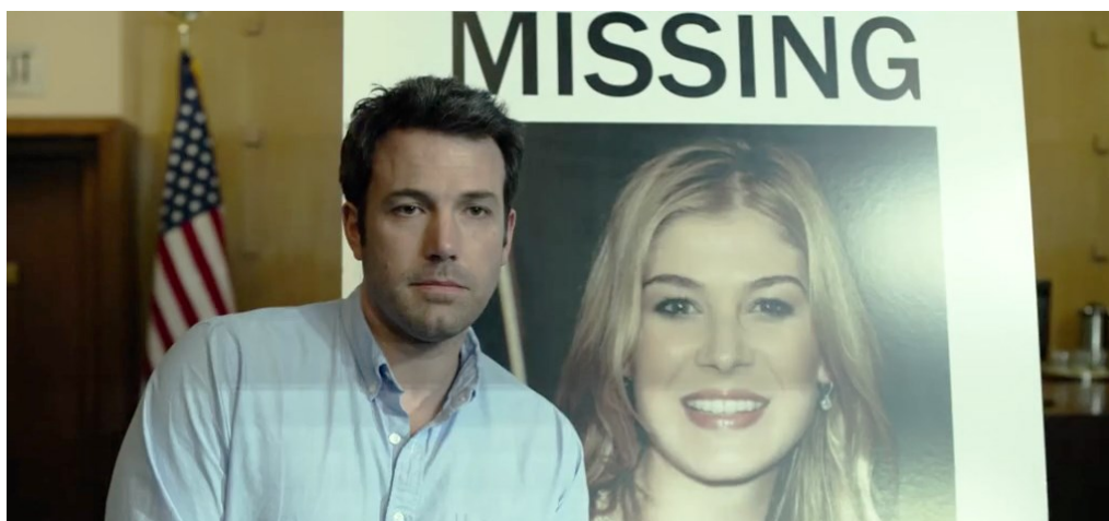
Obrázok 7 – Nick Dunne (Ben Affleck), Amy Dunne (Rosamund Pike)

V tretej spolupráci s Davidom Fincherom na filme Gone Girl Reznorov príbeh a soundtrack pracuje hlavne s manipuláciou postáv. Hlavná postava filmu, Nick Dunne (Ben Affleck), často musí manipulovať svojimi emóciami, ktoré cíti k svojej stratenej manželke Amy Dunne (Rosamund Pike), aby sympatickejšie vyznel v médiách. Zároveň jeho manželka má v pláne sa skrývať pred verejnosťou a nadobudnúť novú identitu vymyslenými scenármi, ktoré sa jej v živote udiali. Reznor sa priamo chytá tejto idei v snímke, využíva momentov, ktoré mu film nadobúda a zahráva sa duševnými stavmi postáv preplietaním hudobných motívov. V snímke Reznor výrazne a častejšie spľňa časové značky strihov, priebehu deja, vypätých momentov a skladá filmovú hudbu úzko spätú napríklad: položením telefónu, používaním počítača, zmene emócií herca, predmetov v obraze a podobne. Zvýrazňuje alebo kontrastuje emóciu, ktorá sa buduje vo vnútorných pocitoch postáv a pomáha scéne stavať napätie niekedy nezvyčajnými a podprahovými spôsobmi. Naopak, práve vo filme The Social Network , hudba rapídny dialógom prenecháva priestor.