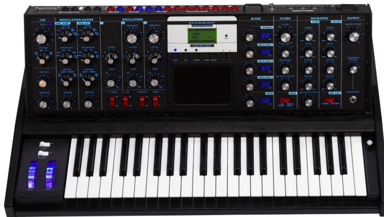
Obrázok 3 – Syntetizátor Moog Voyager

Estetika Reznorovej hudby sa vždy odvíjala od technologických možností v dobe, v ktorej bola skladaná. Veľkým faktorom sa stali hardvérové syntetizátory Moog , ktorými bol Trent uchvátený už ako tínedžer. Prvý syntetizátor vlastnený Trentom bol Moog Prodigy . V interview s Moog Music Inc sa vyjadril, že Moog Prodigy bol darček od jeho starých rodičov a bol to veľký míľnik v živote Reznora. 20 Tento syntetizátor bol spojením jeho záľub ako hudba, klávesy a jeho záujem pre elektroniku, hovorí v dokumentárnom filme I Dream of Wires (2014) 21 . V tom čase mal kapelu, s ktorou hrával covery piesní v garáži, kde Trent začal hľadať svoj zvuk a objavovať rámec možností a hudobných ideí, ktoré mu Moog Prodigy ponúkal.