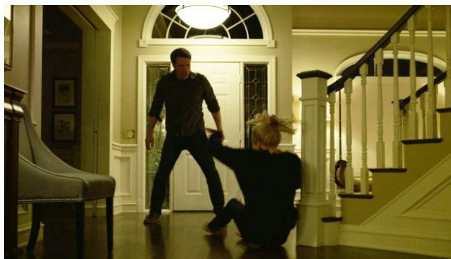
Obrázok 9 – Hádky manželského páru

V 46 minúte filmu môžeme sledovať manželskú hádku sonicky podporenú sláčikovými nástrojmi a syntetickými padmi, ktoré hrajú kontrapunktom priam heroickú melódiu a naberá na intenzite počas čoraz viac dramatickej hádky manželov. Scéna vrcholí fyzickým násilím v obraze, štylizovaným spomalením záberu. Nastáva efekt filmového ticha, ruchy v scéne stíchnu a voice-over Amy začne opisovať jej pocity. Počas vnútorného monológu počujeme samotný hudobný motív gradovať a vyvrcholiť disharmonickým krešendom a náhlou ostro strihnutou a čiernou obrazovkou a tichom, ktorým sa presúvame do ďalšieho obrazu filmu. Týmto spôsobom skladatelia Reznor a Ross štylizujú scény v niekoľkých momentoch snímky. Reznor obľubuje, aj v skladbách skupiny Nine Inch Nails , používať ostré strihy ticha. Nebojí sa náhlych zmien a dokonca ustriháva aj „chvost“, alebo prirodzené doznenie nástrojov, čo pôsobí veľmi neprirodzene, ale spolu s obrazovou zložkou tvorí dôležitý bod obratu v správaní postáv vo filme; a taktiež ostrý strih zvyrazňuje moment kolízie vo filme.