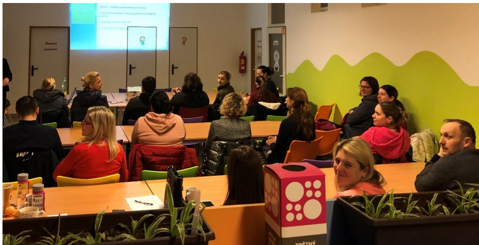
Obrázek č. 8 – Setkání: Naše mateřská škola – „prezentace“.