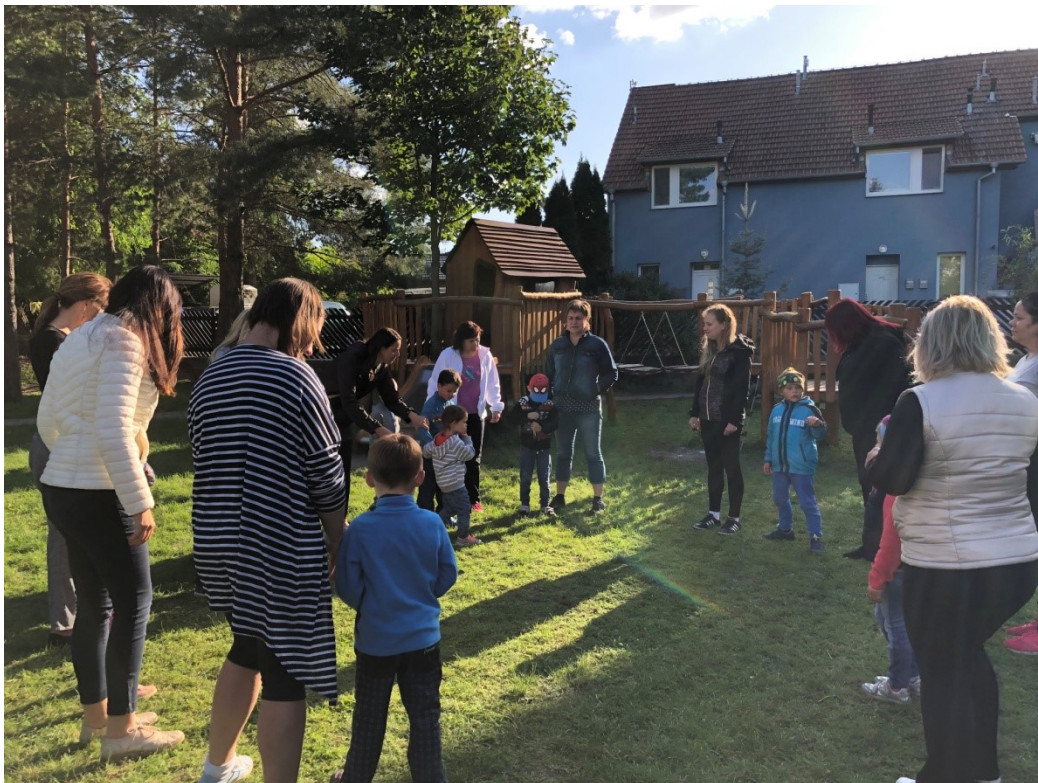
Obrázek č. 1 – Setkání: Rozvoj motorických dovedností dítěte – hra „dostihy“.