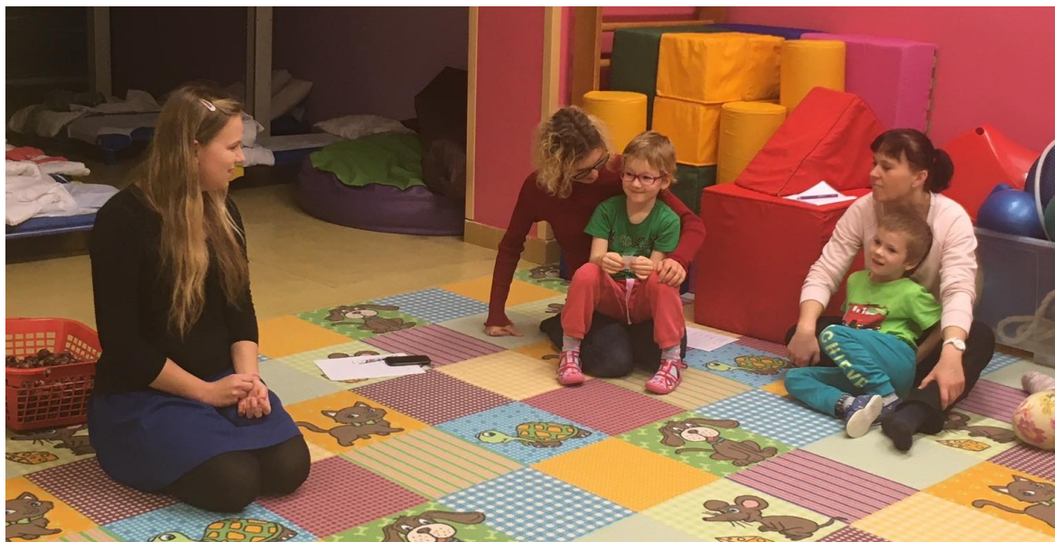
Obrázek č. 5 – Setkání: Rozvoj zrakového vnímání dítěte – hra „zvířátkové pexeso“.