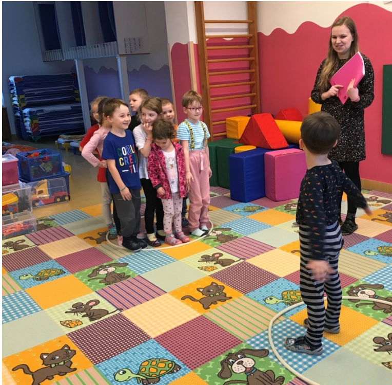
Obrázek č. 7 – Setkání: Rozvoj matematických dovedností dítěte – hra „bubliny“.