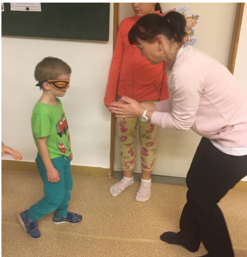
Obrázek č. 3 – Setkání: Rozvoj sluchového vnímání dítěte – hra „zvuková dráha“.