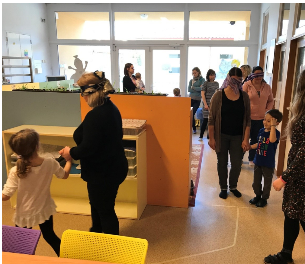
Obrázek č. 6 – Setkání: Rozvoj matematických dovedností dítěte – hra „matematická dráha“.