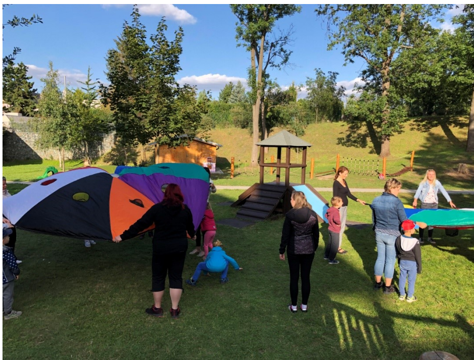
Obrázek č. 2 – Setkání: Rozvoj motorických dovedností dítěte – hra „čáp ztratil čepičku“.