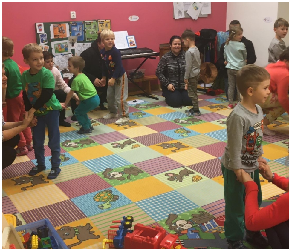
Obrázek č. 4 – Setkání: Rozvoj sluchového vnímání dítěte – hra „příběh s pohybem“.