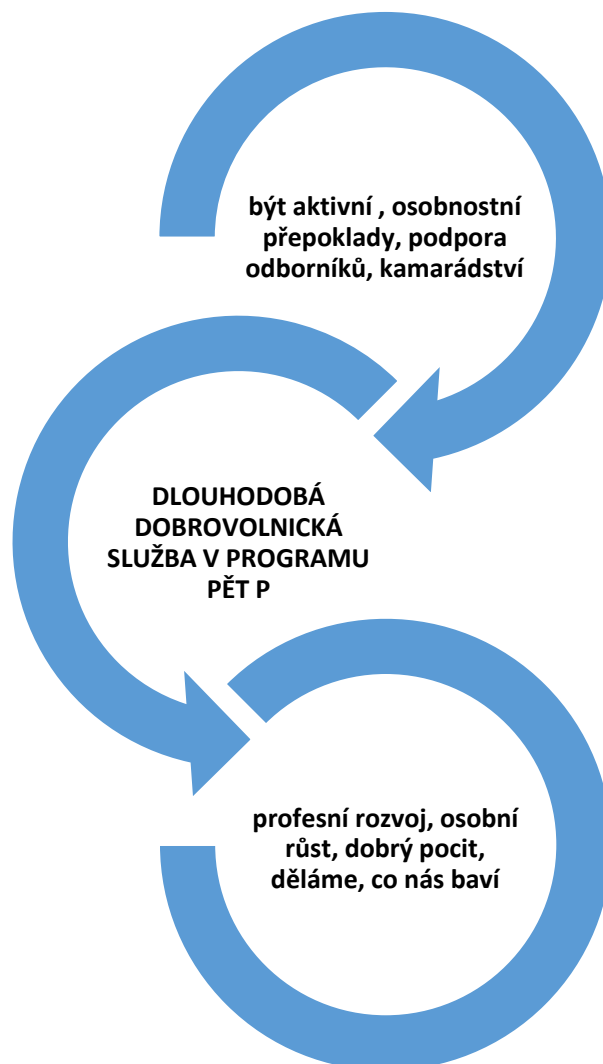
Obrázek 2: Selektivní kódování

Ve finální fázi se dostáváme k selektivnímu kódování, kdy účelem je identifikovat jednu centrální kategorii, ústřední jev. Tímto jevem je v našem případě dlouhodobá dobrovolnická služba v programu Pět P. Tato centrální kategorie je ovlivněna osobnostními předpoklady k dobrovolnické službě, potřeba být aktivní, radost z vzájemného kamarádství. Výsledky jsou pak spojeny s přínosem pro samotného dobrovolníka v oblasti osobního a profesního rozvoje.