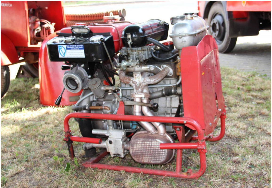
Obrázek č .8 Přenosná motorová stříkačka PS 12