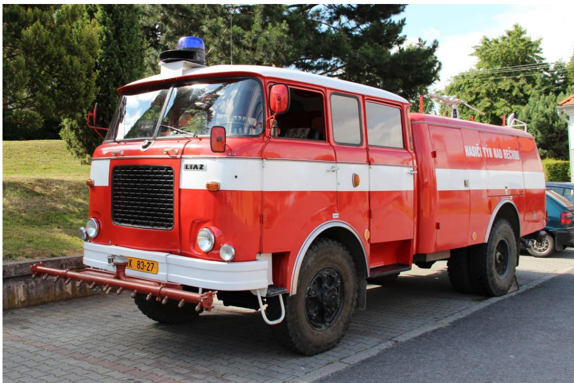
Obrázek č. 7 CAS 25Š 706

V roce 2015 bylo evidováno 39 činných členů sboru, dále 5 čestných členů sboru a 14 žáků a dorostenců. V této době pak v obci existují dva celky, které se zabývají oblastí požární ochrany: MHJ HS Týn nad Bečvou a JSDHO Týn nad Bečvou (Lapáček et al., 2017).