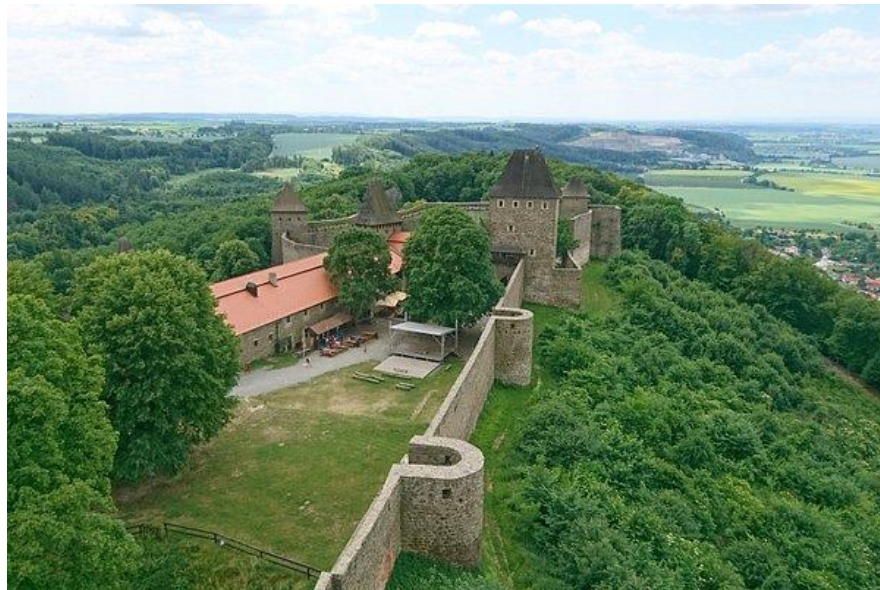
Obrázek č .4 Hrad Helfštýn