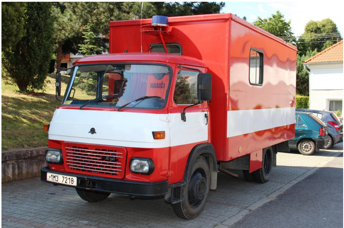
Obrázek č .9 DA Avia 30