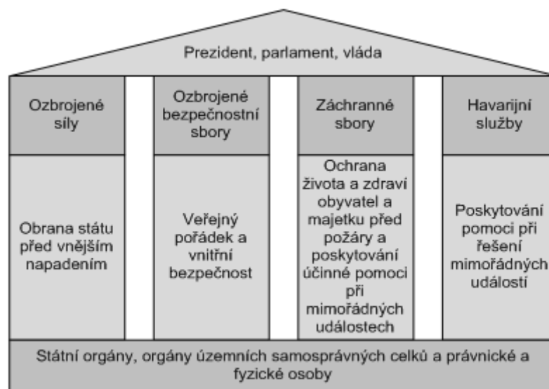
Obrázek č.2 Struktura bezpečnostního systému České republiky