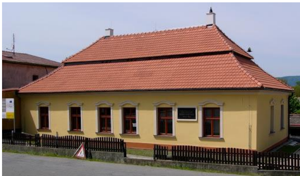
Obrázek č .5 Muzeum Bedřicha Smetany