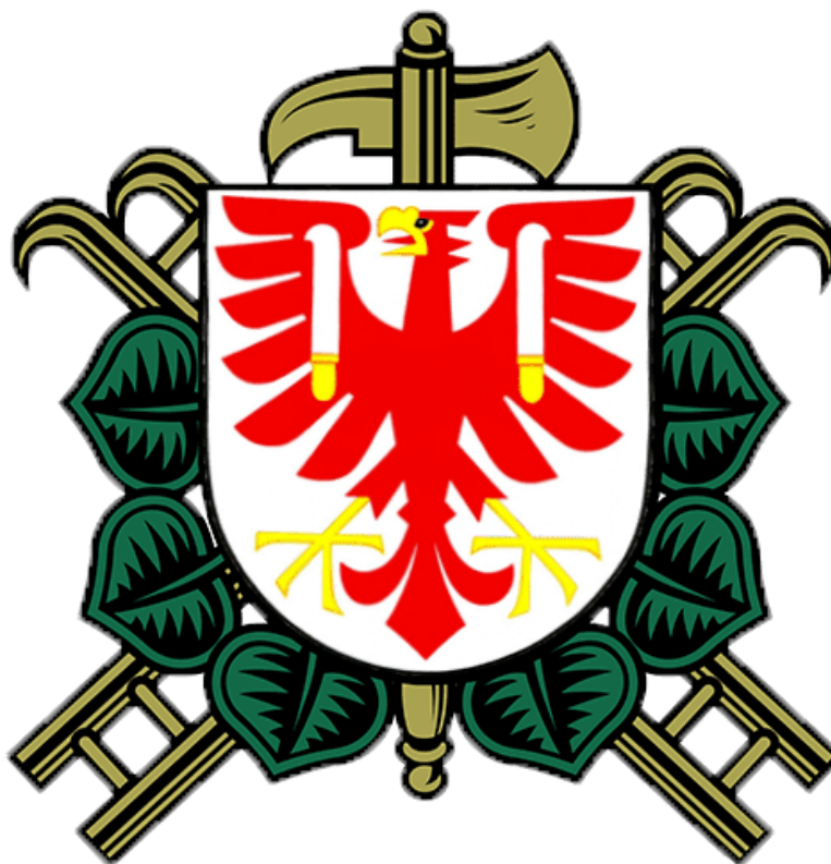
Obrázek č .6 znak JSDHO Týn nad Bečvou