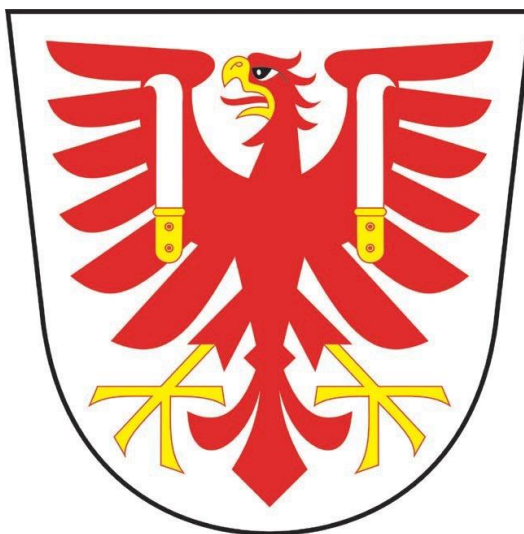
Obrázek č .3 znak obce Týn nad Bečvou