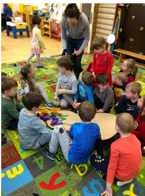
Obrázek 9 Pochování basy

Snažila jsem se o co nejjednodušší popis a uchopení této tradice. Myslím, že děti dosud neměly slovo pochování spjaté s pojmem pohřbu a pohřbívání. Někteří si mysleli, že to znamená chovat miminko. Po aktivitě si pod tímto pojmem dokázaly představit co znamená, že basa je pohřbená. Možná děti pochopily smysl smrti v rámci této aktivity. Když jsem se děti ptala, co je smrt, většinou mi povídaly o svých mazlíčcích, které s rodiči pohřbívaly.