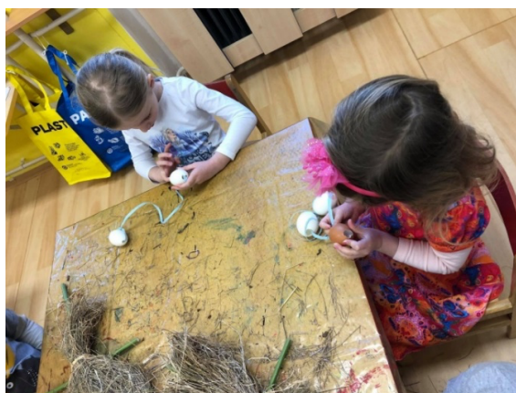
Obrázek 10 Výroba moreny.

Při výrobě Moreny se dětem nejvíce zalíbila suchá tráva, kterou se snažily modelovat na její tělo vyrobené z klacíků. Při výrobě byl ze suché trávy nepořádek. Dětem se velice líbila aktivita navlékání vajec na provázek. K výrobě se, kromě děvčat zapojilo i několik chlapců, kteří se o daný výrobek aktivně zajímali. Dětem jsem pomáhala s uvazováním a modelací suché trávy, což jsem považovala za, pro děti, náročnější činnost.