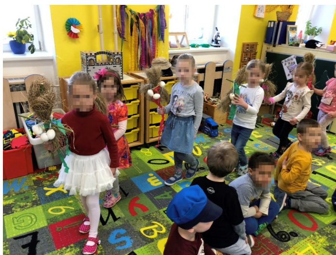
Obrázek 11 Vítání jara.

Dětem se vyrobené Moreny líbily. Zaujaly je především přírodním materiálem a možná také neustále opadávajícími stébly trávy. Při rozhovoru o zimě se zapojily i menší děti, které dokázaly charakterizovat toto období. Starší děti se dokázaly zamyslet nad složitějšími otázkami, například co všechno museli naši předci udělat, aby jim bylo teplo. Děti se snažily odpovídat na tyto otázky. Myslím si však, že i po rozhovoru měly děti představy o zimě v minulosti značně zkreslené. I přes neustále opadávající stébla trávy si děvčata byla při hudební aktivitě jistá svou činností.