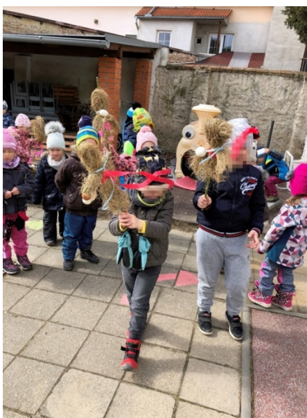
Obrázek 13 Vynášení smrti.

Tento symbolický rituál je pro děti vzácný a důležitý pro jejich další rozvoj. Tato aktivita se liší od ostatních prostorem. Děti byly nadšené, měly radost, že přinesly všem lidem jaro. Menší děti se do aktivit zapojovaly méně, starší si lépe pamatovaly texty písní a říkanek, které si osvojily.