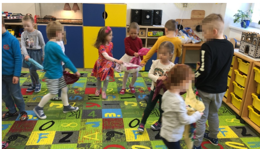
Obrázek 4 Šátečkový tanec

Z reakcí na mé otázky bylo znát, že děti jsou již více seznámeny s tématem masopustu. Menší děti do jisté míry sledovaly nebo opakovaly starší děti. Byla jsem ráda, že děti ihned reagovaly na dané podněty a zajímaly se, co bude následovat. Po skončení tance si dál hrály se šátky. Různě si je uvazovaly nebo házely. Tuto jejich aktivitu jsem zřejmě mohla podpořit tím, že bych dětem ukázala další pohyby, které mohou při písni dělat. Bohužel se mi již nepodařilo získat jejich pozornost, proto jsem je nechala volně si se šátky hrát.