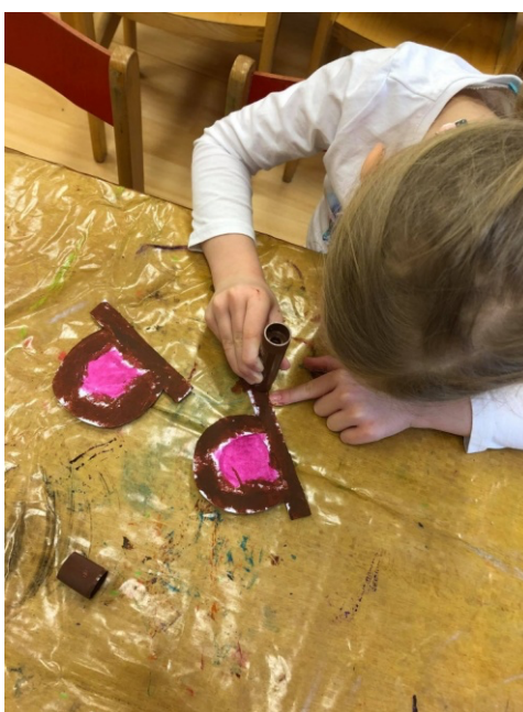
Obrázek 7 Tvorba masek

Děti si sami volily jednotlivé masky zvířat, nejčastěji si volily šelmy nebo motýly. Chtěla jsem i v této aktivitě použít hudební činnosti, zapojené v spontánním tanci dítěte. Děti se uvolnily a nechaly průchod emocím, to jim napomohlo při ztvárnění svého vybraného zvířete.