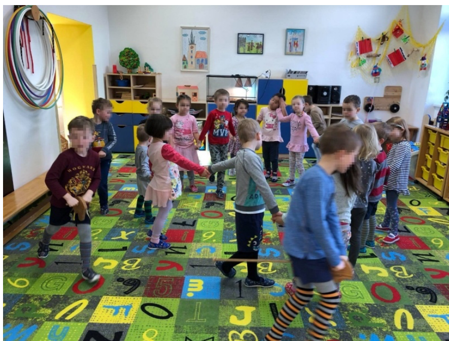
Obrázek 3 Koničkový tanec

Na konci písně jsem se tázala dětí, jak se jim líbil tanec, co by na něm změnily a zda se jim všem povedl. Děti uváděly, že se jim tanec líbí, přidaly by však další zvířata.