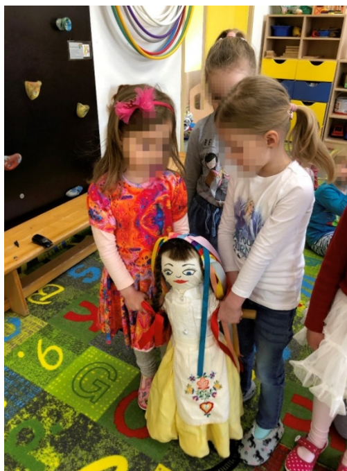
Obrázek 12 Morena.

Při této říkance mi bylo paní učitelkou doporučeno využít hudební nástroje. Naskytuje se možnost rozdělení dětí do tří skupin, kdy první skupina hraje do rytmu na dřívka. Pomocné slovo, které by jim pomohlo hrát do rytmu by bylo mo-ře-na. Druhá skupina by měla další hudební nástroj. Třetí skupina by hrála na bubínek. Vždy by zdůraznily těžkou dobu. Děti, které by neměly hudební nástroj, budou jen říkat říkanku. Možnost je i použít u říkanky šátečkový tanec