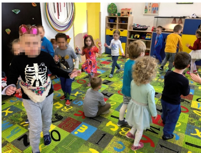
Obrázek 8 Medvěd a Medvědář.

Děti navazovaly na předešlou aktivitu. Chtěla jsem především zaujmout děti tradiční maskou, která není obvyklá na dětských karnevalech. Myslím si však, že děti tato maska příliš nezaujala. Snažila jsem se zaujmout příběhem o jejím původu, proč medvěd a medvědář. Mladší děti pozorovaly starší děti, jak se hýbou a napodobovaly je. Starší děti začaly běhat a honit se jako medvědi. Pro nečekanou událost jsem zvolila zapojení relaxačního cvičení s dechem.