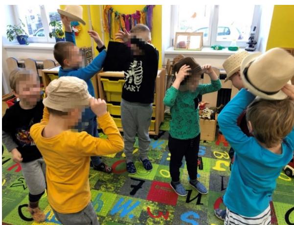
Obrázek 5 Klobúkový tanec.

Zpočátku byli chlapci zmatení, pobídla jsem tedy starší chlapce, aby si předávali klobouk se mnou. Mrzelo mne, že jsem do aktivity nestačila zapojit i děvčata, která mohla tančit s šátky jako v předchozí aktivitě. Chlapci si po opakování aktivity byli v pohybu více jistí.