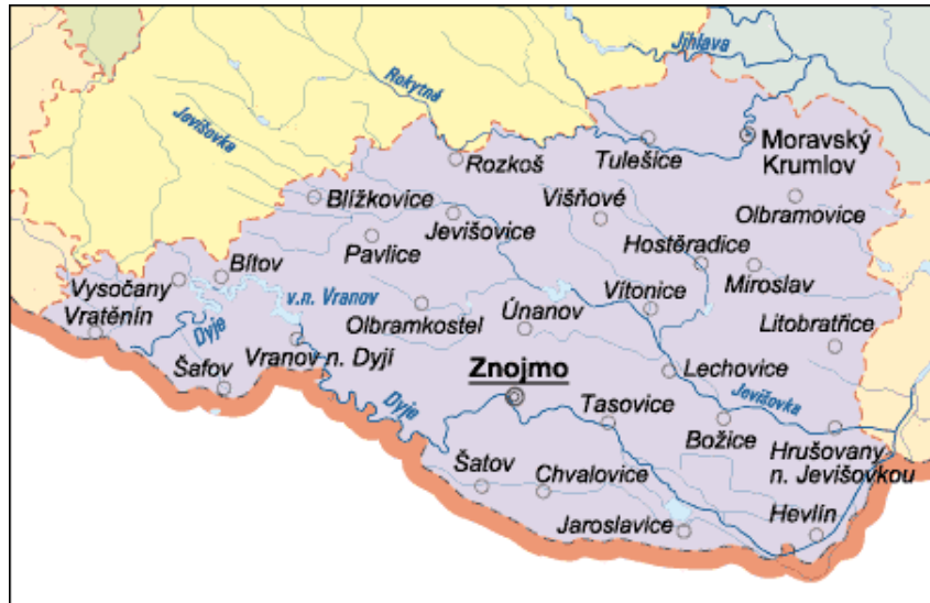
Obrázek 1 Okres Znojmsko

Tato památka byla zařazena mezi národní kulturní památky. Mezi další významné památky tohoto města patří Znojemský hrad, Loucký klášter, kostel sv. Mikuláše a mnoho dalších památek, které jsou zařazeny na seznam kulturních památek České republiky.