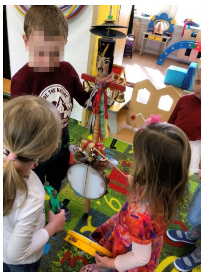
Obrázek 6 Hra na ozembouch.

Při aktivitě jsem se snažila, děti motivovat k vlastní iniciativě ptát se, co je to za nástroj a k čemu slouží. Starší děti ihned věděly, jak mají využít hudební nástroje i se snažily dál tělo ozembouchu ozdobit. Z aktivity jsem však měla dojem, že děti příliš neoslovila. V průvodu děti nedbaly na ostatní a navzájem se rušily při hraní na hudební nástroje.