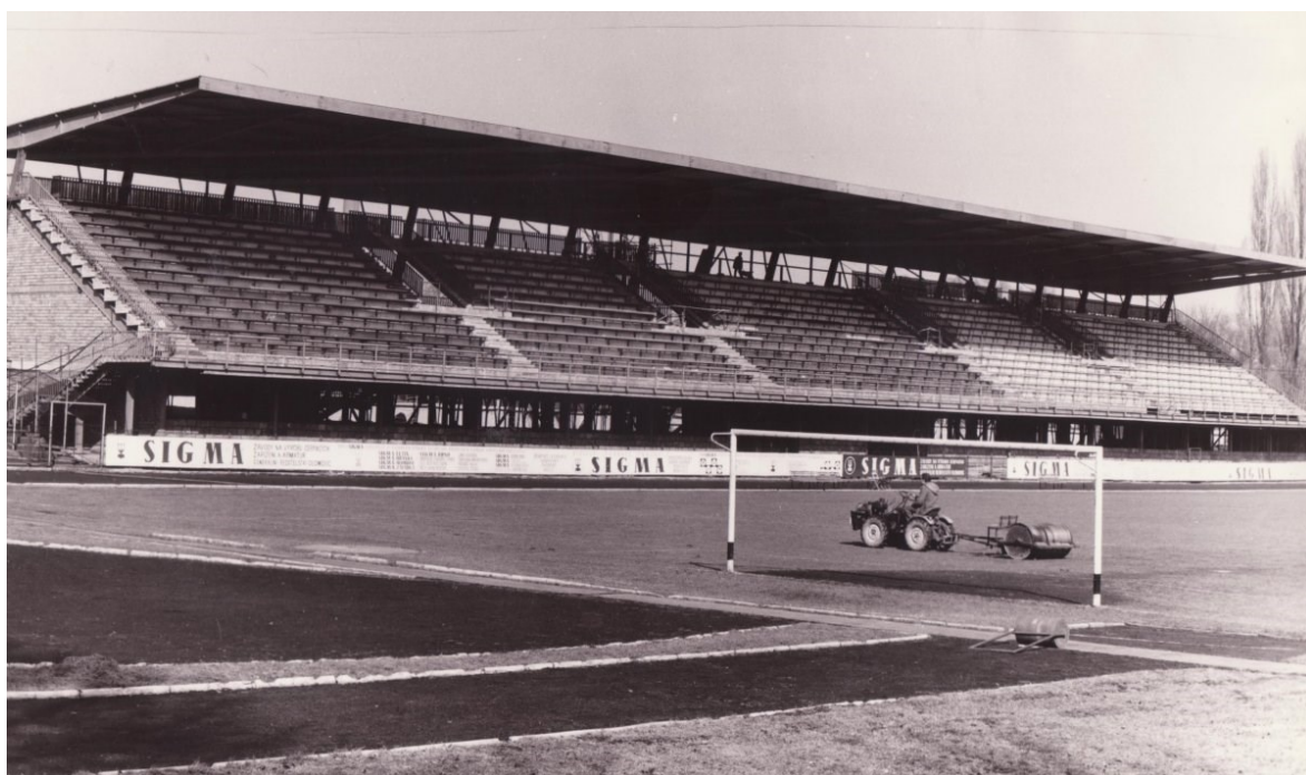
Obr. 5 Konečná podoba nové tribuny [3]