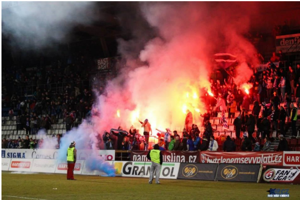
Obr. 6 Ultras na Andrově stadionu [17]