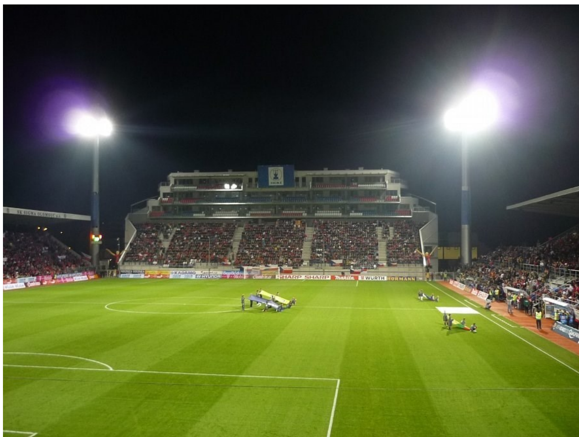
Obr. 11 Slavnostní otevření Jižní tribuny [13]