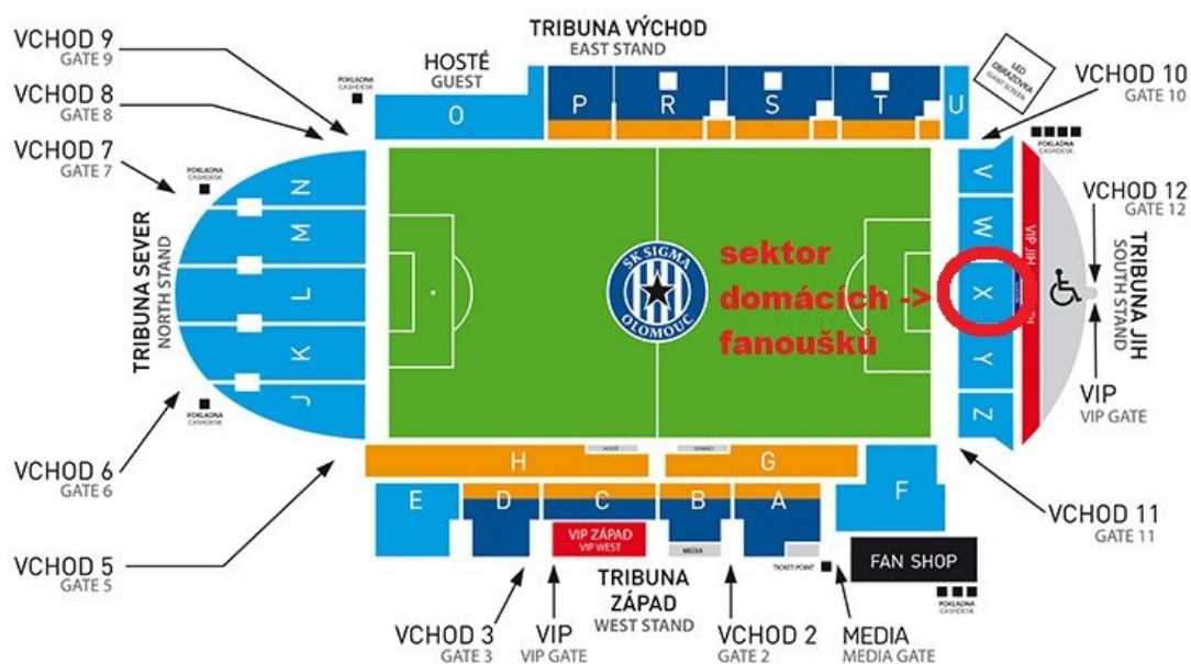
Obr. 19 Přemístění sektoru domácích fanoušků [22]

Sektor domácích fanoušků se přesune na novou Jižní tribunu do sektoru X. Fanouškům bude nabídnuta spolupráce s klubem. Klub na vlastní náklady postaví stupínek pro tzn. „speaker“ a bubeníka. V sektoru postaví zvukovou aparaturu, aby „speaker“ byl pořádně slyšet, navíc uvolní jednu místnost v útroběch tribuny pro fanouškovskou klubovnu. Jelikož klub se marně snažil s fanoušky domluvit na přesunu, tímto krokem se pokusí fanoušky získat na svou stranu a z bezpečnostního hlediska bude mít sektory aktivních fanoušků bezpečně oddělené.