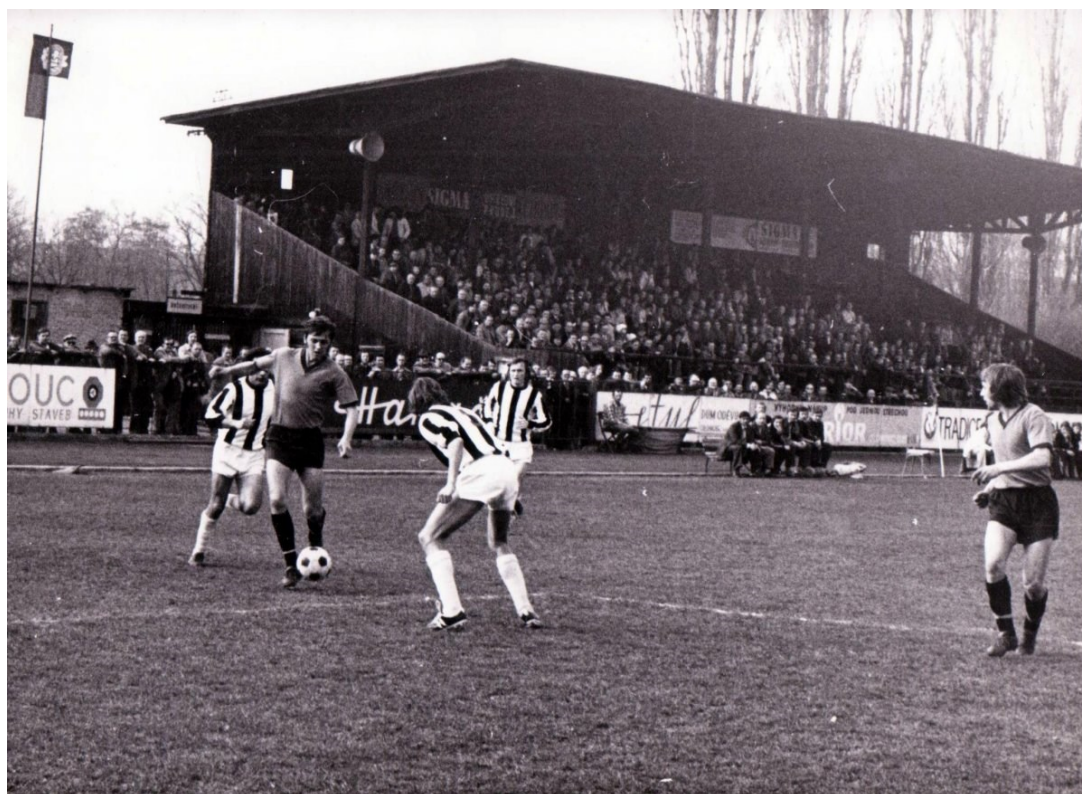
Obr. 3 Dřevěná tribuna „babička“ [3]

„Počátek dnešní podoby Androva stadionu se datuje od jara 1977, kdy byla konečně zbourána dřevěná tribuna a stroje začaly hloubit základy pro hlavní tribunu, která na jaře roku 1979 začala sloužit svému účelu. Tribuna přinesla tolik let postrádané pohodlí nejen divákům, ale i fotbalistům a veškeré zázemí klubu.“ [1]