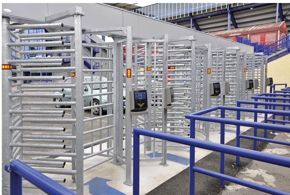
Obr. 17 Integrace turniketů a vstupenkového zařízení [41]

Jelikož jsou navrhované čtecí vstupenkové systémy a systémy kontroly vstupu od stejného potencionálního dodavatele, budou tyto multifunkční prvky integrovány do koncového ovládaného zařízení stejné firmy. Hlavním důvodem je funkční rozhraní zařízení a druhým neméně podstatným je výroba, kdy zákazníkovi firma dodá již plně funkční zařízení, které je nutné pouze oživit.