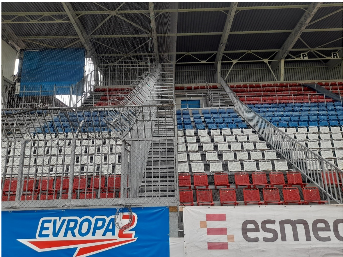
Obr. 13 Zabezpečený sektor hostů [22]