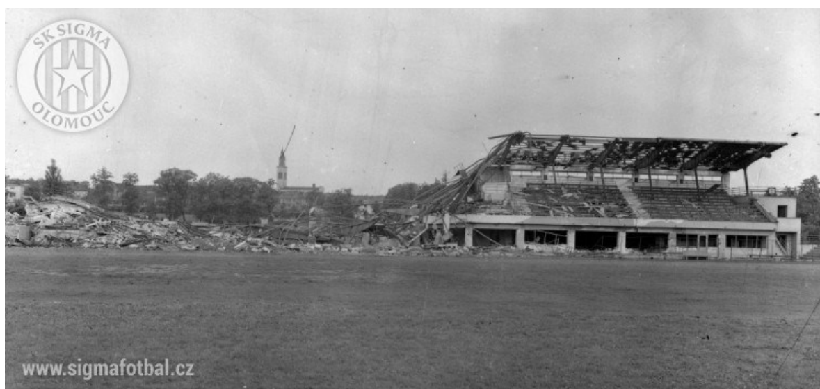
Obr. 2 Železo-betonová tribuna vyhozená do povětří [2]

„Mezitím se na tomto stadionu vystřídalo několik majitelů. V roce 1949 SK ASO Olomouc zanikl a o rok později byl stadion přejmenován na Stadion Míru. Do roku 1955 na jeho trávník hrávalo vojenské mužstvo Křídla Vlasti Olomouc. V dalších letech patřil stadion městu a pak i krátce Slavoji Zora Olomouc. Stadion chátral a v některých letech nebyl vůbec využíván. Mírný obrat k lepšímu nastal v roce 1969, kdy ho dostala k trvalému bezplatnému užívání TJ Sigma MŽ Olomouc. Na stadionu byla prováděna alespoň nejnutnější údržba, a protože sociální zařízení v „babičce“ dřevěné tribuně už naprosto nevyhovovalo, byla v roce 1974 postavena nová budova se šatnami, kanceláři a klubovnou (nynější Fan Shop).“ [1]