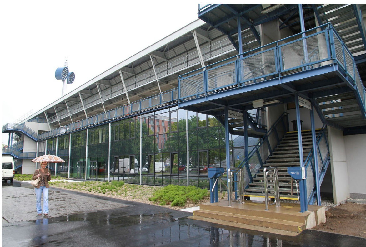
Obr. 12 Vstup na hlavní tribuně [22]

Každá tribuna má vlastní vchody, které jsou vybaveny turnikety. Jedná se o nízké turnikety, které je snadné přeskocit. Turnikety nejsou vybaveny čtecím zařízením, tudíž u každého turniketu stojí bezpečnostní pracovník, který musí manuálně naskenovat vstupenku.