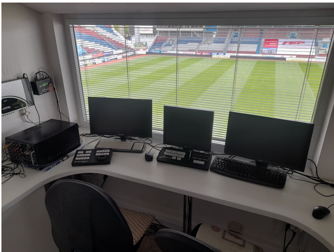
Obr. 14 Velin [22]

Na stadionu se nachází celkem 8 IP kamer, které dokážou přiblížit sledovaný obraz nebo zachytit pachatele, který se dopustil porušení návštěvního řádu.