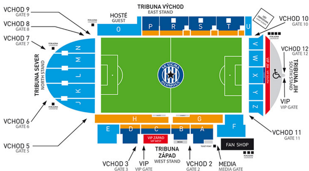
Obr. 2 Plánek Androva stadionu [5]

Každá tribuna má oddělený vchod. Všechny vchody jsou vybaveny turnikety. Tribuny nejsou navzájem průchozí. Při vysoce rizikových utkání jsou sektory P a N uzavřeny z důvodu snazšího zásahu bezpečnostních složek. Celý stadion je střežen kamerovým systémem. Sektor O je vyhrazen pro hostující fanoušky. Domácí aktivní fanoušci jsou v sektoru S.