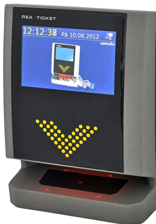
Obr. 16 REA::Ticket [42]

Vstupenkový terminál REA::Ticket z produkce firmy Cominfo a.s. je sofistikované, integrované zařízení. Je odolné povětrnostním vlivům a určeno pro vnitřní ale i venkovní užití. Jeden terminál ovládající jeden prvek slouží k multitaskovému čtení kódů, ale je vybaven i čtečkou karet. [42]