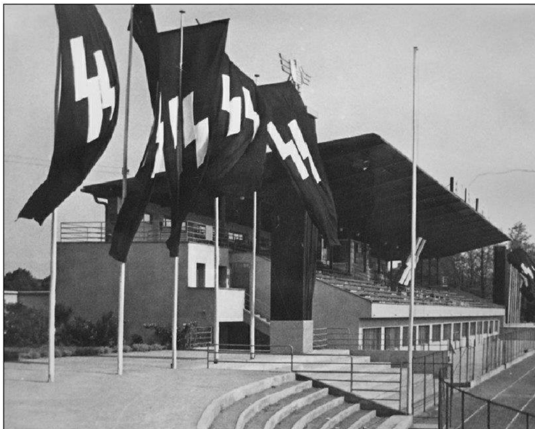
Květen 1943. Stadion Reinharda Heydricha v Olomouci.

v historii přejmenován. Do konce války nesl od roku 1942 název Reinhard Heydrich Kampfbahn, tedy stadion Reinharda Heydricha.“ [2]