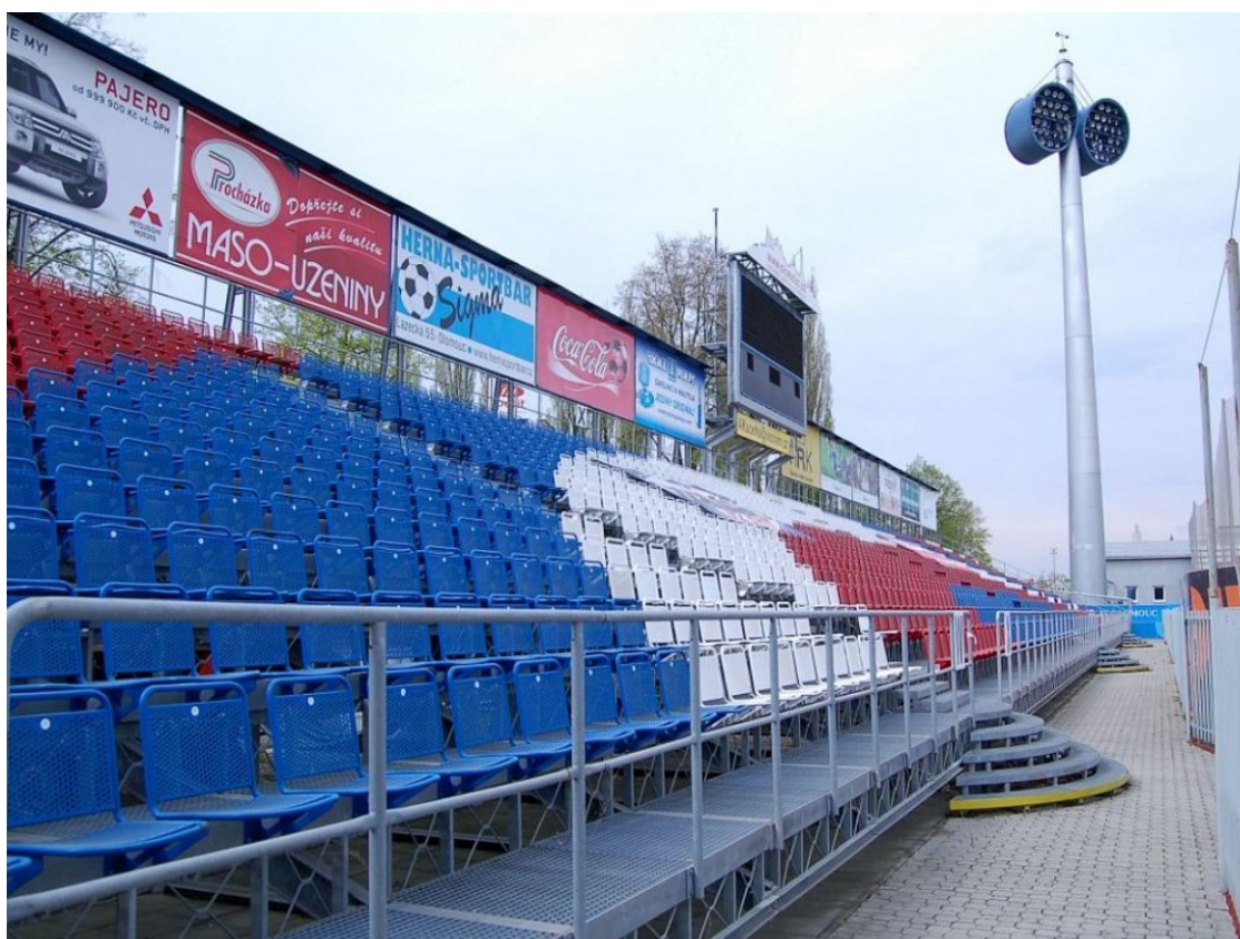
Obr. 8 Původní zmontovaná tribuna [11]

Původní Jižní tribuna byla na přelomu tisíciletí provizorně smontovaná železnou konstrukcí. Tato provizorní konstrukce nesplňovala bezpečnostní kritéria. Neměla dostatečnou kapacitu, minimální mechanické zabezpečení, ale především narušovala estetický vzhled již pěkného stadionu. V roce 2009 byl schválený projekt na rozsáhlou rekonstrukci této tribuny.