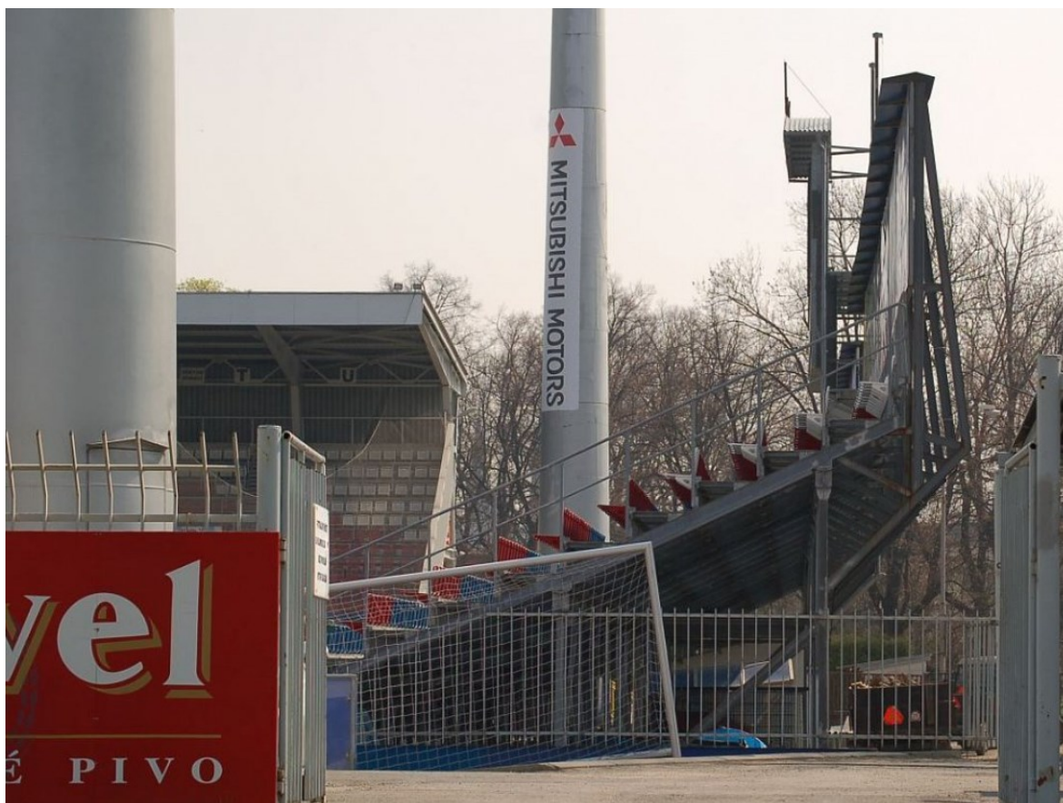
Obr. 9 Boční pohled na tribunu [11]