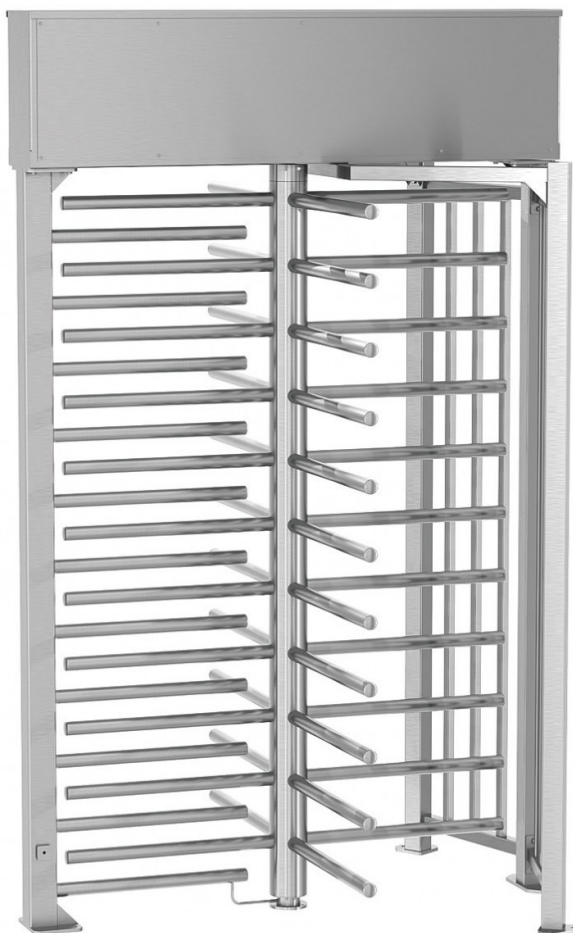
Obr. 15 Turniket REXON ERA 4 [41]

Turniket REXON ERA 4 je díky své lehké ocelové konstrukci úspornější verzí robustního turniketu REXON-DEA. Tento vysoce kvalitní turniket splňuje nejvyšší požadavek na zabezpečení, a to nejen pro svoji výšku, ale také díky velikosti průchodu v úhlu 90°. [41]