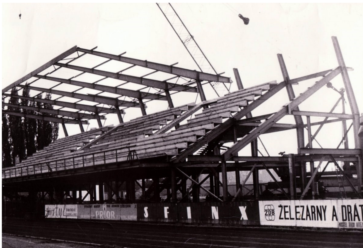
Obr. 4 Stavba nové železo-betonové tribuny [3]