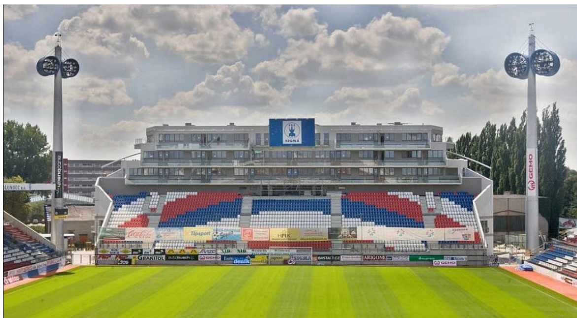
Obr. 10 Pohled na novou Jižní tribunu [12]