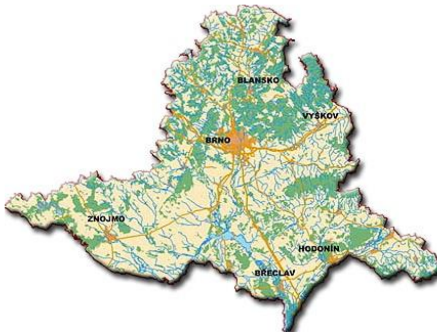
Obrázek 1 Mapa Jihomoravského kraje

Jihomoravský kraj se rozkládá v jihovýchodní části České republiky na hranicích s Rakouskem a Slovenskem. Kraj má 673 obcí a 49 měst. Výhodou kraje je vynikající dopravní dostupnost a strategická poloha na křižovatce transevropských silničních a železničních dálkových tras, které jsou důležitými tepnami spojujícími západní Evropu s východní a severní s jižní. ( Jihomoravský kraj , 2022)