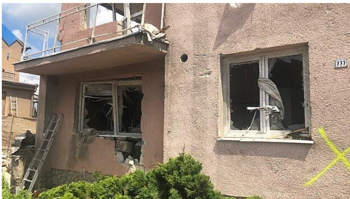
Obrázek 3 Označování domů k demolici.

Nasazení statiků k posouzení poškozených domů začalo 25. června po ukončení prvotních záchranných prací. Během jednoho dne zvládli statici s hasiči zaevidovat budovy, které označili za nebezpečné. Problémem byla nejednotnost značení, jelikož značení křížku (X) jako znak k demolici, se krylo s předchozím značením USAR týmu o prohlédnutí budovy bez osob. Navíc statici nebyli v rozhodování o demolicích za jedno, jeden řekl, že se dům dá opravit, druhý, že má být určen k demolici. Od 27. června do 8. července pak procházeli stavby statici znovu, tentokrát s příslušníky stavebních úřadů, kteří vydávali úřední doklad o provedené prohlídce, se kterým se pak lidé mohli obrátit na pojišťovnu, nebo žádat o dotaci od státu. AČR pracovala v postižených oblastech do 18. července. Několik stovek hasičů pokračovalo v likvidačních pracích až do 22. července 2021. Na místě se postupně vystřídalo asi 2 000 příslušníků HZS ČR a 2 000 dobrovolných hasičů. Nasazeno bylo 600 kusů techniky a celkem HZS ČR provedl 84 demolic ze 191 k demolici určených statiky. Stav nebezpečí vyhlášený hejtmanem JmK byl prodloužen a skončil 23. srpna 2021. (Kramář, 2021; Wassenbauerová, 2021)