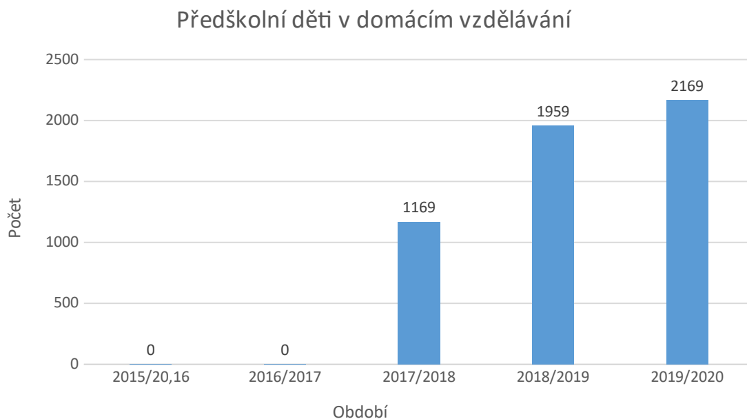
Graf 1 Počet dětí předškolního věku v domácím vzdělávání v letech 2015-2020

(MŠMT 2019), Vývojová ročenka školství 2009/2020