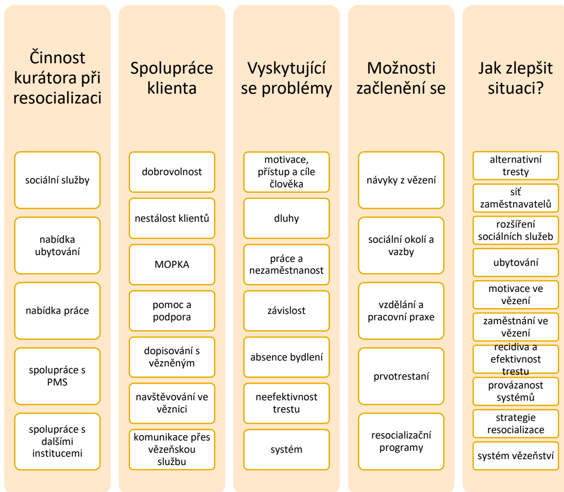
Obrázek 1 Kategorie otevřeného kódování