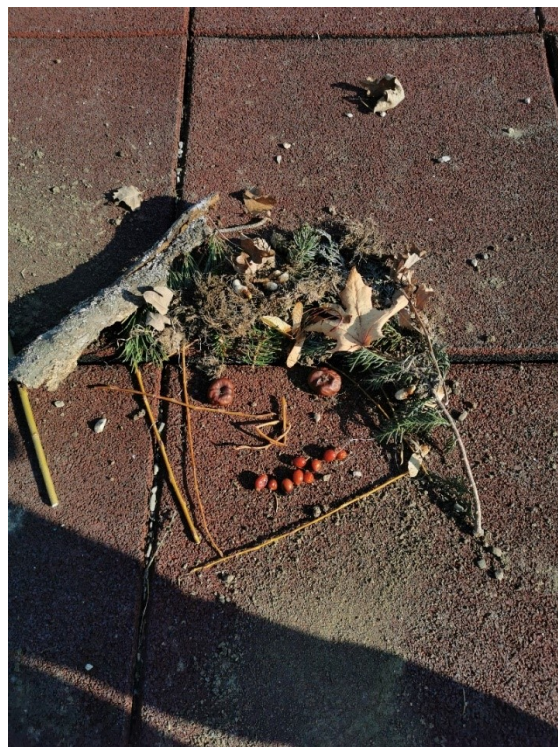
Obrázek 12 Rychlobruslařka