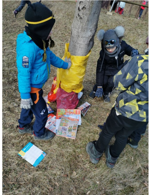
Obrázek 15 Tvorba kostýmu