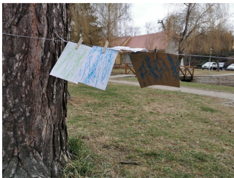
Obrázek 30 Galerie frotáží