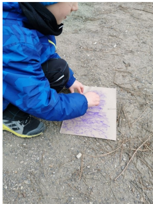
Obrázek 29 Frotáž jehličí