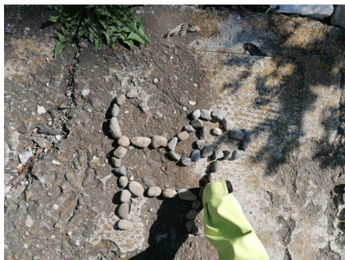
Obrázek 24 Kamenný pes