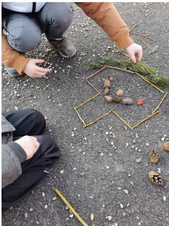
Obrázek 11 Biatlonista