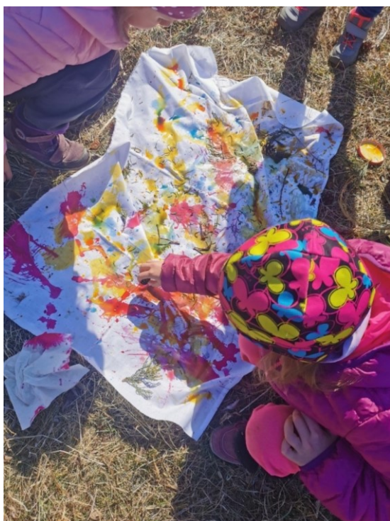
Obrázek 34 Malba šiškou