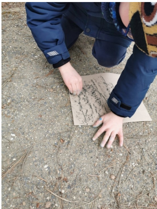
Obrázek 28 Frotáž kamení