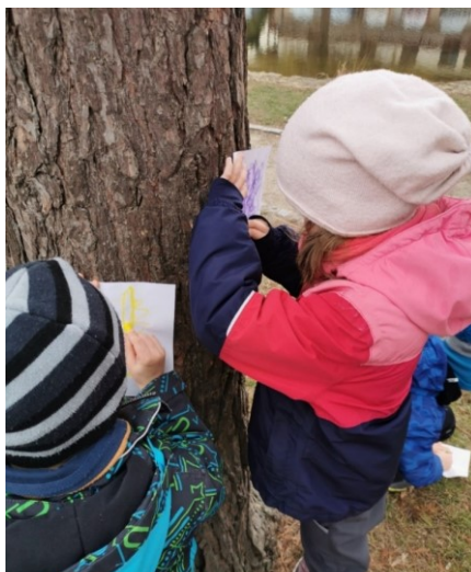
Obrázek 27 Frotáž kůry stromu

Na tomto výstupu bych změnila, jak jsem již uvedla formu vysvětlení techniky frotáže. Přímo bych dětem předvedla, jak mají postupovat, jelikož mnoho dětí při přenášení struktury nepoužívalo celou plochu voskovky ani pastelu. Mnohdy díky kolmému využití kresebných pomůcek vznikla spleť náhodných čar a struktura tak nevynikla. Taktéž se mi zdálo, že bylo prostředí parku málo podnětné, jelikož většina dětí frotovala pouze kůry stromů nebo povrch chodníků. Mohlo to být také způsobeno působením paní učitelky, která jim radila vyzkoušet kůru stromů, což způsobilo, že děti byly málo kreativní.