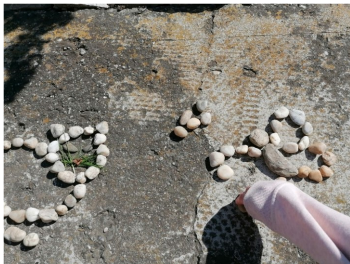
Obrázek 23 Kočka s motýlem