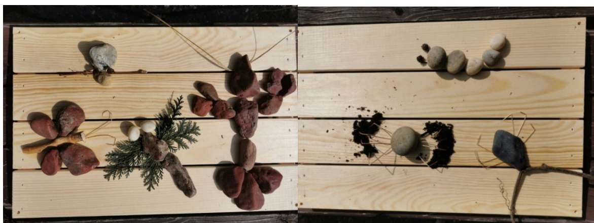
Obrázek 25 Kamenná výstava I