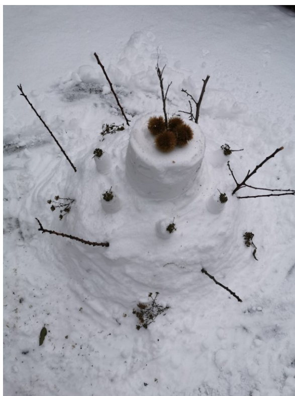
Obrázek 3 Dort s muffiny