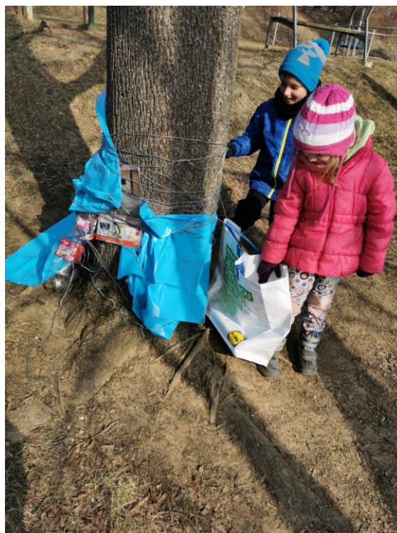
Obrázek 16 Hlídač odpadků