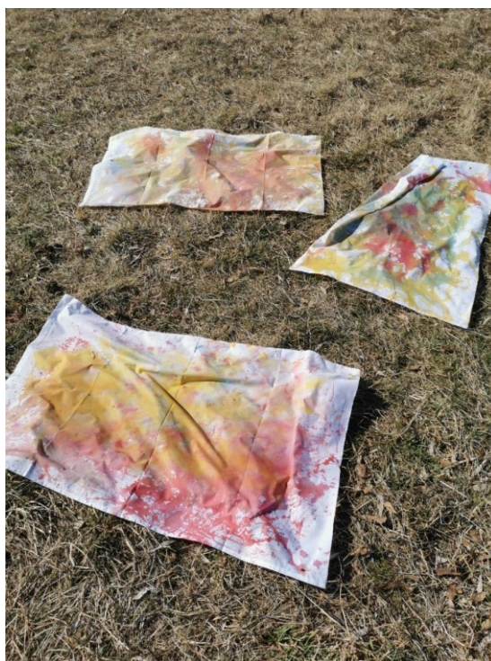
Obrázek 35 Hotové malby