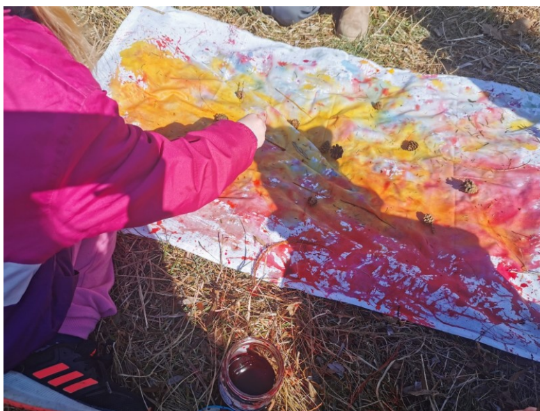
Obrázek 31 Akční malba I

Jedinou nevýhodou se staly špatné povětrnostní podmínky, kdy se nám stalo, že okraj plátna se větrem nadzvedl a překryl část plátna. Děti hledaly řešení, jak se s daným problémem vypořádat. Využily klacíky, které byly určeny původně jako výtvarné instrumenty. Možná bych také plátno, na které děti tvořily nejdříve vyprala, poté by lépe barva přilnula na plátno – zejména u málo pigmentovaných (světлых) barev.