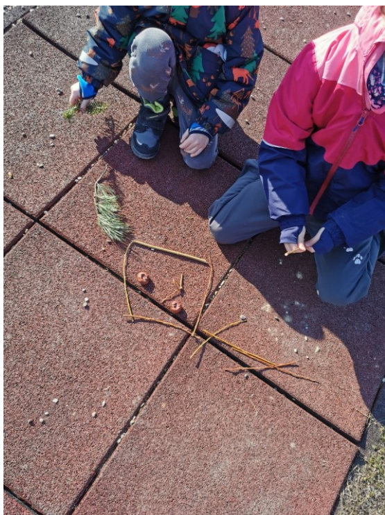
Obrázek 9 Proces tvorby I

Pro tento výstup jsem zvolila techniku asambláže, která byla pro děti novou. Organizační formu při tomto výstupu jsem zvolila vhodně. Děti pracovaly ve dvojicích, domlouvaly se, jakého sportovce či sportovkyni vyobrazí, při tvorbě se doplňovaly. V rámci motivace jsem využila metody rozhovoru, když jsme se s dětmi bavili o olympijských hrách a sportovcích. Metoda vysvětlování byla využita při seznámení dětí s portrétem. Poslední metody dovednostně praktické byly využity v rámci celé tvorby. Oba cíle byly naplněny. Děti rozvíjely představivost tím, že používaly přírodniny pro tvorbu portrétu známé osobnosti, kterou si musely nejprve vybavit a následně její obličej sestavit. Byla tak rozvíjena jejich představivost, děti musely uvažovat o tvarech přírodnin, barvách a jejich uspořádání do tvaru, který vytvářely. Při sestavování děti zacházely s přírodninami, a tak rozvíjely svou jemnou motoriku. Při této výtvarné činnosti se objevil i další cíl, kdy děti rozvíjely komunikaci při domlouvání.