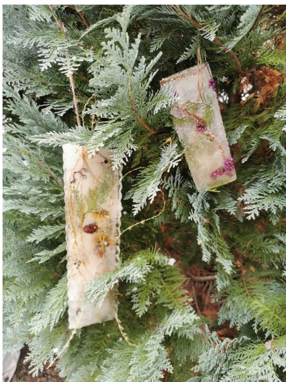
Obrázek 5 Ledové ozdoby