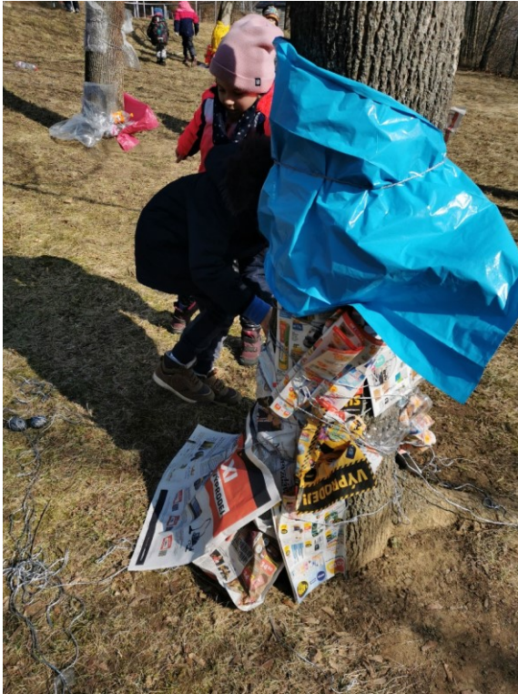
Obrázek 14 Paní v modré pláštěnce

z přírody odstranit a také odpad roztřídit do příslušných kontejnerů. Pro další tvorbu bych zvolila více odpadového materiálu, přišlo mi, že ho nebylo dostatečné množství.