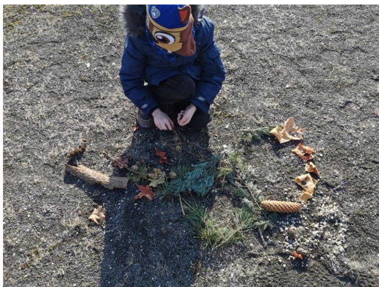
Obrázek 13 Stupně vítězů