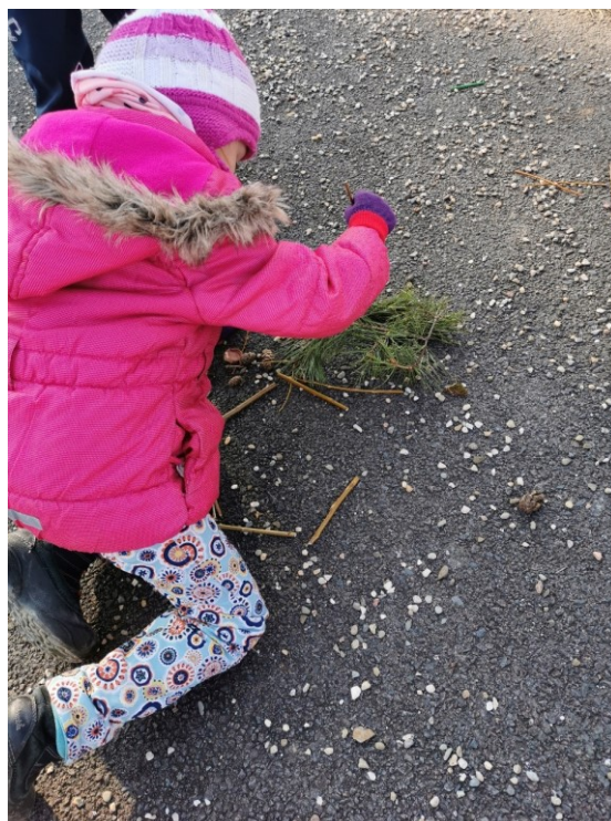
Obrázek 10 Proces tvorby II