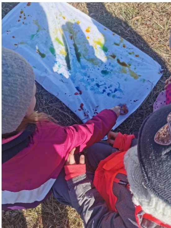
Obrázek 32 Malba přírodním štětcem