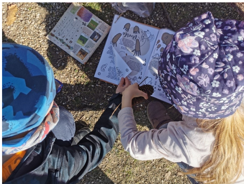
Obrázek 17 Prohlížení stop