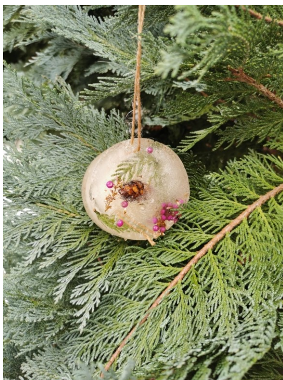
Obrázek 7 Ledová ozdoba III