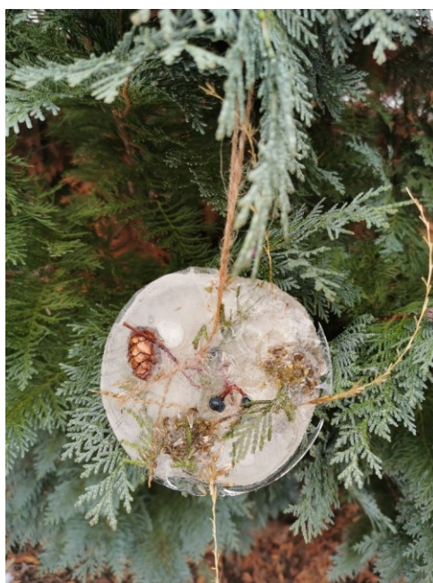
Obrázek 4 Ledová ozdoba I

Organizační forma v rámci tohoto výstupu byla naplněna. Při tvorbě děti pracovaly ve skupině a domlouvaly se na krocích tvorby. Metody byly zvoleny vhodně. Využito bylo i pozorování, kdy děti sledovaly změny skupenství (mrznutí vody) v nádobkách. V rámci motivace jsem využila i metodu pokusu. Při této činnosti jsem využila propojení prostorové tvorby s koláží, jelikož výsledná ozdoba byla prostorového charakteru a vyskládané přírodniny v ozdobě tvořily jednoduchou koláž. Pro další ledové tvoření bych zvolila menší nádoby, jelikož ozdoby byly velké a jejich instalace na keřích tak byla ztížena. Stačit by mohla tvořítka na led. Druhou možností by bylo zvolit jiné místo pro pověšení. Také by postačilo nalít do nádobek méně vody. Z této činnosti plyne i doporučení – pokud by nám počasí nepřálo a přes den ani v noci by nebyly teploty pod bodem mrazu, lze využít mrazničky.