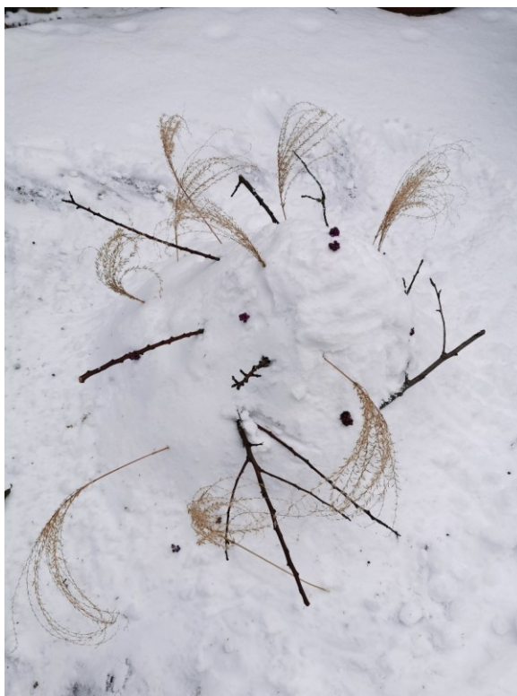
Obrázek 2 Krtkův dort