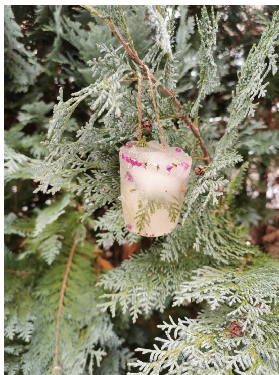
Obrázek 6 Ledová ozdoba II