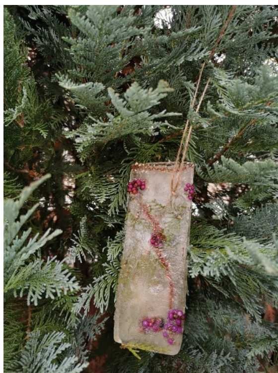
Obrázek 8 Ledová ozdoba IV