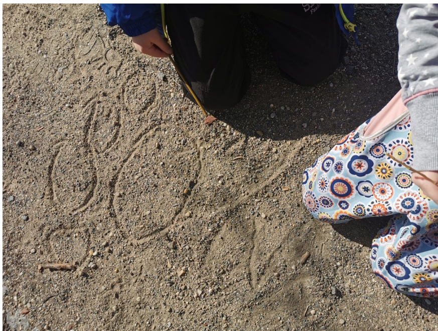
Obrázek 20 Stopa medvěda