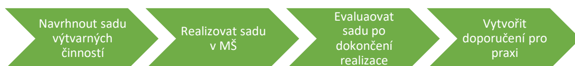
Obrázek 1 Cíle praktické části

Praktická část práce se zabývá aplikací zjištěných informací týkajících se možností tvorby mimo prostory mateřské školy. Cílem této části je navrhnout sadu výtvarných činností, které lze s dětmi realizovat v různorodých prostředích za využití vnesených či nalezených materiálů. Navržené výtvarné činnosti by měly rozšířit povědomí o nových možnostech tvorby a zhodnotit jejich přínos předškolnímu vzdělávání. I proto po realizaci sady výtvarných činností bude provedena jejich reflexe a evaluace. Zmíněné cíle praktické části jsou graficky vyobrazeny níže.