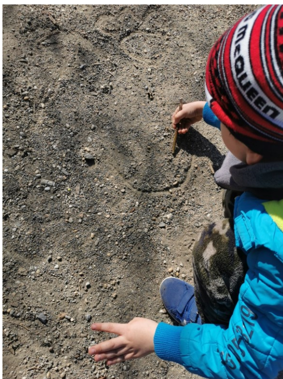
Obrázek 18 Veverčí stopa