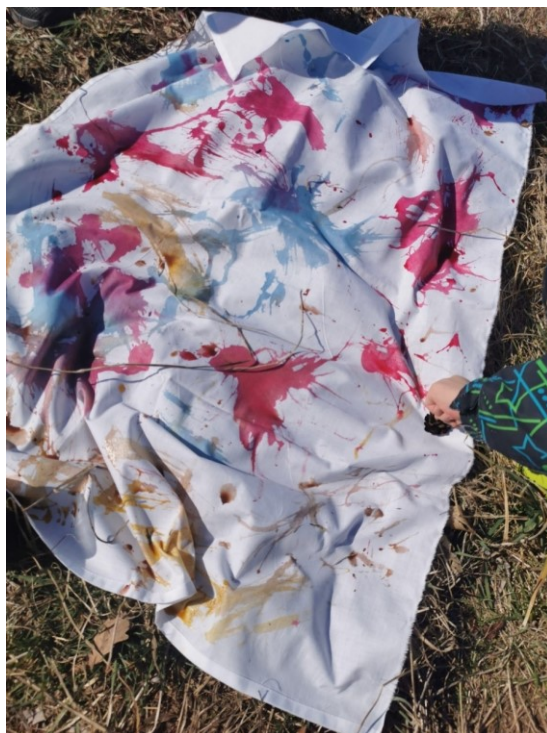
Obrázek 33 Akční malba II