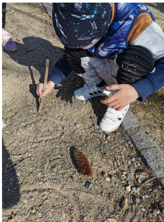
Obrázek 19 Stopa koně