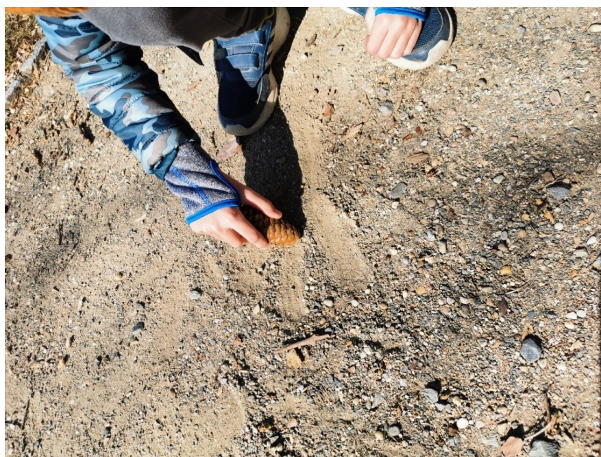
Obrázek 21 Ptačí stopa